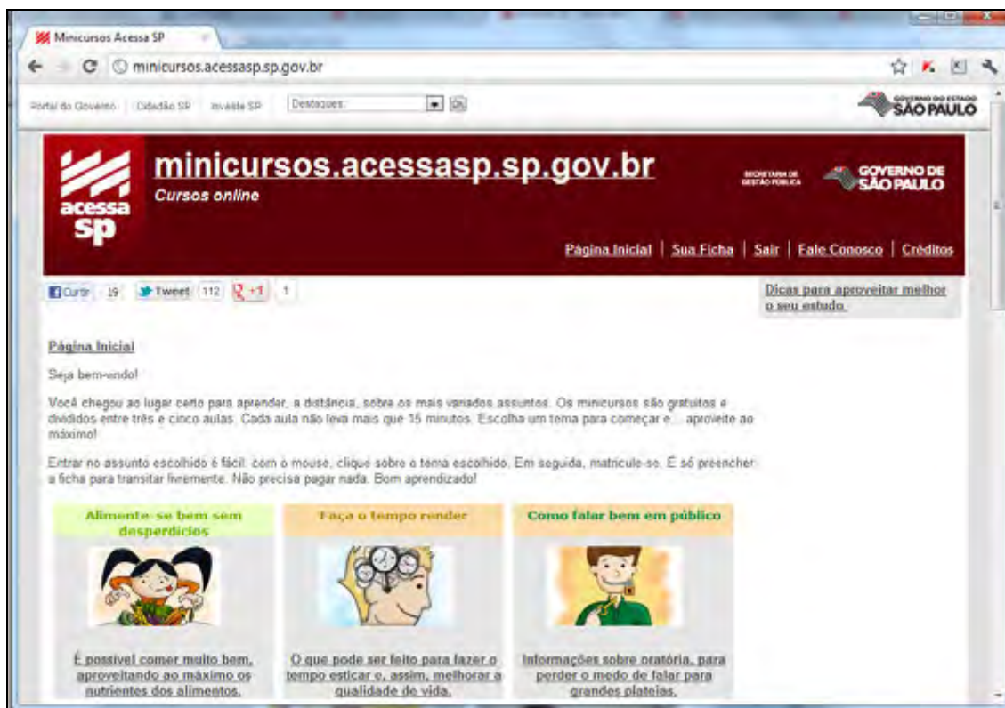
Figura 3 – Página dos Minicursos do Programa Acessa São Paulo

Outra função presente entre as possibilidades oferecidas pelo sítio do Programa Acessa São Paulo é a listagem de links úteis para utilização do governo eletrônico. Atualmente, muitas funções do governo nas suas diversas dimensões: municipal, estadual e federal, estão presentes para acesso e utilização via internet e o Acessa São Paulo se configura como uma oportunidade de uso desses serviços (O QUE..., [c2012?]).