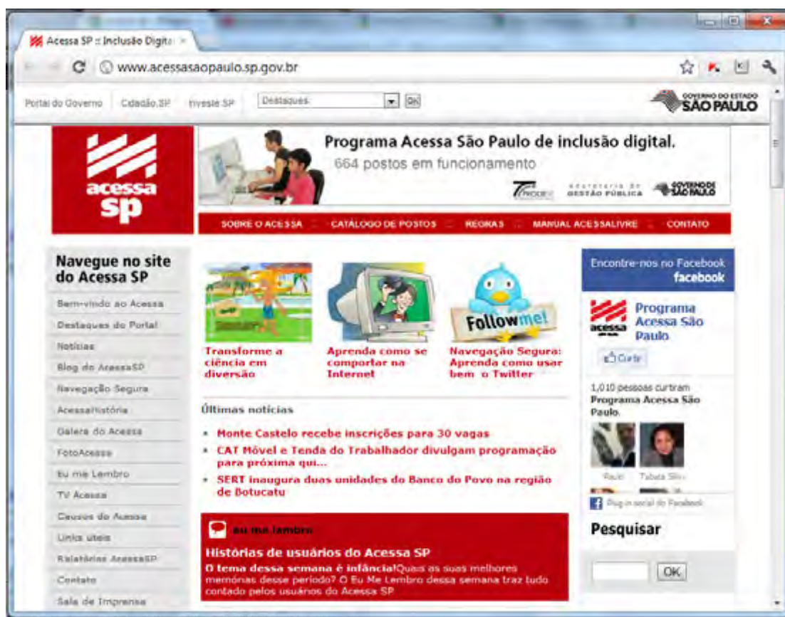
Figura 1 – Sítio oficial do Programa Acessa São Paulo

Para compreender a composição do Acessa São Paulo utilizou-se as informações do sítio oficial (figura 1). Trata-se de um programa de inclusão digital desenvolvido pelo Governo do Estado de São Paulo, com coordenação da Secretaria de Gestão Pública e gerido pela Companhia de Processamento de Dados do Estado de São Paulo – Diretoria de Serviços ao Cidadão – Prodesp (O QUE..., [c2012?]).