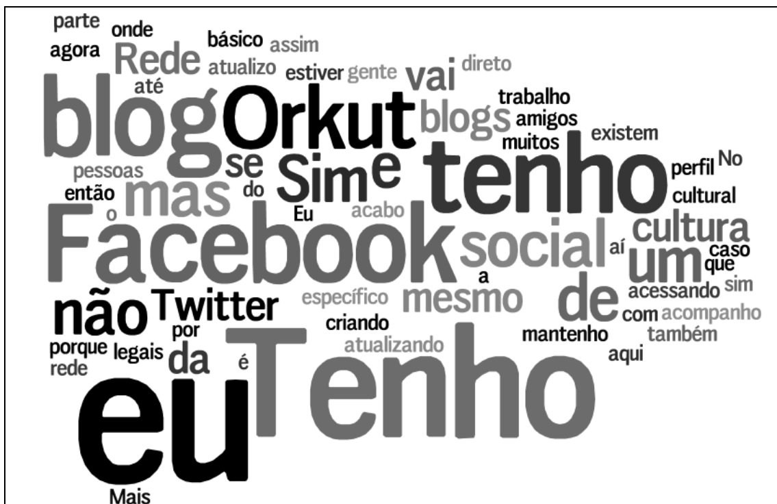
Figura 19 – Possui blogs ou perfil em redes sociais.

Dessa forma, a internet passa a configurar como o veículo de informação que possibilita uma participação ativa entre emissor e receptor, havendo a troca de mensagens emitidas por ambos os lados do processo de forma instantânea, fato esse que motiva os seus usuários a se inserirem nesses ambientes e não somente acompanhar os conteúdos publicados.