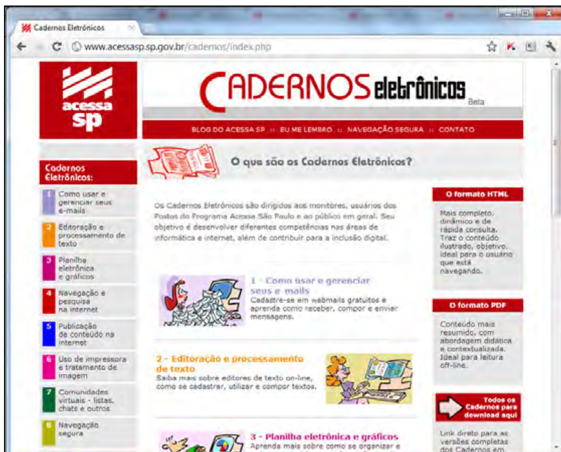
Figura 2 – Página dos Cadernos Eletrônicos do Programa ACESSA São Paulo

Outra ação é o desenvolvimento de materiais eletrônicos 35 para consulta pelos usuários. Esses materiais recebem o título de Cadernos Eletrônicos (figura 2) e abordam temas múltiplos, desde o uso de e-mails até as ferramentas on-line da web 2.0 , trabalhando assim uma amplitude temática relevante para os usuários da internet (O QUE..., [c2012?]).