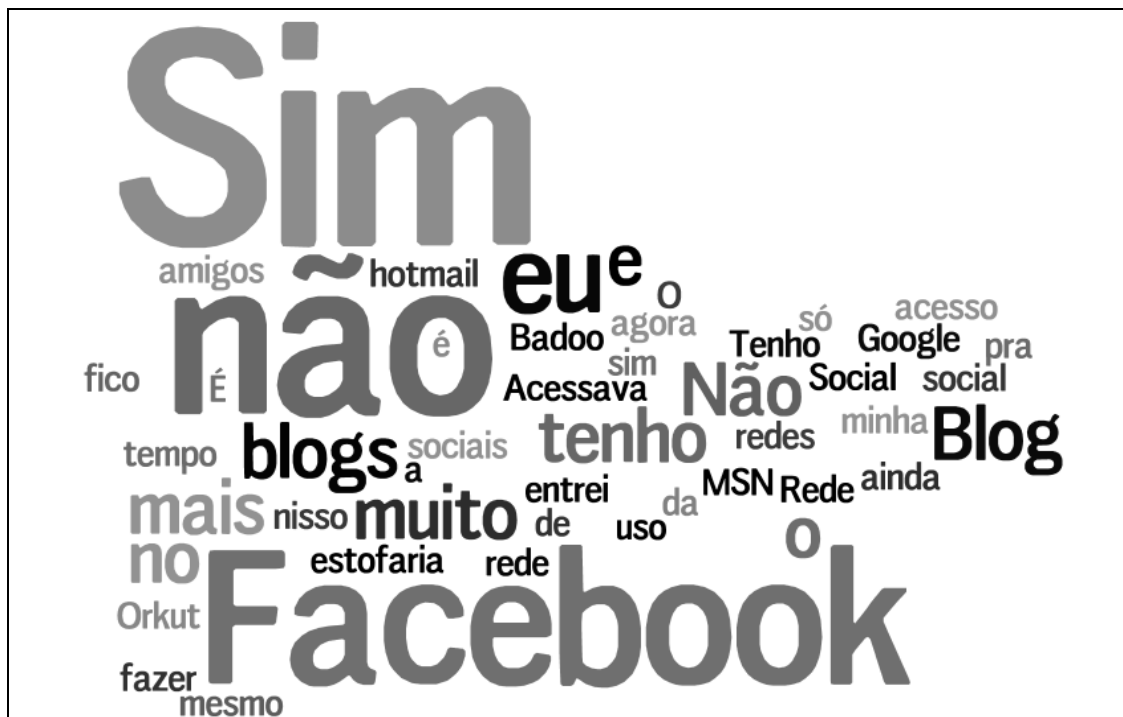
Figura 17 – Acesso a blogs e redes sociais.

A oitava questão complementava a sétima ao questionar os participantes a respeito de possuir blogs ou perfis em redes sociais e assim permitir identificar não apenas o uso, bem como o domínio dessas ferramentas. Por isso a questão foi a seguinte: Você tem blogs ou perfis em redes sociais?