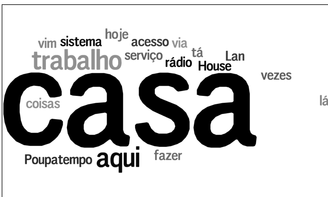
Figura 9 – Locais de acesso à internet.

A reincidência da residência como resposta ao local de acesso é reafirmada na figura 9, em que a palavra “casa” ganha significativa relevância em comparação aos outros locais, indicando que esse espaço surge na maioria das vezes como alternativa a outras possibilidades de acesso, o que não configura uma exclusão ou substituição do acesso, mas sim uma complementação entre as oportunidades de utilização dos espaços de acesso à internet.