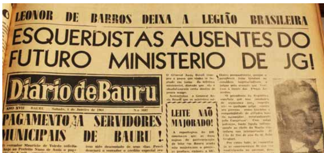
Manchete do DB de 04 de janeiro de 1964

Por outro lado, as esquerdas já se convenceram de que sua participação no governo, dentro do novo ministério está praticamente superada. ( Diário de Bauru , 4 de janeiro de 1964, p.1)