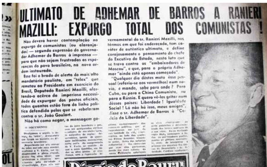
Manchete do DB do dia 04 de abril de 1964

presidente da República Ranieri Mazzilli pedindo com fervor o expurgo imediato de todos os comunistas que ocupavam cargos públicos.