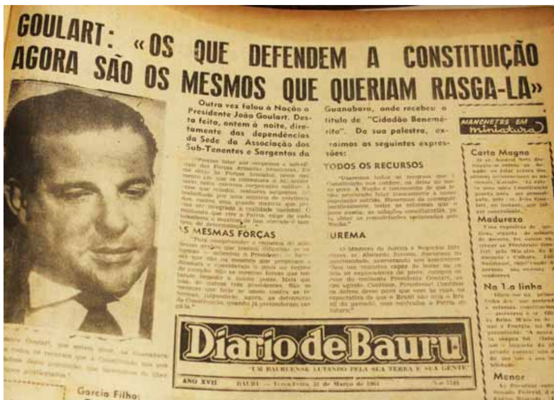
Manchete do DB do dia 31 de março de 1964

A última fala em público de João Goulart como presidente da República aconteceu na noite do dia 30 de março na Sede da Associação dos Sub-Tenentes e Sargentos da Guanabara, onde recebeu o título de “Cidadão Benemérito” e trechos de sua explanação foram transcritos pelo DB no dia seguinte e publicados com destaque na primeira página. Abaixo um trecho do discurso o qual João Goulart esclarece quem são seus opositores.