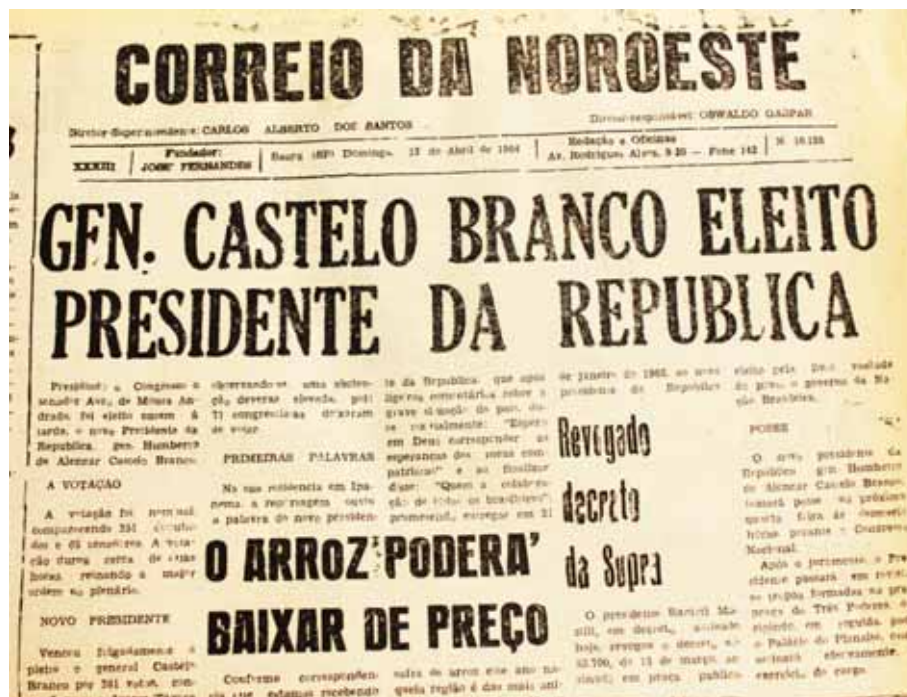
Manchete do CN de 12 de abril de 1964

Raras vezes o CN destacou como manchete principal um episódio nacional. No dia 12 de abril, a capa foi a seguinte: