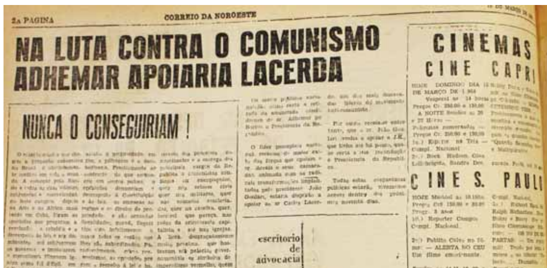
Página 2 do CN de 15/03/1964

certo descontentamento com o governo vigente. O jornal enfatizava essas notícias e fomentava a disputa, colocando entre os nomes mais cogitados Carlos Lacerda, Carvalho Pinto e Juscelino Kubitschek.