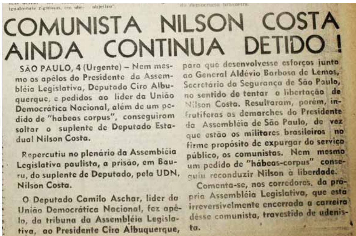
Notícia na primeira página do DB no dia 05 de abril de 1964

relatou: “(...) comenta-se nos corredores da própria Assembleia Legislativa, que está irreversivelmente encerrada a carreira desse comunista, travestido de udenista.” 60