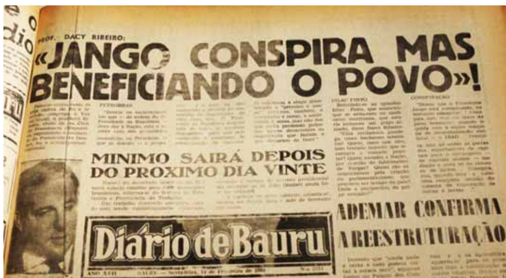
Manchete do DB de 14 de fevereiro de 1964

O periódico, no entanto, dedicava espaço tanto para os pronunciamentos da oposição como da situação. Considerando as declarações de Bilac Pinto, o Ministro da Casa Civil, Professor Darcy Ribeiro, respondeu ao deputado udenista defendendo Jango em uma cadeia de rádio e televisão. Sua fala foi a manchete do dia 14 de fevereiro.