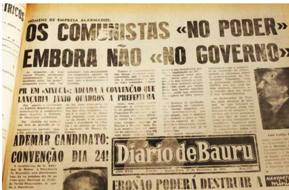
Manchete do DB de 13 de fevereiro de 1964

Um dos episódios mais marcantes foi a repercussão do pronunciamento de Luiz Carlos Prestes afirmando que os comunistas estariam no poder, mas ainda não no governo. A declaração recebeu grande destaque do jornal e foi a manchete principal do dia 13 de fevereiro.