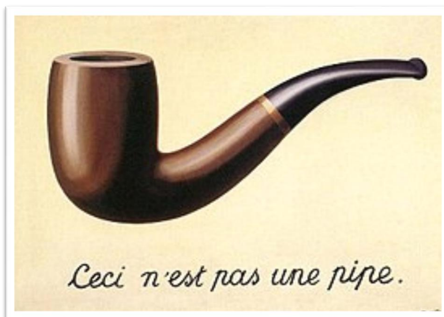
Figura 5 – Ceci n'est pas une pipe, de René Magritte