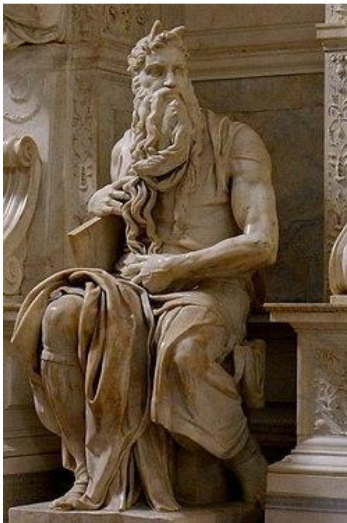
Figura 3 – A estátua de Moisés, de Michelangelo