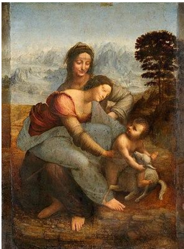
Figura 1 – Retrato de Sant’Ana com a Madona e o Menino, de Leonardo da Vinci