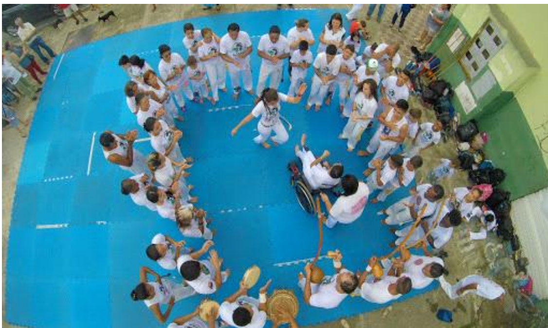
Figura 8 – Vista aérea da Apresentação Mensal ao ar livre da Roda de Capoeira Nação Cultural.

calçada da Previdência Social, Vale do Ribeira, São Paulo, 2016.