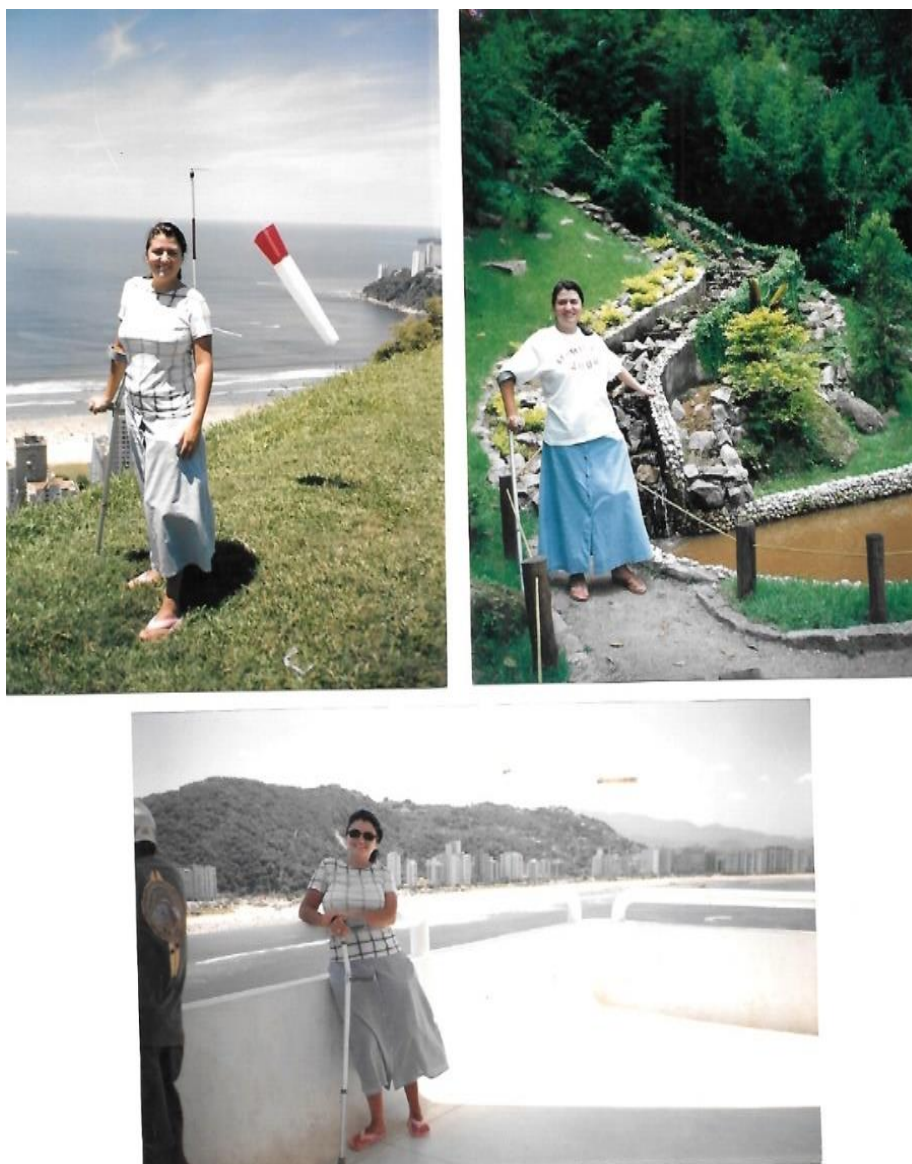
Figura 12 – Combinação de três fotos retratam a pesquisadora com sua deformidade, na época de segurada pela Previdência Social, em viagem.

vista panorâmica do monumento Niemeyer na Ilha Porchat, São Vicente, Baixada Santista, janeiro, 2001. 7