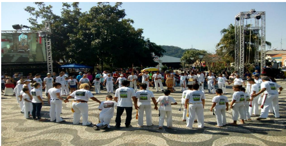
Figura 6 – Roda de Capoeira Nação Cultural na Festa do Bom Jesus.

A figura a seguir mostra a Roda de Capoeira Nação Cultural acontecendo em Iguape, com os participantes unidos em praça pública para iniciar a apresentação. Antes de essa roda acontecer, tivemos muitos problemas, como mostrou a escritura anterior, e, durante a apresentação, fomos interrompidos inúmeras vezes. Manifestações dos romeiros motociclistas, literalmente, nos atropelavam.