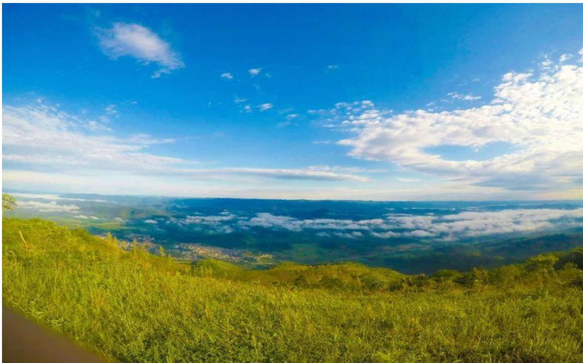
Figura 13 – Vista Panorâmica da Serra do Manecão após trilha ecológica.

Fonte: Adriano Pirulito 8 , Vale do Ribeira, São Paulo, 2019.