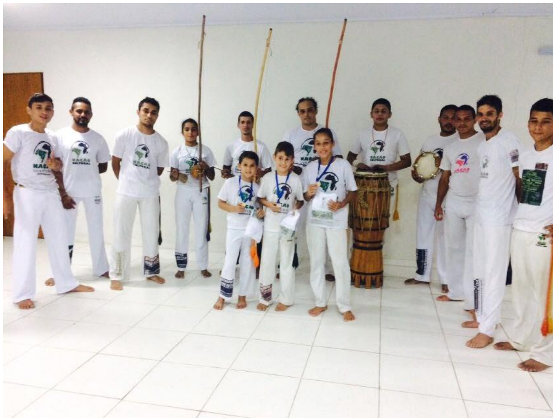
Figura 2 – Grupo Nação Cultural celebrando medalhas, em um dos espaços cedidos pela prefeitura.