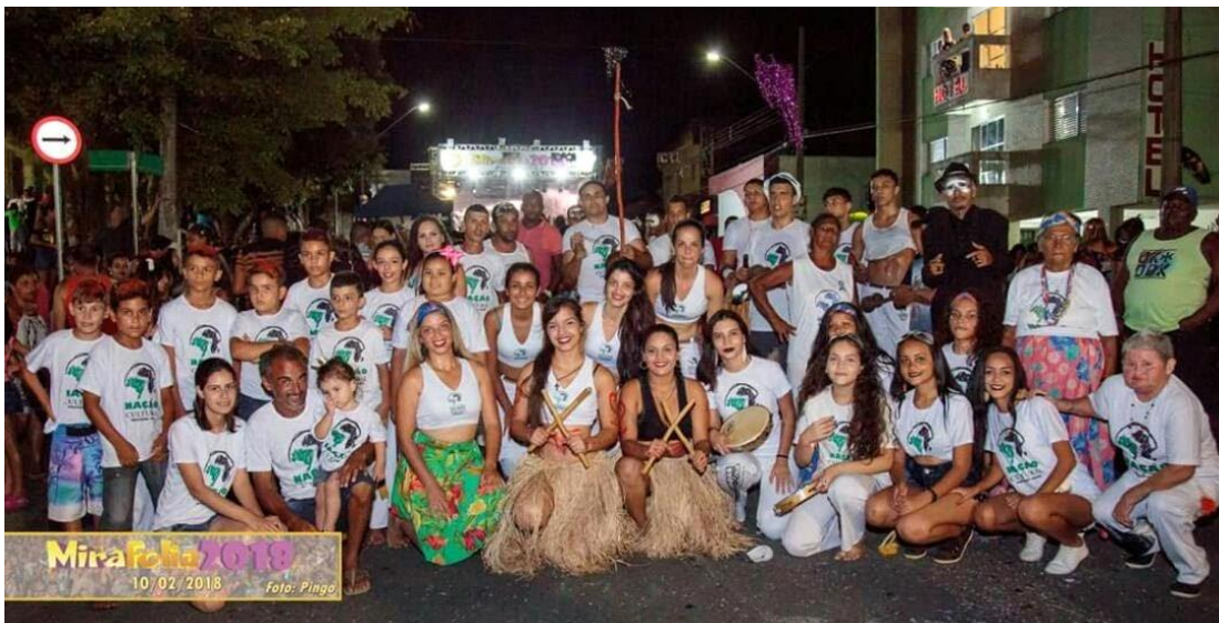
Figura 4 – Grupo Nação Cultural no bloco de carnaval.