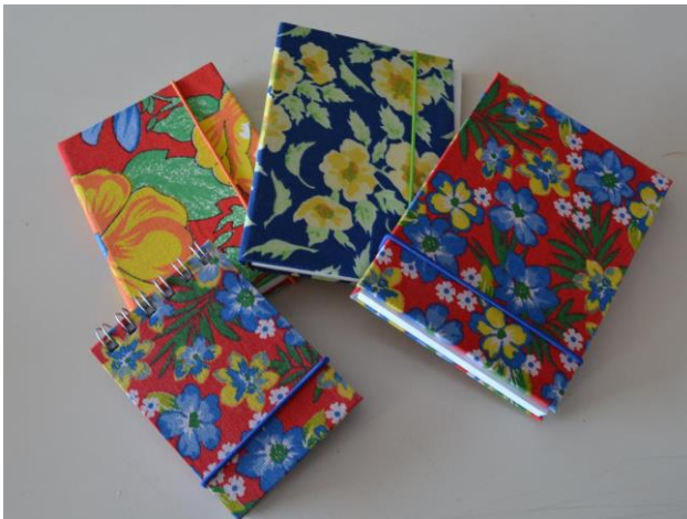
Figura 1 e 2. Exemplos da Linha Chiquita.

Glam, traduzido ao português significa "glamour", que transmite a ideia de brilho, requinte e sofisticação, e foram esses traços que foram trazidos à linha Glam, com a intenção de chamar atenção do público jovem feminino.