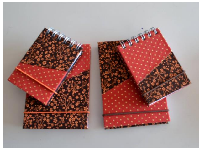
Figura 8 e 9. Exemplos da linha Composê.