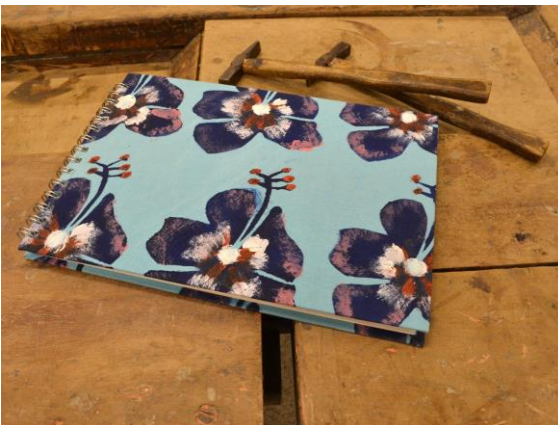
Figura 5, 6 e 7. Exemplos da linha Raízes.

A linha Composê surgiu para que houvesse a mistura de estampas na capa dos cadernos, método já muito utilizado nos trabalhos de patchwork, criando um resultado muito harmônico e charmoso.