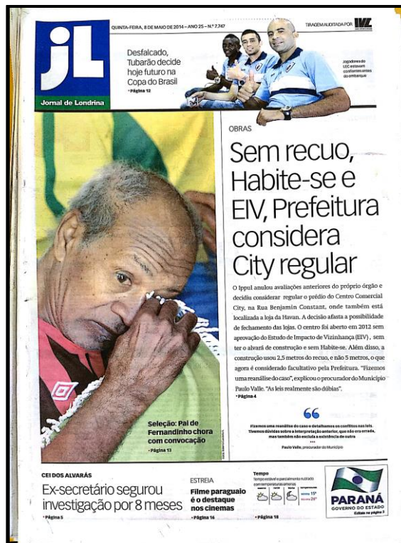
Figura. 6 – Capa do JL do dia 8 de maio de 2014

“O Instituto de Pesquisa e Planejamento Urbano de Londrina (Ippul) anulou avaliações anteriores do próprio órgão e decidiu, agora, considerar o prédio do Centro Comercial City, na rua Benjamin Constant (centro), como regular e em sintonia com as leis municipais, afastando qualquer possibilidade de lojas como a Havan, âncora do espaço, serem fechadas. Antes, o centro comercial corria o risco por ser qualificado como fora das normas construtivas do Plano Diretor e do Código de Obras. Além disso, o prédio foi aberto em 2012 sem Estudo de Impacto de Vizinhança (EIV) aprovado, sem ter o alvará de construção inicial e, portanto, sem documento de Habite-se. Posteriormente, verificou-se não ser possível a instalação de um Polo Gerador de Tráfego (PGT) em Zona Comercial 1 (ZC1)”.