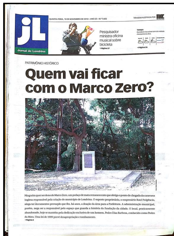
Figura 10 – Capa do JL do dia 13 de novembro de 2013