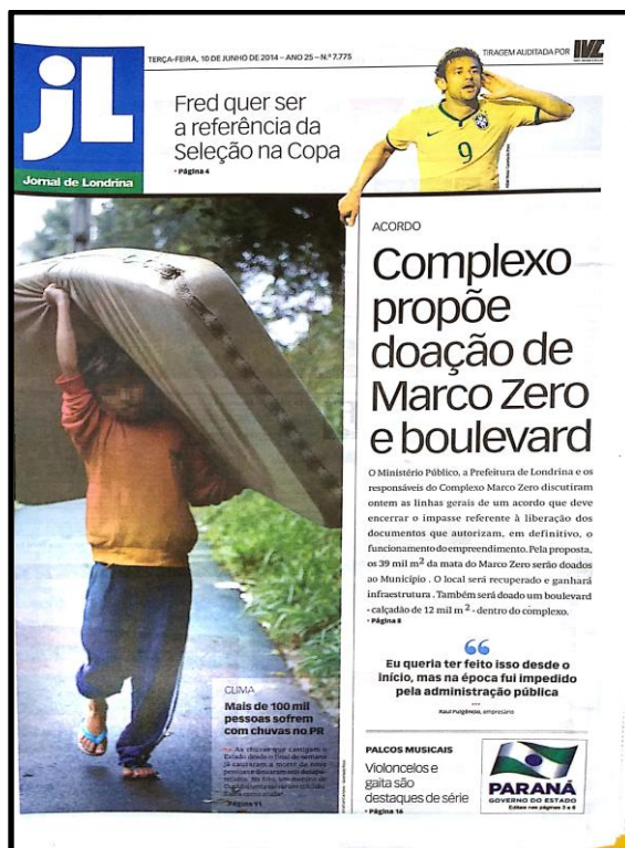
Figura 17 – Capa do JL do dia 10 de junho de 2014