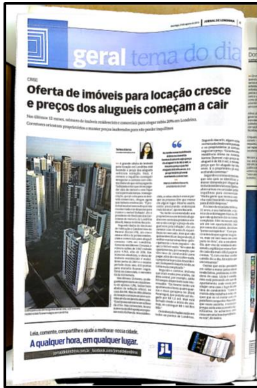
Anexo A21 – Matéria do JL, do dia 23 de agosto de 2015