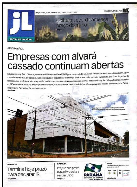
Figura 3 – Capa do JL do dia 30 de abril de 2013

Numa segunda retransa, o Sindicato das Empresas de Assessoramento e de Serviços Contábeis de Londrina (Sescap) reclama da lentidão do poder público para analisar os processos das empresas. E numa terceira retransa, o “caso Havan” é descrito e as irregularidades são enumeradas: