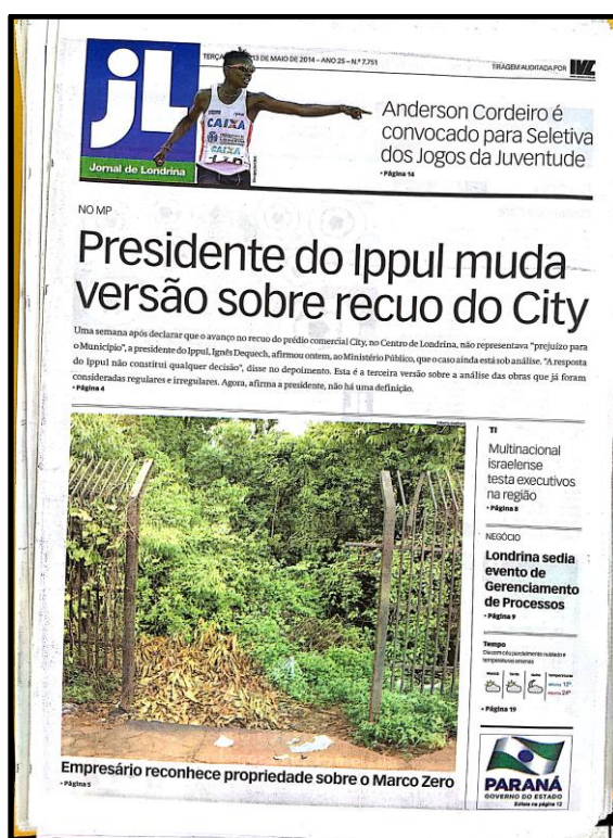
Figura 8 – Capa do JL do dia 13 de maio de 2014