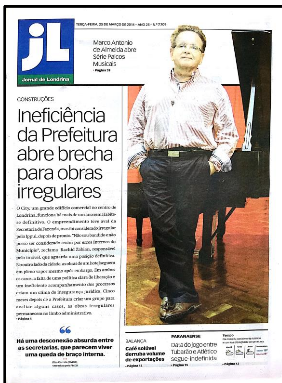
Figura 4 – Capa do JL do dia 25 de março de 2014

Nessa matéria há uma mudança importante: nas primeiras reportagens o JL tratava o caso como o das irregularidades “da loja da Havan”. Nessa reportagem o jornal usa “Centro Comercial City”, já que a responsável pelas irregularidades não era a loja, mas a empresa que construiu o imóvel. Até aqui, o uso da Havan em vez do nome do empreendimento, se deve a um olhar sobre o que estava à vista, que era a loja. Depois o JL descobriu que a empresa apenas alugava o imóvel. O jornal corrigiu o erro, reduzindo o uso do nome mais popular e por isso, mais próximo do leitor – se o JL falasse apenas do “City”, poucos leitores identificariam o prédio. No segundo parágrafo da reportagem principal, publicada na página 4, o nome da loja aparece, mas o jornal contextualiza com a informação de que ela é locatária. Mesmo assim o valor-notícia proximidade está presente, por causa das fotos da fachada do prédio, que colocam em destaque o nome Havan, mais conhecido do leitor.