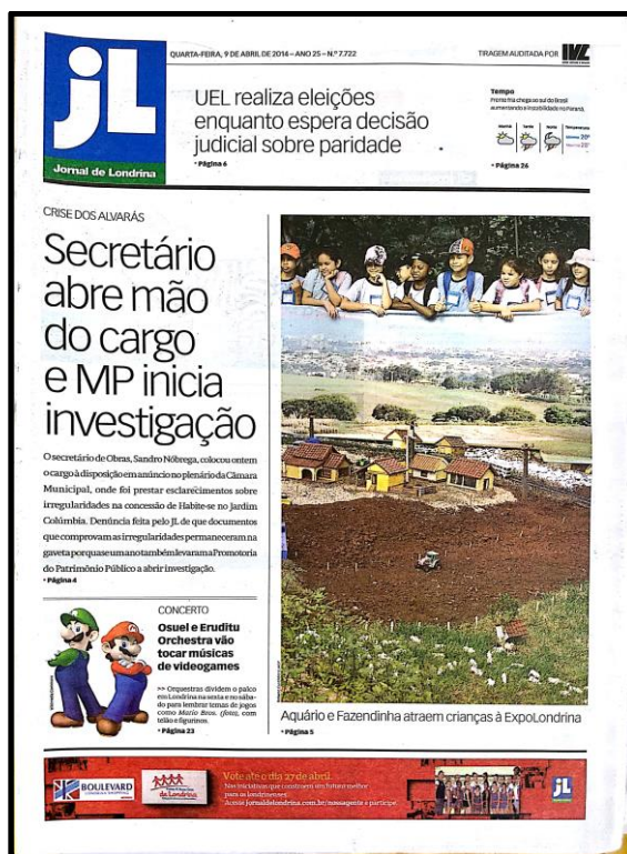
Figura 14 – Capa do JL do dia 9 de abril de 2014

Os valores-notícia mais fortes aqui são a quebra da normalidade, em decorrência do desvio que era atribuído ao secretário e, também, o da relevância, tendo em vista se tratar de uma queda de alguém posicionado no primeiro escalão da prefeitura. A segunda parte da manchete, fala sobre a investigação do MP, o que reforça a ideia de quebra de normalidade – que torna, diga-se, necessária a intervenção da promotoria.