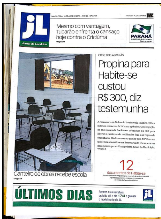
Figura 15 – Capa do JL do dia 10 de abril de 2014

Pode-se dizer que o valor-notícia quebra da normalidade aparece de forma aguda nessa reportagem. A informação de que “em menos de 24 horas” o MP conseguiu indícios depois de a denúncia ter ficado um ano na gaveta reforça o viés de desvio. Passa a ideia de que a omissão tinha como objetivo poupar alguém.