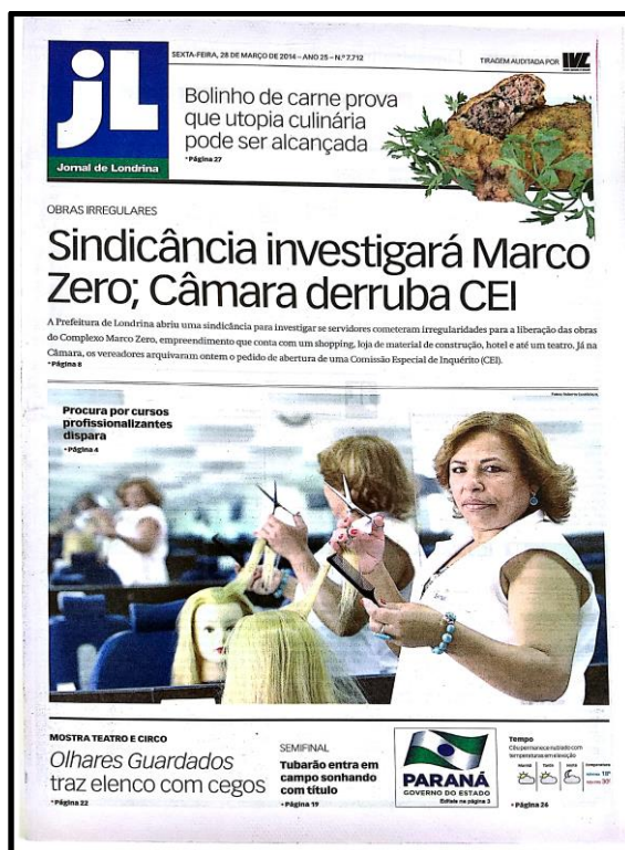
Figura 12 – Capa do JL do dia 28 de março de 2014

O valor-notícia conflito é o mais evidente nesta reportagem. A mobilização dos empresários tem como objetivo amenizar o conflito entre o empreendimento Marco Zero e a prefeitura com uma proposta de analisar caso a caso. O critério relevância também pode ser citado, tendo em vista que a ampliação do escopo do debate que sai do Marco Zero e vai para uma quantidade maior de empreendimentos, aumenta o número de pessoas e estabelecimentos afetados.