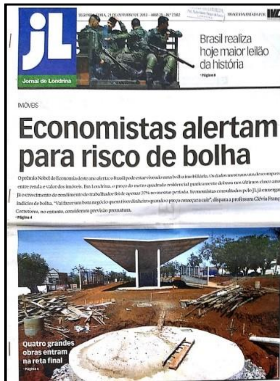
Figura 1 - Capa do JL do dia 21 de outubro de 2013

Em 28 de março de 2014, (anexo A14), o JL volta a tratar do mercado imobiliário em uma grande reportagem. A matéria foi publicada na página 9 e sem chamada de capa. “Valorização – Shopping muda lentamente perfil econômico da Zona Leste”, diz o título do texto de Telma Elorza. É um balanço, um ano depois da inauguração do Shopping Boulevard, no Complexo Marco Zero, e de seus efeitos na região. Ela é publicada em meio a uma conjuntura em que já existem questionamentos à contrapartida (ou ausência dela) devida pelo empreendimento com base na legislação em vigor.