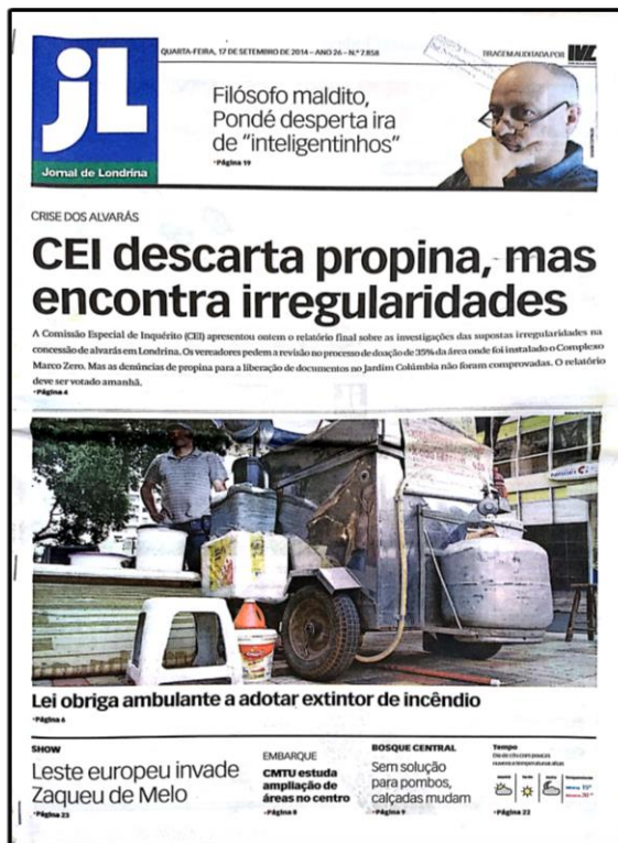
Fig. 18 – Capa do JL do dia 17 de setembro de 2014

Com relação ao Jardim Colúmbia, embora considere que tenha identificado as irregularidades, a comissão não conseguiu confirmar o pagamento de propina alegado na