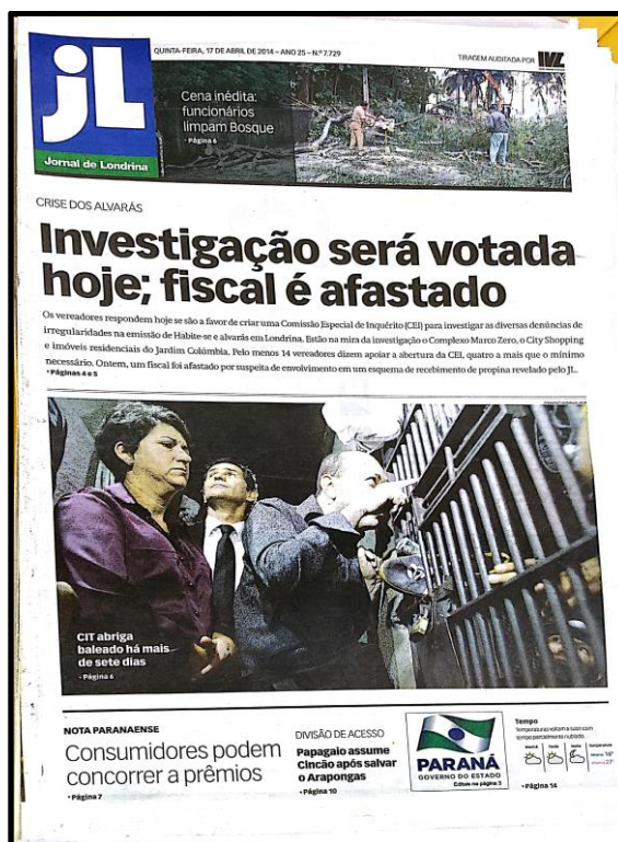
Figura 16 – Capa do JL do dia 17 de abril de 2104