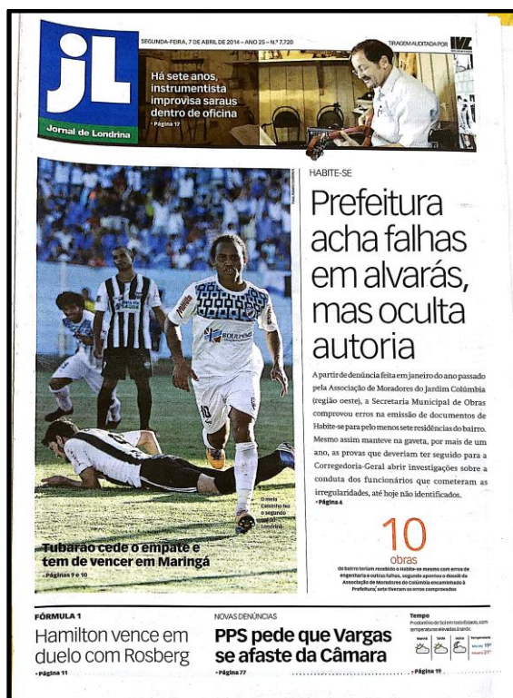
Figura 13 – Capa do JL do dia 7 de abril de 2014