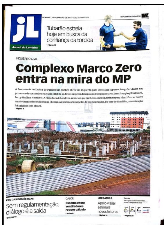
Figura 11 – Capa do JL do dia 19 de janeiro de 2014