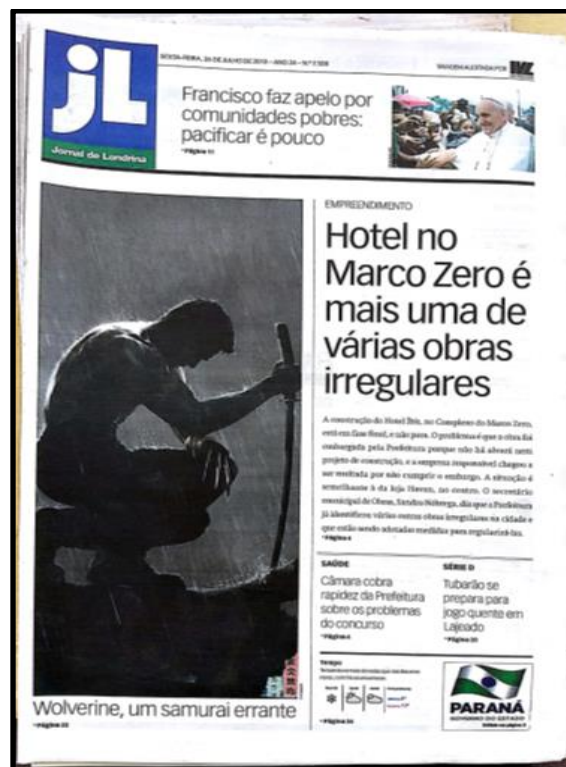
Figura 9 – Capa do JL do dia 26 de julho de 2013