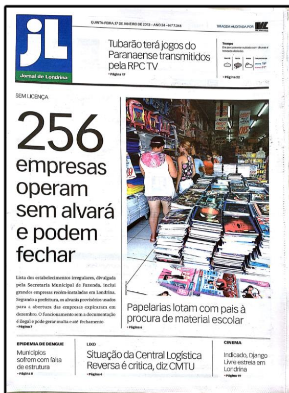
Figura 2 – Capa do JL do dia 17 de janeiro de 2013