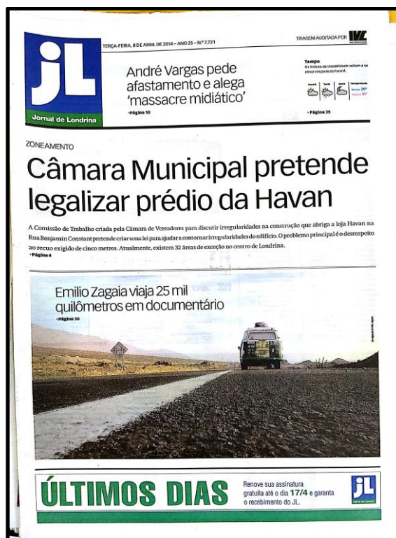
Figura 5 – Capa do JL do dia 8 de abril de 2014