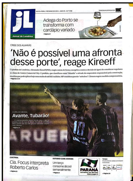
Figura 7 – Capa do JL do dia 9 de maio de 2014

Na mesma edição, na página 8, mais Centro Comercial City. Reportagem de Fábio Silveira diz que a Câmara “sugere que Kireeff adote medida compensatória” a ser executada pelo empreendedor. A matéria trata do relatório da Comissão de Trabalho da Câmara que analisou o caso do Centro Comercial City. A proposta da Comissão é que a prefeitura conceda outorga onerosa ao empreendimento “como forma de compensar a não observância do recuo de 5 metros – a obra foi feita com recuo de 2,5 metros – e a construção de um Polo Gerador de Tráfego (PGT) em área de Zona Comercial 1 (ZC1), o que não é permitido pelo Plano Diretor de 2008”. A outorga onerosa é prevista no Estatuto das Cidades e “prevê que os empreendedores deem uma contrapartida em troca de construir acima do coeficiente de aproveitamento”, diz a reportagem, que não cita qual seria a contrapartida a ser cobrada do Centro Comercial City. De acordo com o relatório, a contrapartida não isentaria o