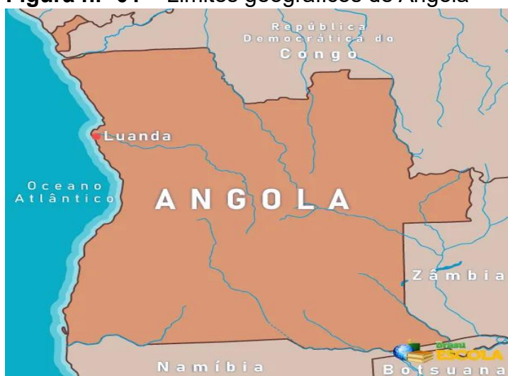
Figura n.º 01 – Limites geográficos de Angola