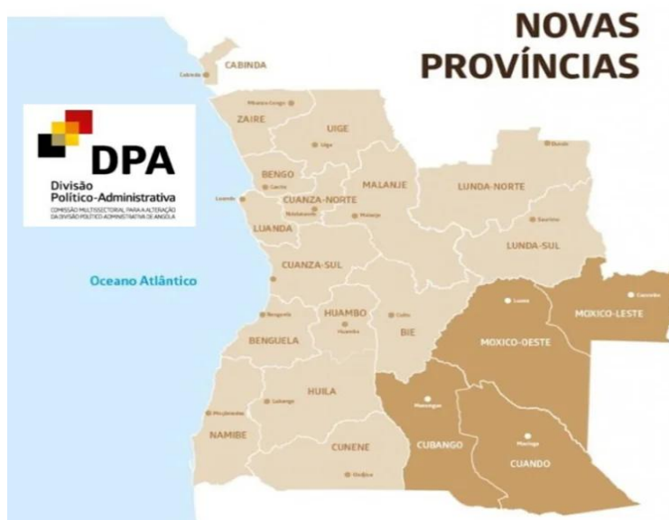
Figura n.º 03 – Novo mapa de Angola (a partir de 01/01/2025)