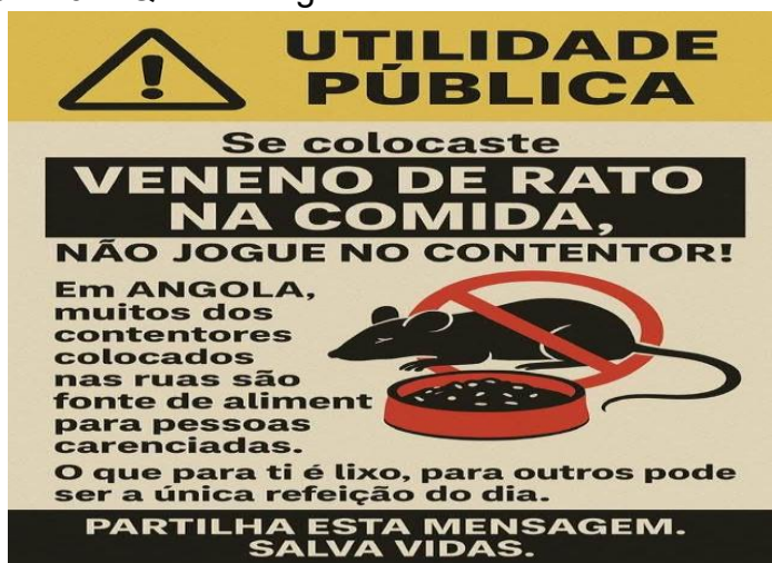
Figura nº 04: Quadro degradante da vida social em Angola