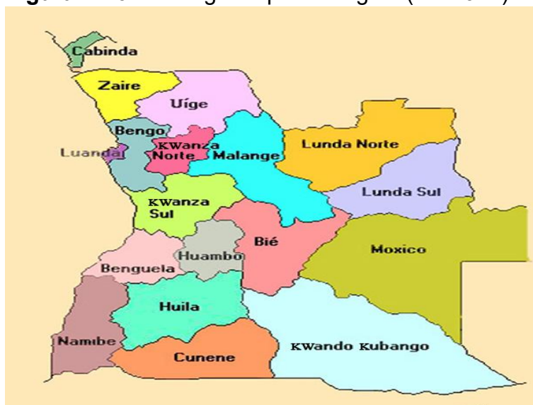
Figura n.º 02 – Antigo mapa de Angola (até 2024)