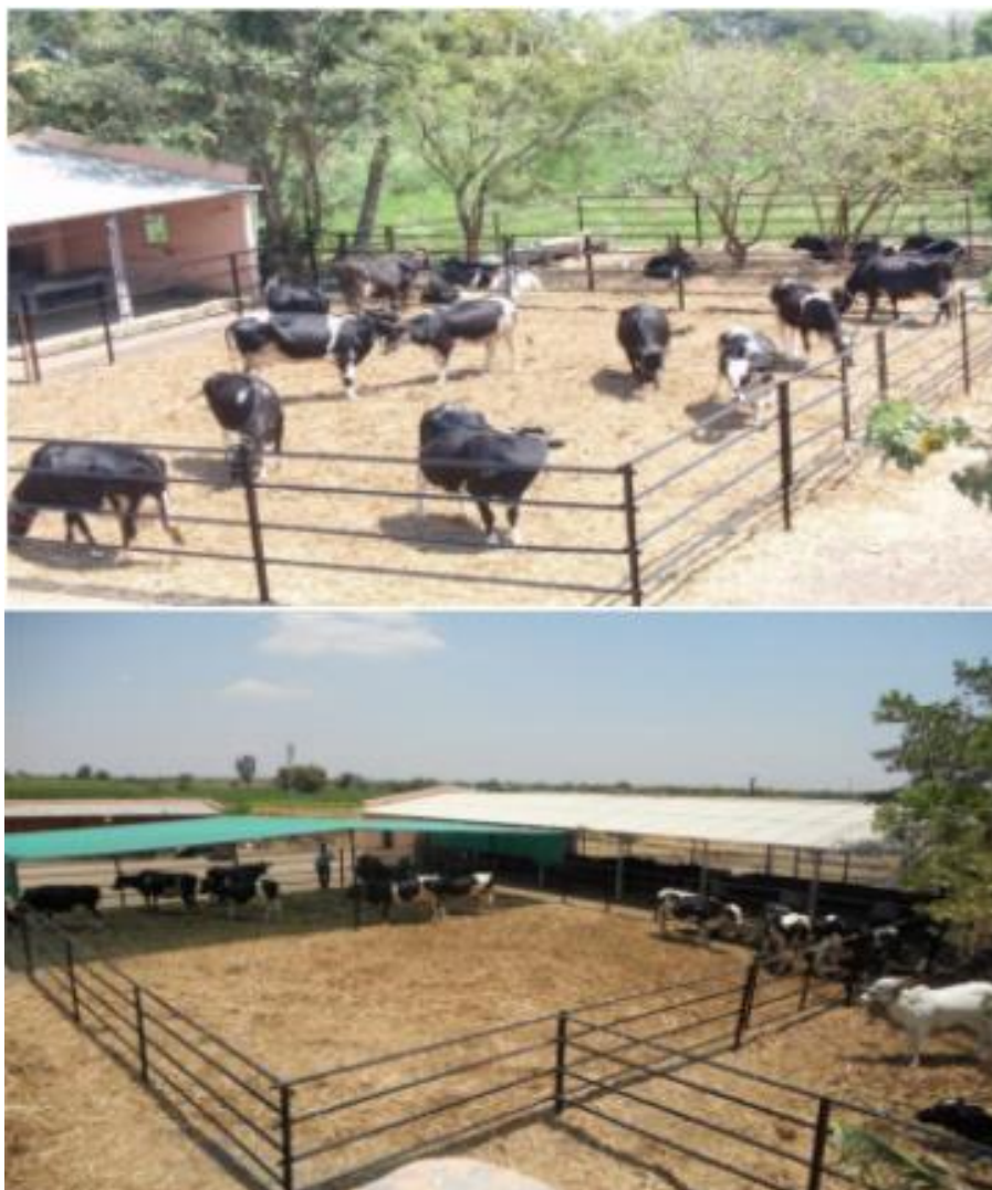
FIGURA 3 - Sistema Loose Housing

No modelo loose housing , os animais são confinados em um galpão de terra ou concreto coberto com uma camada de cama, que pode ser palha de trigo, palha de arroz, areia, esterco seco, maravalha e outros materiais, com local de descanso comum. A alimentação e a ordenha ocorrem em salas ou galpões separados (HOLANDA; MELO, 2020).