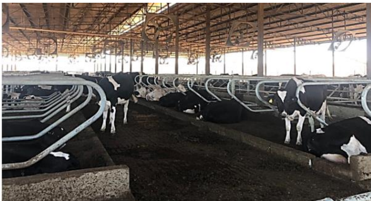
FIGURA 1 - Sistema free stall

descansar. As fazendas leiteiras ganharam boa representação em sistemas de currais devido ao seu gerenciamento superior de resíduos e à menor incidência de danos nos cascos e tetas dos animais em comparação com as fazendas que adotaram o sistema loose housing (RAMOS, 2015).