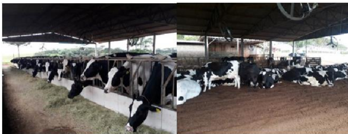
FIGURA 4 - Sistema Compost Barn

A busca por um sistema de produção animal que proporcione o melhor desempenho animal aliado ao conforto, saúde, proteção e bem-estar levou ao desenvolvimento do sistema compost barn (Figura 4). Esse sistema surgiu como uma adaptação ao sistema loose housing, que se baseava em uma área comum de descanso para animais e tendo livre circulação, anexada a uma pista de alimentação. Em um plano aberto, a serragem é geralmente usada como material de cama que absorve parcialmente a urina e os resíduos, e se não é revirada resulta no acúmulo de resíduos, que é uma fonte de crescimento microbiano e uma fonte potencial de contaminação para doenças infecciosas como a mastite (Black et al., 2014). Além disso, pode fazer com que esses resíduos grudem no corpo dos animais, dificultando as exigências de higiene durante a ordenha.