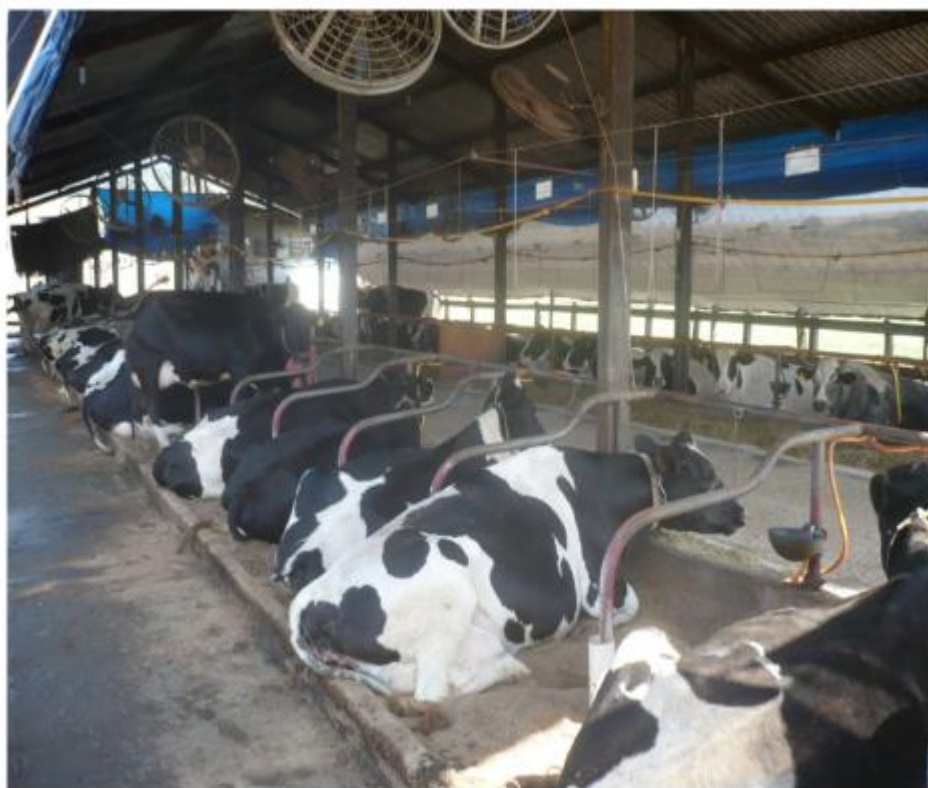
FIGURA 2 - Sistema tie stall

No sistema de confinamento tie stall (Figura 2), as vacas ficam lado a lado na maior parte do tempo, em baias individuais, são acorrentadas e recebem 100% de ração do cocho; e geralmente só estão livres durante a ordenha, quando estão fazendo algum exercício. É um sistema de alto investimento por animal mantido e baixa eficiência de serviço como limpeza, alimentação e ordenha. O sistema de alimentação mais utilizado é a ração concentrada separada da forragem. Geralmente são utilizados em rebanhos menores, em que o trabalho é familiar (MOTA, 2017).