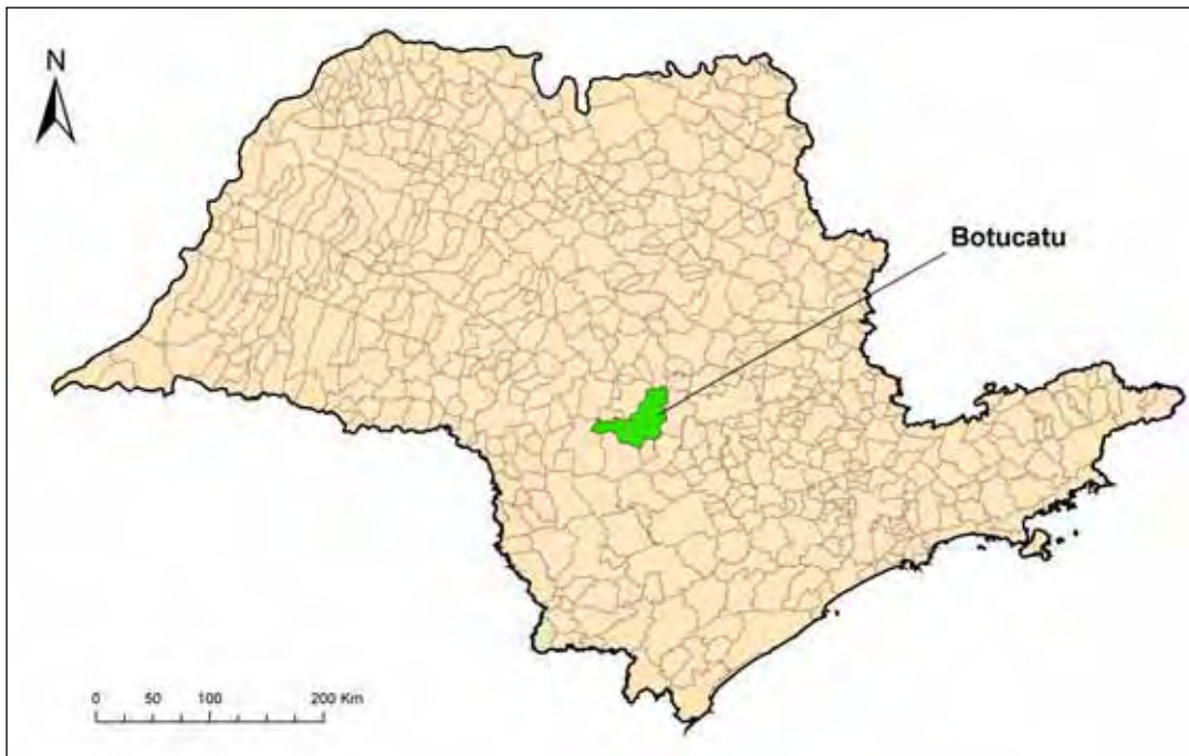
Figura 1. Mapa do Estado de São Paulo com destaque ao Município de Botucatu

Características do município: O Município de Botucatu localiza-se na região Centro-Sul do Estado de São Paulo, a 240 km da Capital (22,88583° latitude sul; 48,445° longitude oeste), situando-se à cerca de 805 metros acima do nível do mar (Figura 1). Sua área total abrange 1.483 km 2 , dos quais, 1.329 km 2 correspondem à zona rural e 154 km 2 à zona urbana, com uma população de 4.313 e 103.993 habitantes, respectivamente, totalizando 108.306 habitantes (IBGE, 2000). O seu clima é subtropical úmido com invernos secos e verões quentes, com temperatura média de 19 °C, e precipitação pluviométrica de 1.250 mm. A vegetação consiste de mata pluvial e cerrado (IPT, 1997).