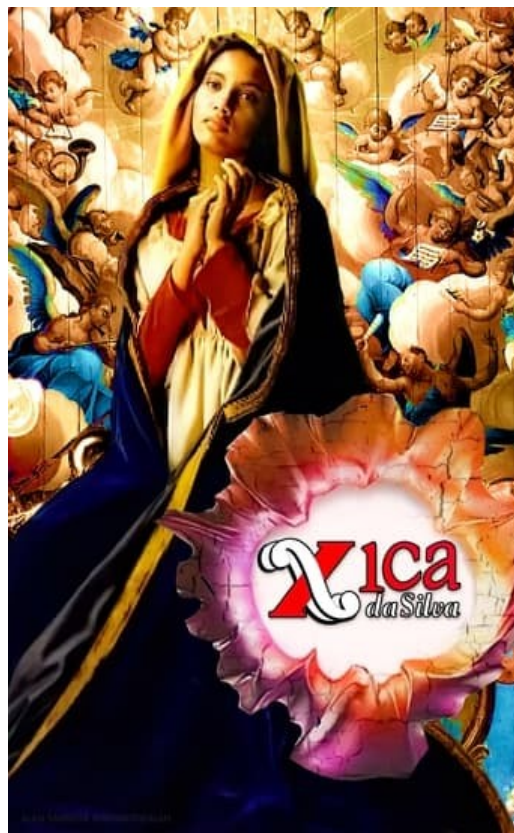
Figuras 3 e 4