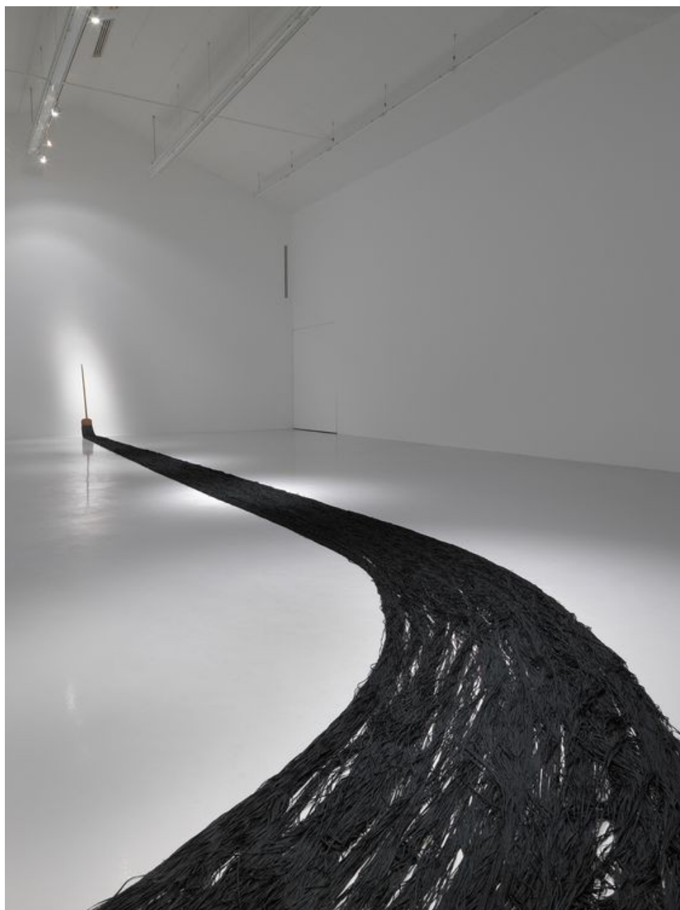
La Bruja , 1979 Cildo Meireles