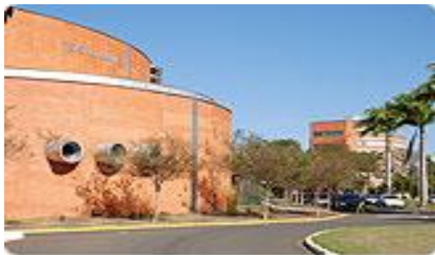
Figura 2 - Vista da entrada do Campus Taquaral

Além dos cursos de graduação e pós graduação, a UNIMEP realiza atividades pela via da educação continuada, da Universidade da Terceira Idade e de cursos "In company" (UNIMEP-Capacit): "Educar para a cidadania e para a participação plena da pessoa na sociedade é um dos princípios de sustentação da Política Acadêmica da UNIMEP, documento norteador de suas ações" (UNIMEP, 2016).