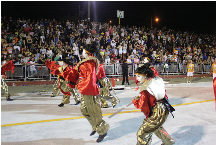
Depois que o carnaval voltou a ser organizado no sambódromo, o público e a qualidade dos desfiles aumentaram significativamente ano após ano.

Foi após o carnaval de 2014 que a coisa realmente tomou proporção. Os desfiles voltavam a adquirir qualidade e beleza impressionantes, e cada vez mais o público voltava à passarela municipal para prestigiar o trabalho de um ano inteiro. O panorama favorável que se desenhava acendeu novamente, no coração daqueles que ainda sonhavam em ver a Mocidade na avenida outra vez, uma chama que há muito se acreditava estar completamente extinta.