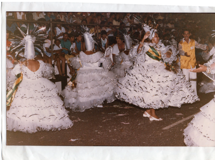
Ala das Baianas da Mocidade Independente da Vila Falcão, em desfile na avenida Nações Unidas.