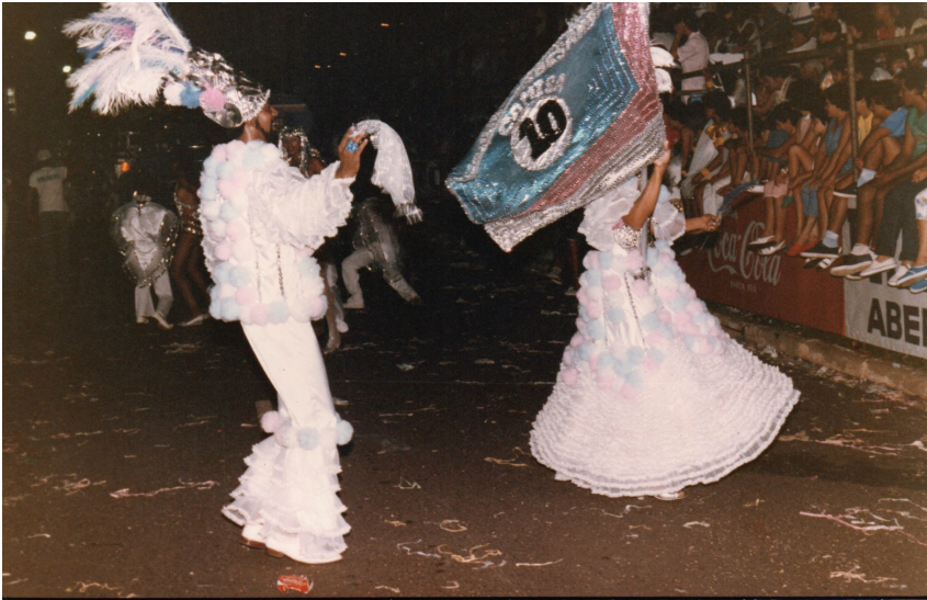
Casal de mestre-sala e porta-bandeira da Camisa 10, já desfilando como escola de samba, na Avenida Nações Unidas.

Em um primeiro momento pode parecer algo ruim ou triste de se acontecer, mas a verdade é que o fim da agremiação noroestina acabou desencadeando consequências benéficas aos festejos do município, por dois motivos. Em primeiro lugar porque, sem uma escola para desfilar, porém com a vantagem de já se conhecerem e trabalharem juntos, alguns dissidentes da escola de samba do Noroeste se juntaram para formar o Camisa 10, até então apenas um bloco, mas que conseguiu formar uma bateria de altíssimo nível.