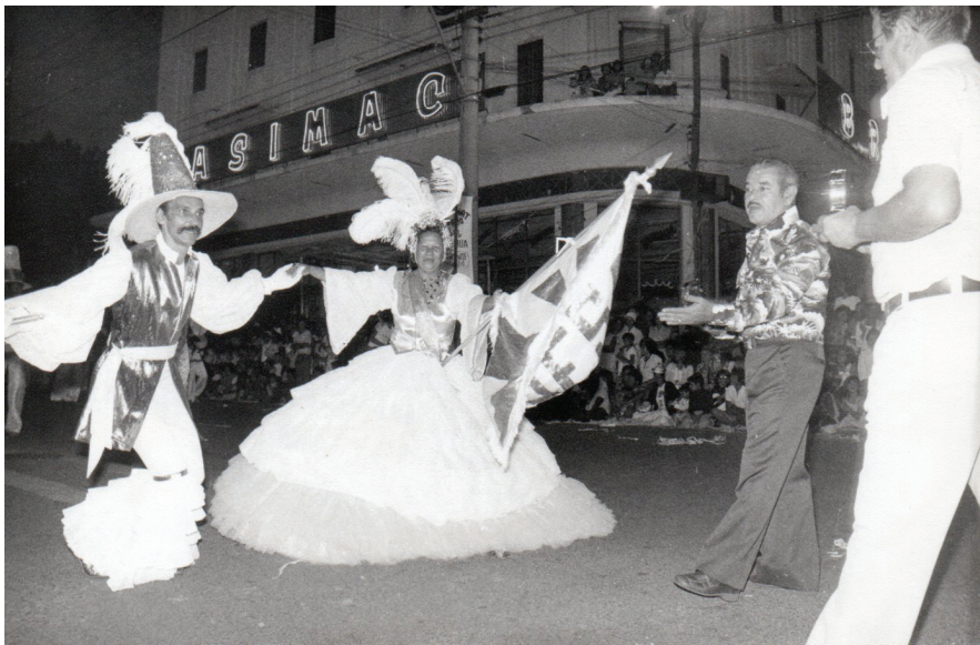
Imagem de premiação em desfile do início da década de 1970, ainda na avenida Rodrigues Alves.