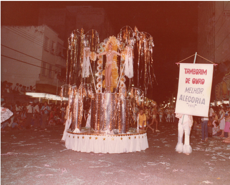
Um dos carros da Mocidade Independente da Vila Falcão no desfile de 1979, premiada com o Tamborim de Ouro de melhor alegoria do carnaval bauruense.

esposa acabavam trocando o quarto pela sala, para que as roupas ficassem em um local com entrada restrita, e onde os foliões pudessem ter privacidade na hora de provar as peças. “O Dito não dormia na cama dele. Ele dormia no sofá da sala, porque em cima da cama ficavam as fantasias prontas estendidas. E também porque era no quarto dele que o pessoal entrava para experimentar as roupas”, detalha.