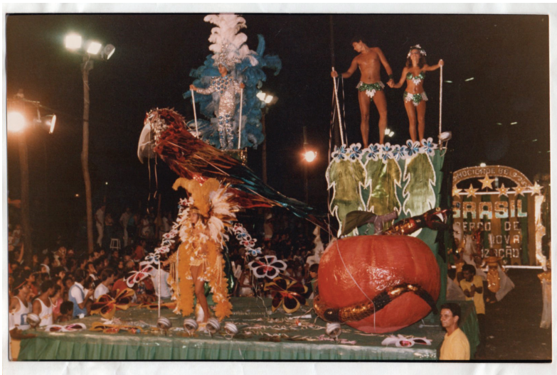
Desfile da Mocidade Independente da Vila Falcão no carnaval de 1986, quando foi vice-campeã sob a direção de uma Comissão Dirigente.