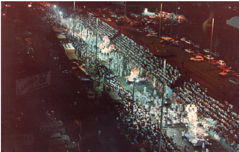
Foto noturna da Avenida Nações Unida, durante os desfiles de 1987.

Os desfiles na avenida Nações Unidas não deixaram dúvidas também sobre o quanto o carnaval havia evoluído no município. Em 1983, a Mocidade Independente chegaria mais uma vez ao primeiro lugar do concurso. Contudo, após a conquista do sétimo título, a escola da vila Falcão viveu um jejum de cinco anos, até voltar a vencer em 1988, justamente quando Paulo Keller, considerado um dos melhores carnavalescos da história de Bauru e também da Mocidade, retornava à agremiação após período em que ficou afastado, defendendo outros pavilhões na avenida. Camisa 10, Cartola, Imperatriz da Bela Vista e Império da Nova Esperança foram as escolas que passaram a disputar diretamente e de maneira acirrada o troféu, aumentando assim a competitividade nos desfiles e forçando as escolas a buscarem alternativas cada vez mais inovadoras para se destacar.