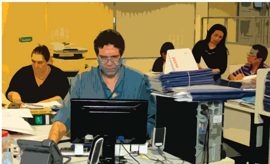
Arte sobre foto de Daniel Patire