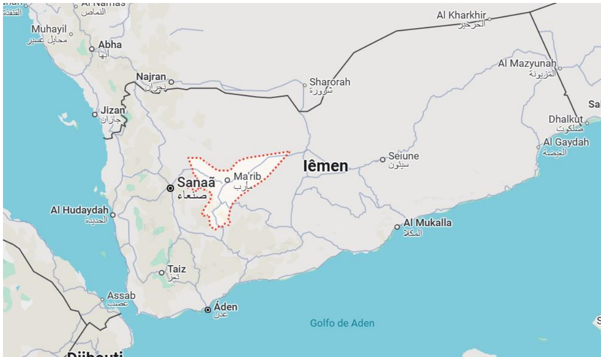
Figura 4 - Localização da província de Marib no Iêmen

localização de Marib, que por ser a província vizinha da capital, tinha uma grande importância estratégica para a coalizão ao mantê-los perto da capital e não confinados apenas no Sul do país.