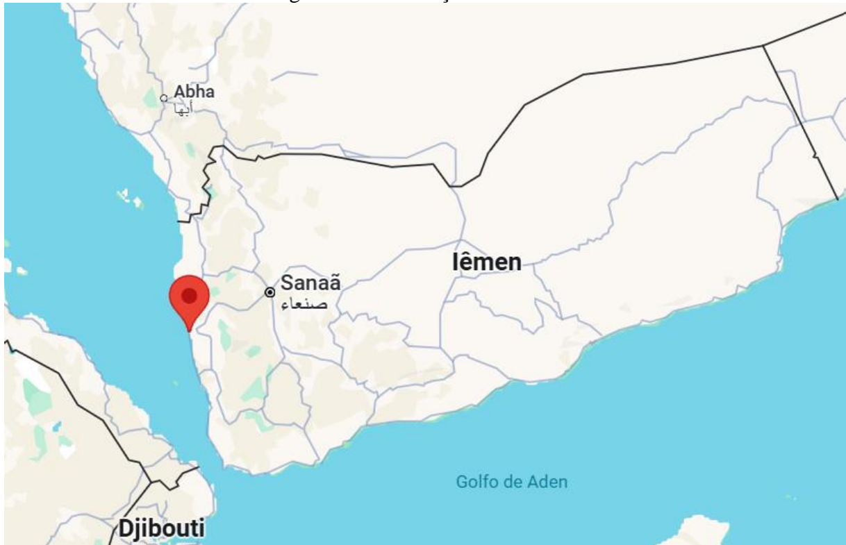
Figura 3 - Localização de Hodeida

estado de fome” (ONU, 2019, p. 2, tradução nossa 22 ). Na figura 3 é possível observar a localização da cidade no território Iêmenita.