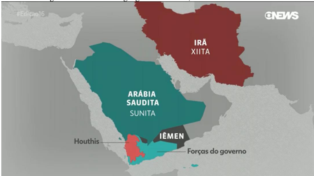
Figura 5 – Proximidade geográfica entre Irã, Arábia Saudita e Iêmen.

influência política sobre as monarquias do Golfo, o Irã procura mobilizar as comunidades Árabes xiitas locais para pressionar os governos da região em questões que lhe interessam. O Iêmen, vizinho da Arábia Saudita, é um país onde a última busca ativamente exercer influência (Grumet, 2015, p. 102). Na figura 5 é possível observar o posicionamento geográfico do Iêmen referente ao posicionamento iraniano e saudita.