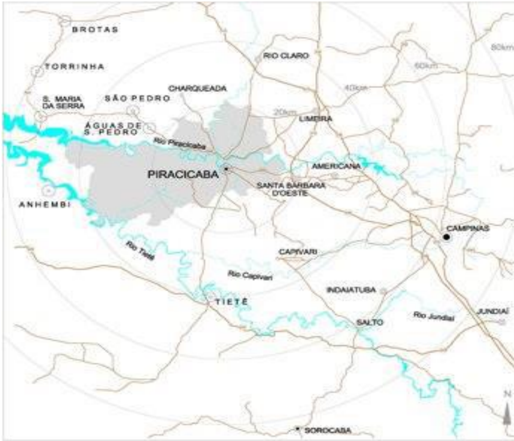
Imagem 3 – Piracicaba e cidades do entorno (IPPLAP, 2014).