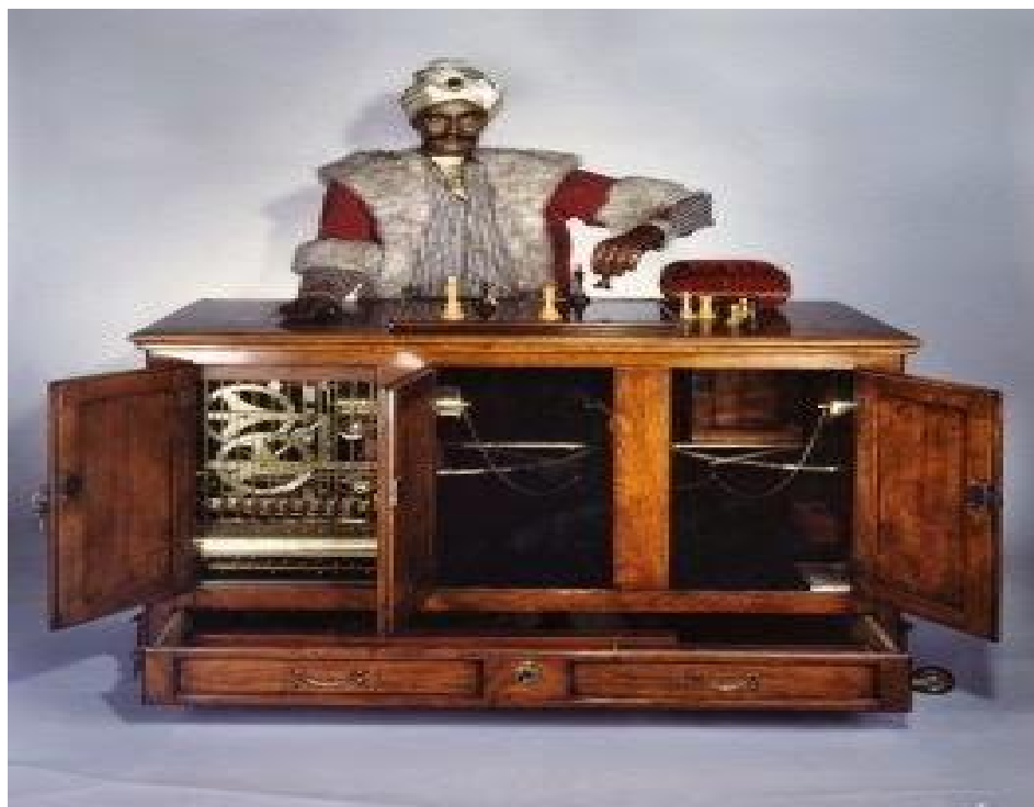
Figura 1: O Turco

Fonte: Réplica do modelo Mecânico Turco, Obra de museu 10