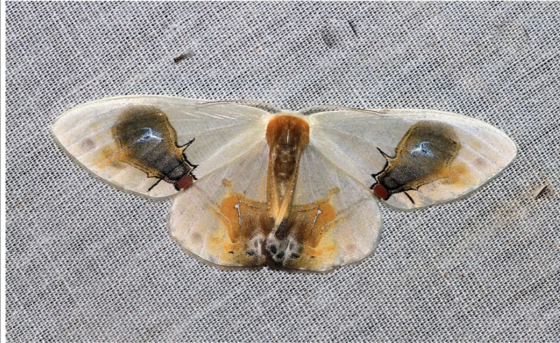
Fig. 3. Macrocilix maia