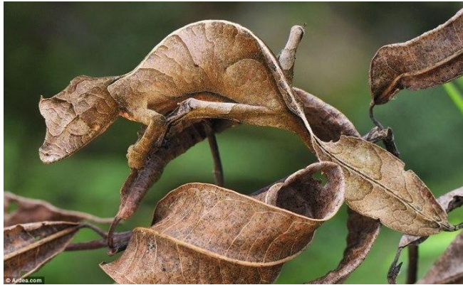
Fig. 01 - Lagartixa-satânica-cauda-de-folha ( Uroplatus phantasticus )