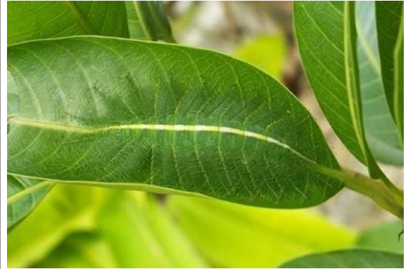
Fig. 02 - Baron caterpillar ( Euthalia aconthea )