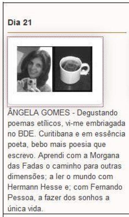
Figura 8: Print Screen do perfil de Ângela Gomes