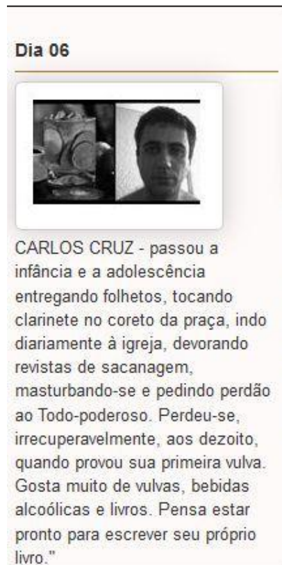
Figura 1: Print Screen do perfil de Carlos Cruz