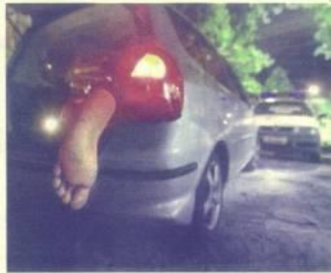
MUERTE. EL CADÁVER DE UN NARCÓ EN EL BRIL DE UN COCHE EN LA ZONA RÍO DE JANEIRO.