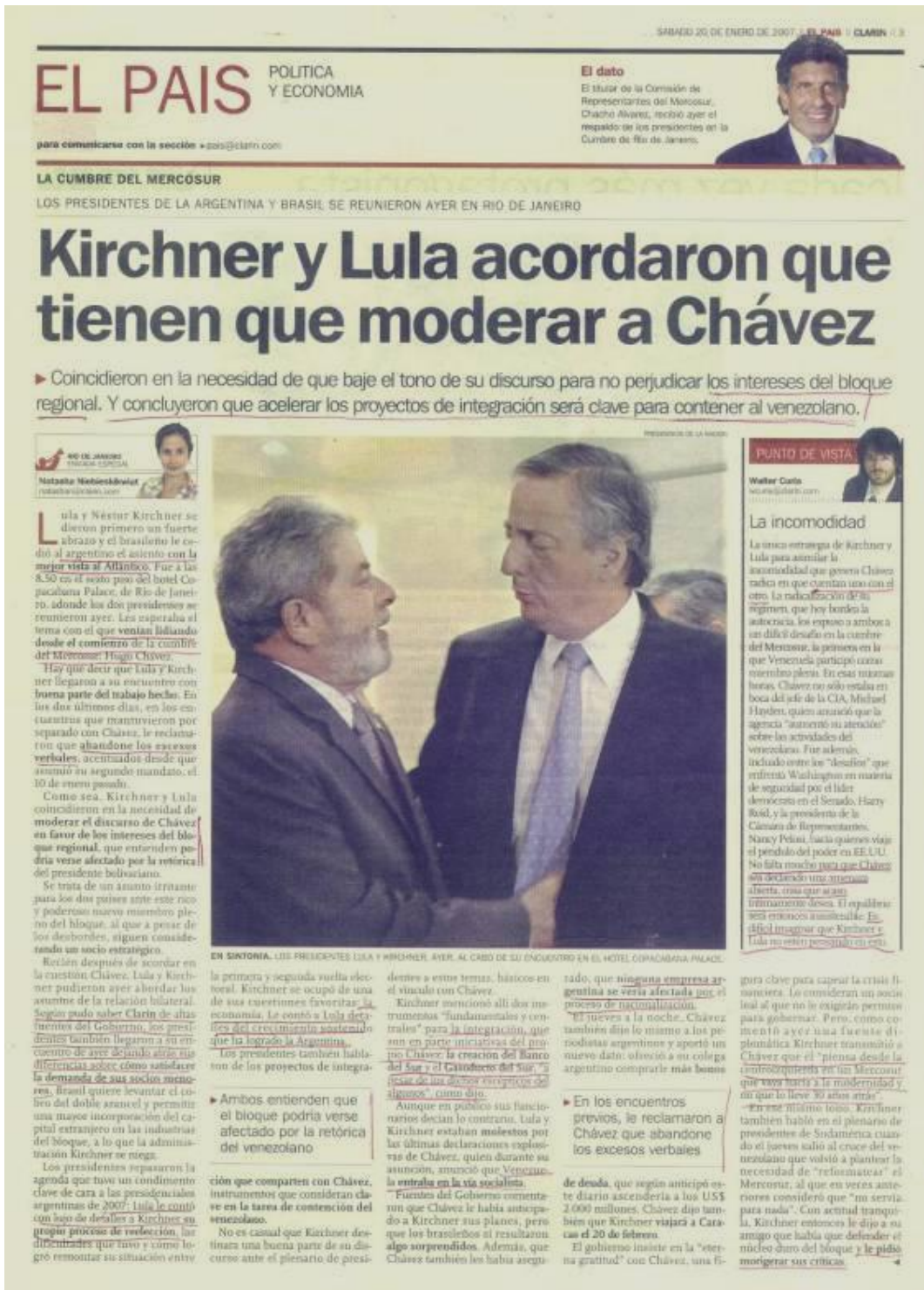
Figura 9 – Clarín 20 de janeiro de 2007