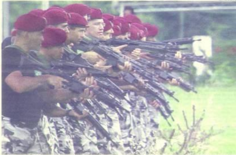
APUNTES... TROPAS DEL EJERCITO, AYER, REALIZAN SU ÚLTIMO ENTRENAMIENTO DE COMBATE EN BRASILIA ANTES DE PARTIR EN AVIÓN HACIA RÍO DE JANEIRO.

La llegada de este contingente especial a la capital carioca fue