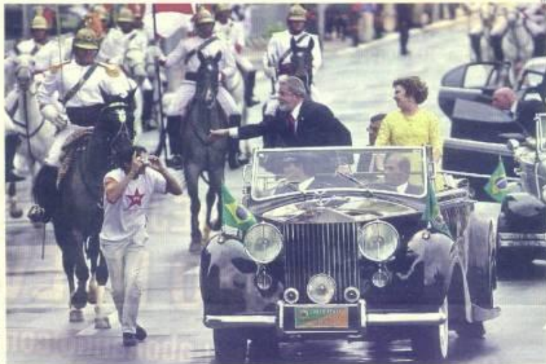
COLADO, UN SIMPATIZANTE DEL PT BURLA LA SEGURIDAD Y FOTOGRAFIA CON UNA CAMARA DIGITAL A LULA Y SU MUJER, ANTE LA EMPRESA DEL PRESIDENTE.

"Al hablar sobre el incendio de un colectivo en el que murieron 9 personas, Lula dijo que "esa