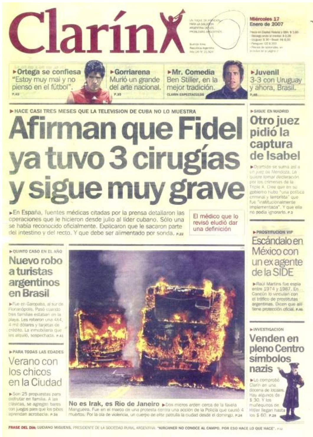
Figura 6 – Clarín - 17 de janeiro de 2007