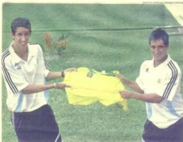
UNICO OBJETIVO. DI MARIA Y MORALEZ JESBAN CON LA CAMISETA DE BRASIL Y LA IDEA DE ROMPERLA JUGANDO COMO SABEN.

«... quieren romper toda... Dejarla hecha pedacitos. Hoy es el día, o la noche ideal para hacerlo ante Brasil y por el estreno de la fase final, la que pone en juego pasajes mundiales y olimpicos. Sufrán con hacer el partido de "sus vidas" Maximiliano Moralez y Angel Di María. "Desde hace mucho que quiero enfrentarme...", dice desafiante el "pequeño" de Racing. Y el Flaco de Central "calienta el clásico": "Miedo? No, tendría miedo si el Exaxo jugase para ellos. Pero como es nuestro, ellos son los que deben estar temblando". Mi a uno ni al otro se le mueve un músculo cuando ves salir de un bolón la "verde amarilla". "Para qué, ¿eh?", preguntan a día. Cuando Clarín les transmite cuál es la idea de la foto, se miran y aceptan, con dadas. Pero usando se enteran que la misma producción la hicieron Messi,latan, Zabaleta, Biglia, Torres y Garay en el Sudamericano pasado de Colombia, un día antes de vencer a Brasil por 2 a 1, agraban la cancha sin prejuicios.