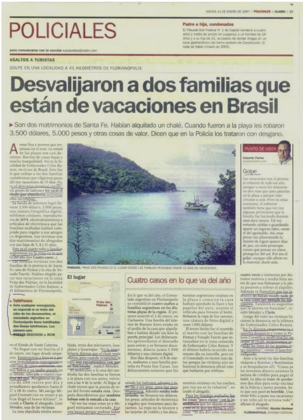
Figura 7 – Clarín 11 de janeiro de 2007