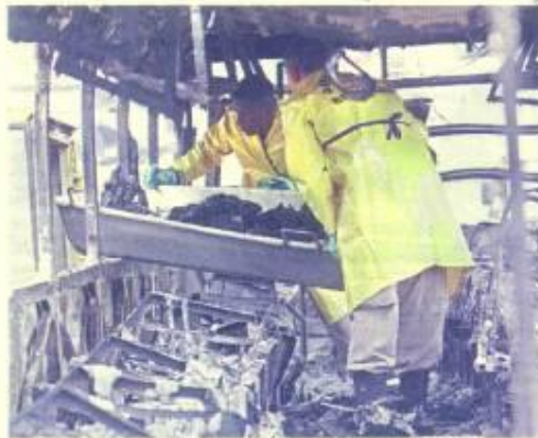
INCENDIO. SOCORRISTAS RECIBEN RESTOS DE UN ÓMNIIBUS QUEMADO EN LA FAVELA CIDADE ALTA.

► Un grupo armado tomó un ómnibus y lo incendió con la gente dentro. Quemaron más de una docena de vehículos y hubo tiroteos en barrios ricos. Hay varias hipótesis sobre los motivos de la ofensiva.