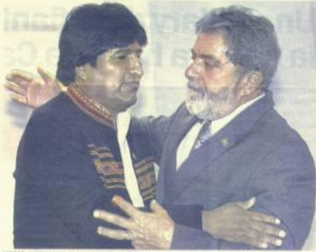
AMIGOS. EL ABRAZO DEL EX COCALEIRO Y EL EX LÍDER SINDICAL, EL VIERNES DURANTE LA CUMBRE DEL MERCOSUR.