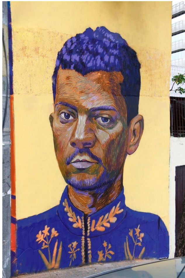
Figura 1 - Retrato de Lima Barreto em forma de grafite