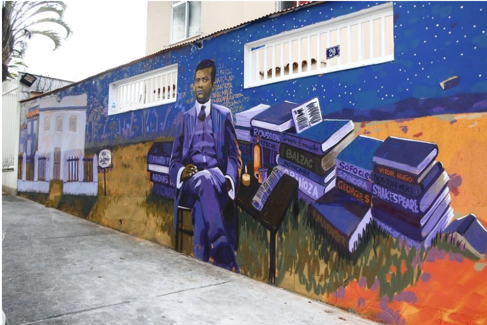
Figura 2 - Grafite de Lima Barreto em meio aos seus livros