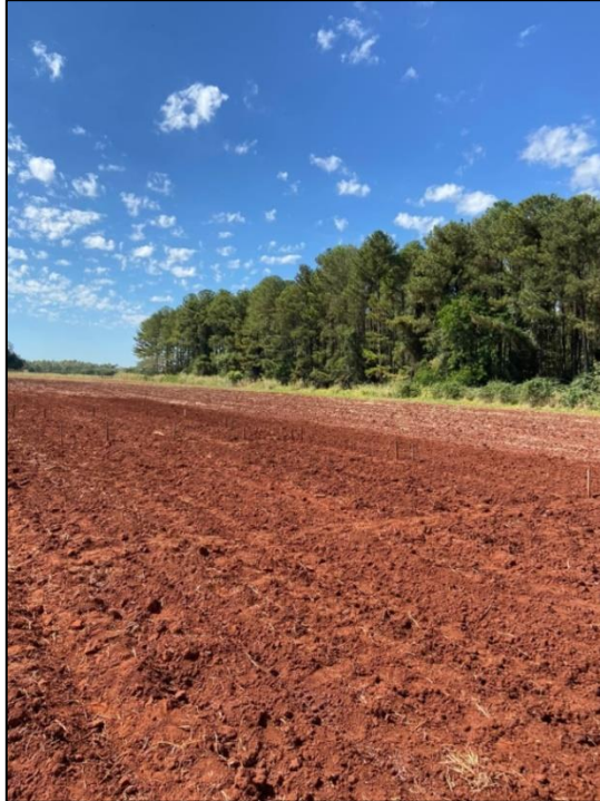
Figura 1 – Área experimental da FEPE onde foi realizado o experimento com genótipos de feijão preto. Preparo convencional do solo, Selvíria (MS), 2021.

pulverização mecanizada. A área foi irrigada por um sistema de irrigação do tipo pivô central e de acordo com a necessidade da cultura.