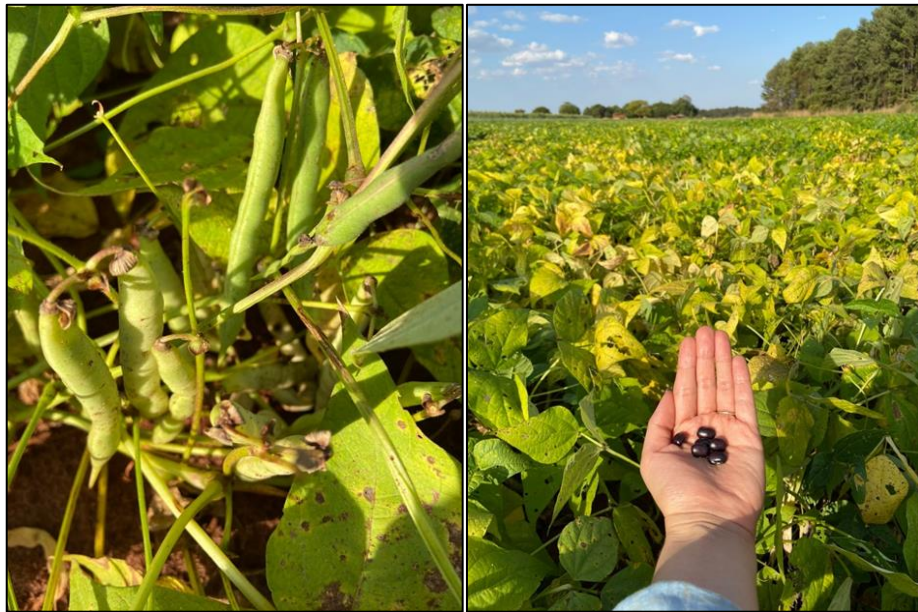
Figura 5 – Feijoeiro em estágio R 8 enchimento das vagens e alguns grãos pretos já bem desenvolvidos, Selvíria (MS), 2021.