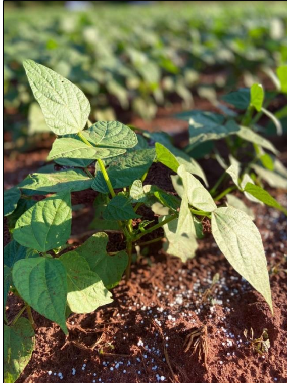
Figura 3 – Adubação com ureia aos 19 DAE, Selvíria (MS), 2021.