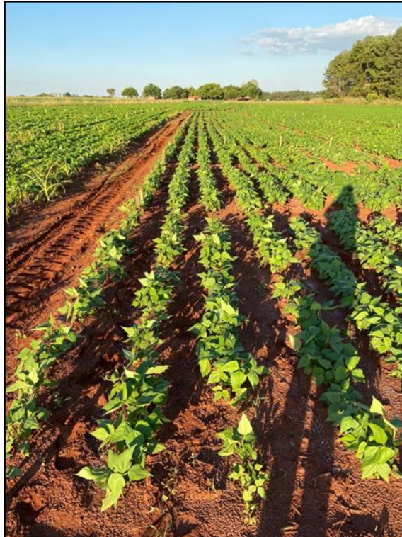
Figura 4 – Acompanhamento da cultura aos 19 DAE, Selvíria (MS), 2021.