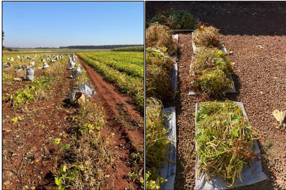
Figura 6 – Colheita manual dos genótipos de feijão preto e secagem das plantas a pleno sol, Selvíria (MS), 2021.