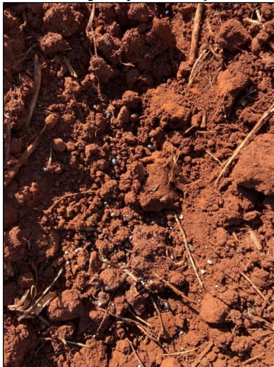
Figura 2 – Semeadura manual dos genótipos e adubação de NPK, Selvíria (MS), 2021.