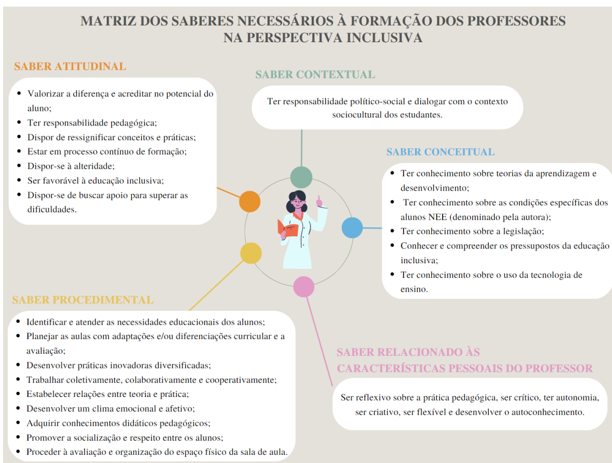
Figura 3: Matriz dos saberes necessários à formação de professores na perspectiva inclusiva