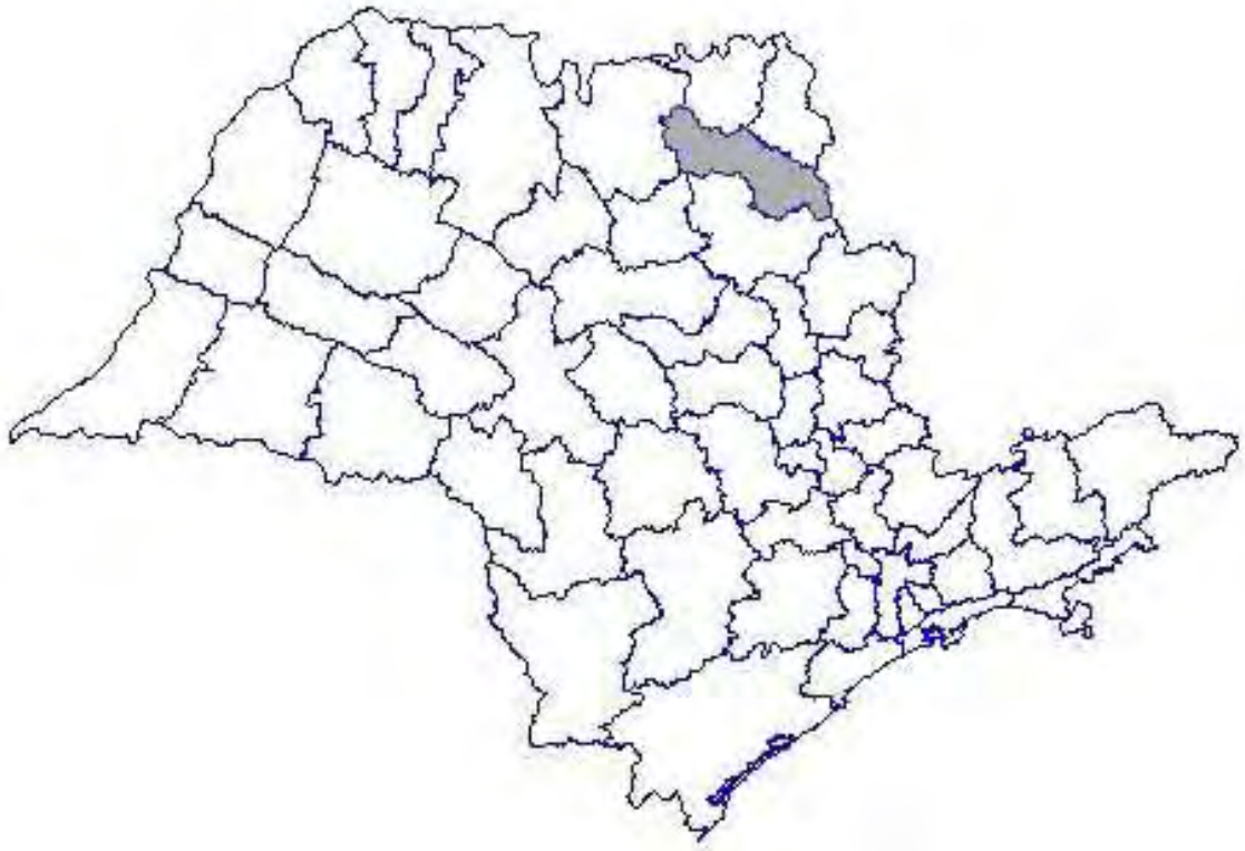
Figura 1: Divisão das Circunscrições Judiciárias do Estado de São Paulo

Na figura abaixo podemos observar a divisão das 56 Circunscrições Judiciárias do Estado, em destaque está a 39ª Circunscrição de Batatais, a qual é composta pelas Comarcas de: Altinópolis, Batatais (sede), Brodowski, Morro Agudo, Nuporanga e Orlândia, Comarca esta última onde atuamos profissionalmente.