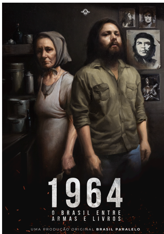
Figura 3 – Banner do filme “1964: O Brasil entre armas e livros”