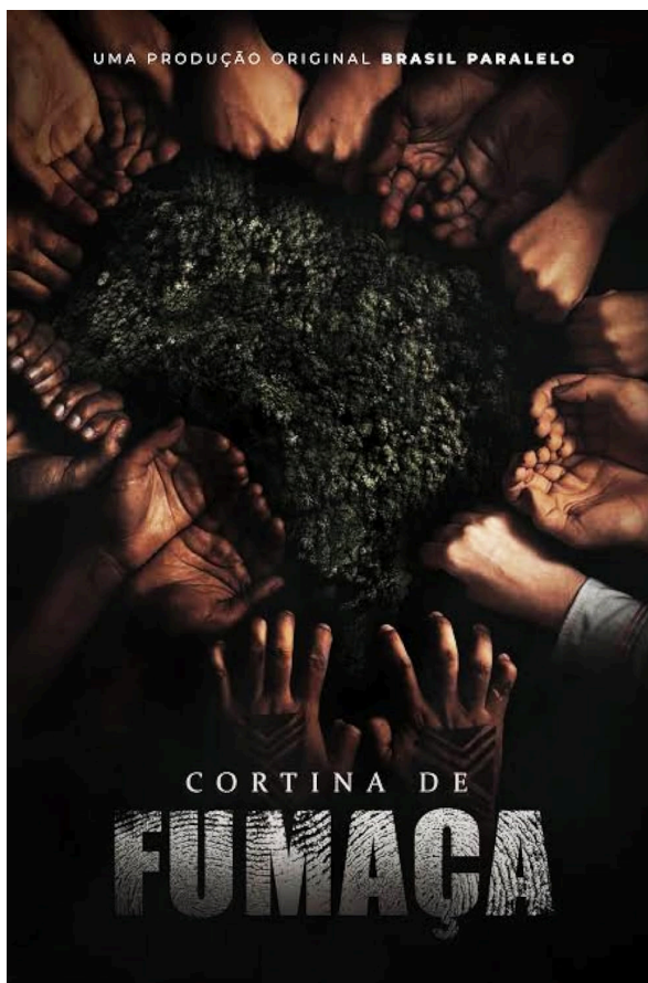
Figura 4 – Banner do filme “Cortina de Fumaça”