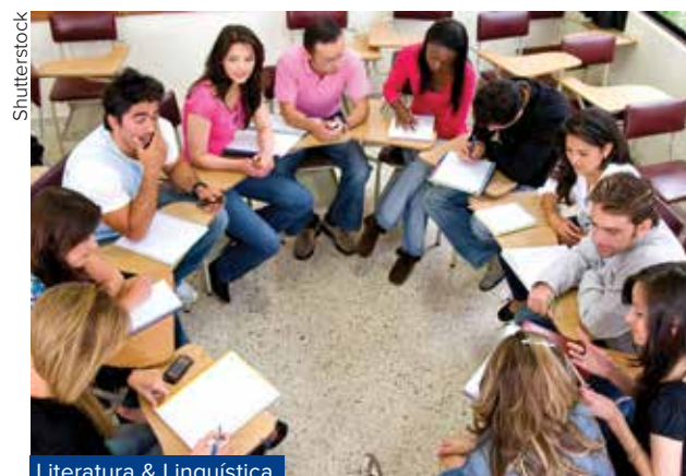
Literatura & Linguística

documentos: cópia do passaporte ou identidade, histórico escolar e comprovação de recursos para se manter no país. Encerrado este processo, os alunos devem “salvar e enviar” a inscrição.