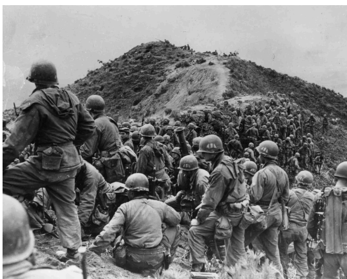
Figura 3: Tropas norte-americanas tomam posição em 1951, durante a Guerra da Coreia.

A guerra da Coreia teve início em junho de 1950, e tanto Kim quanto Rhee buscavam a reunificação da Coreia sob seu manto político, e perpetuaram uma série de ameaças ao longo dos dois anos entre os novos países estabelecidos, ao contrário do que se compreende na esmagadora maioria das fontes ocidentais, a guerra foi iniciada pelo exército submisso da Coreia do Sul, ou seja, pelos EUA.