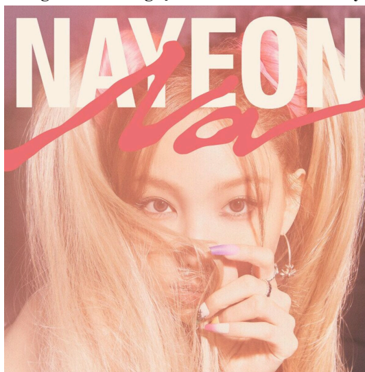
Figura 8: Divulgação do Álbum “NA”- Nayeon