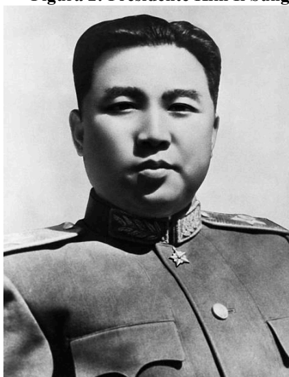
Figura 2: Presidente Kim Il Sung

Apesar de sua impopularidade e administração marcada por corrupção, em julho de 1948, foi estabelecida a República da Coreia no sul (RC), apoiado por uma ocupação militar estadunidense. Quase ao mesmo tempo, no norte, foi formada a República Popular Democrática da Coreia (RPDC), liderada por Kim Il Sung. Em suma, a Coreia acabava de se tornar uma vítima geopolítica espremida entre as duas superpotências.