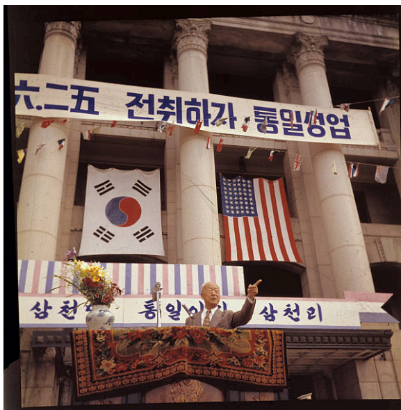
Figura 1: Presidente Syngman Rhee