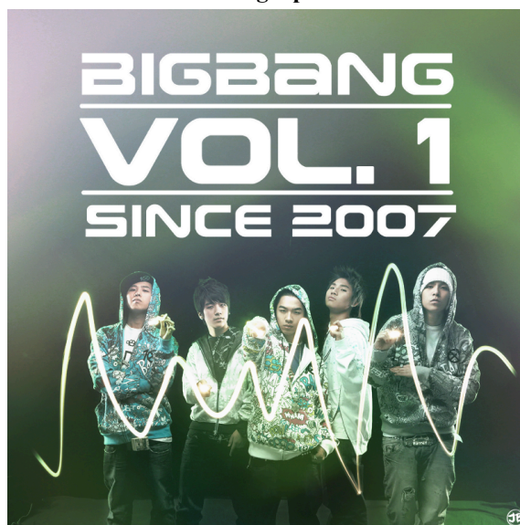
Figura 5: Primeiro álbum do grupo masculino BIGBANG. (2007)