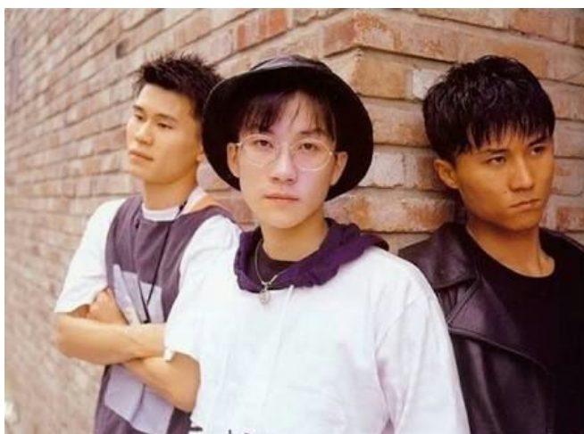
Figura 4: Primeiro grupo musical sul-coreano em atividade. Constituído pelos membros Seo Taiji, Yang Hyun-suk e Lee Juno.

Mas só foi possível consolidar o surgimento do K-pop, a partir da política de abertura econômica que foi imposta no governo de Park Chung Hee. Com um estilo musical focado em danças coordenadas e alto nível de performance em músicas que juntam canto com rap e mistura os idiomas coreano e inglês, começou na música pop sul-coreana nos anos 1990 com o grupo Seo Taiji and Boys, que foi um dos primeiros grupos a introduzir ritmos como a música eletrônica, o hip-hop e o techno na música sul-coreana, e esteve em atividade entre 1992 a 1996.