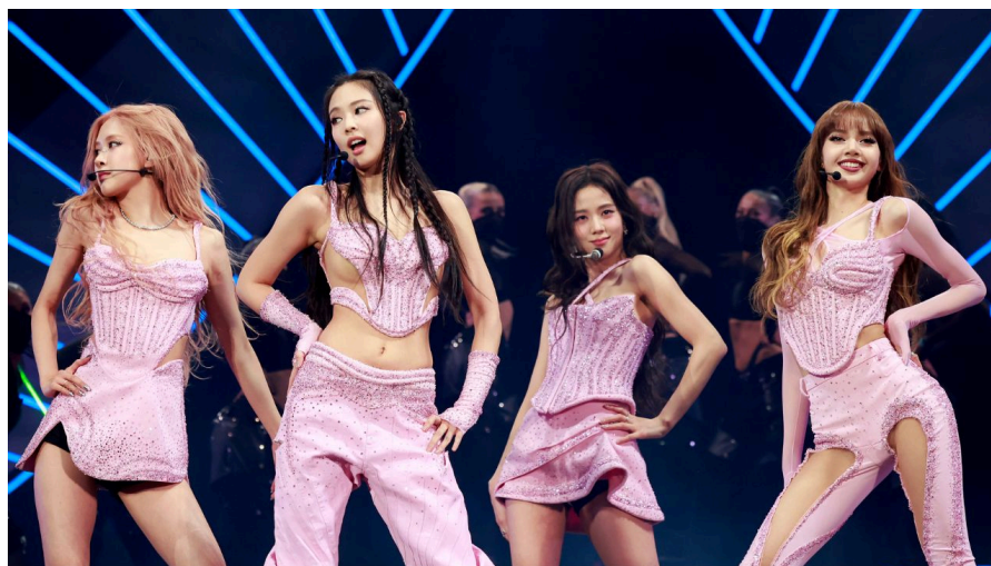
Figura 9: Grupo Feminio Blackpink no Coachella em 2023 como headlines .

do grupo a entrar na parada, o que é um feito e tanto para uma faixa solo, além do retorno do grupo como atração principal ( headline ) mais uma vez do festival Coachella 2023.