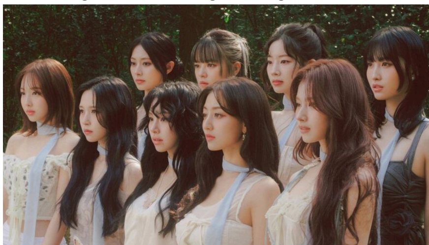
Figura 7: Twice em divulgação do single “I Got You” em 2024.