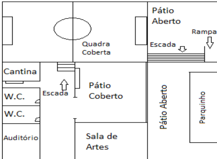
Figura 2: PLANTA BAIXA PÁTIO: ESCOLA 2