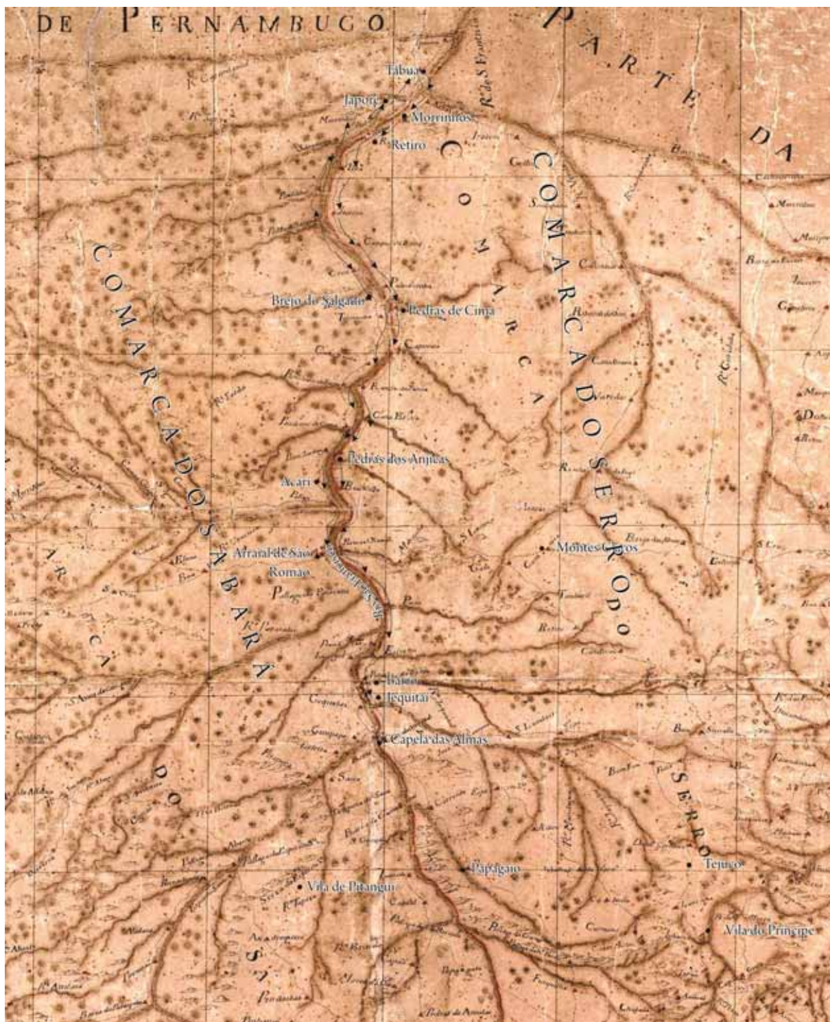
FIGURA 4 – Itinerário dos motins sertanejos