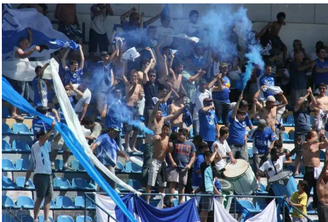
Imagem 2 – Torcida do Rio Claro F.C.

de descontentamento e alienação entre os torcedores. Em vez de celebrações, o que se viu foram protestos organizados contra a diretoria do clube, um sinal inequívoco de uma base de apoio frustrada e em conflito com a gestão.