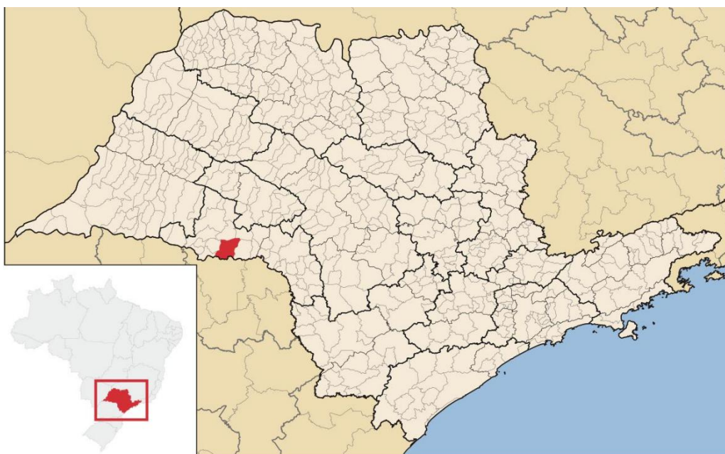
Figura 2- Localização de Cândido Mota em São Paulo

Em 24 de dezembro de 1921, Cândido Mota se tornara um distrito de Assis pela lei nº 1.831. Logo, em 28 de dezembro de 1923, pela lei nº 1.956, emancipa-se do município de Assis e a primeira comarca foi fundada em 14 de março de 1924 (Alexandre, 2023).