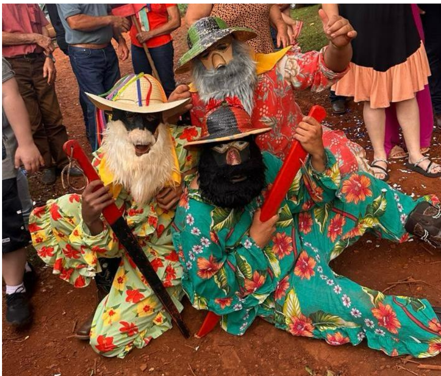
Figura 4- Palhaços na saída da bandeira no sítio São José, propriedade da família Godinho na Água do Almoço em Cândido Mota/SP.