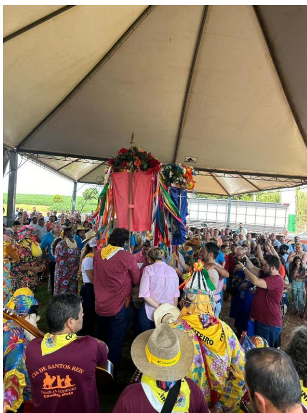
Figura 6- Encontro das bandeiras no dia Reis, 6 de janeiro de 2025.