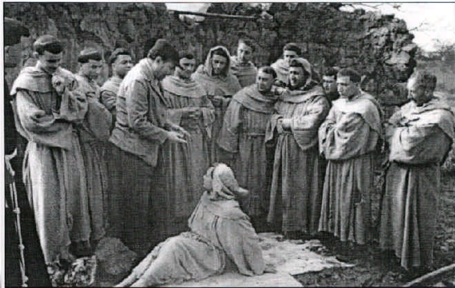
Cena de "Francisco, Arauto de Deus", de Roberto Rossellini.

persuadir e impregnar radicalmente pelo Evangelho é que ele começou a pregar aos outros." (1993)38