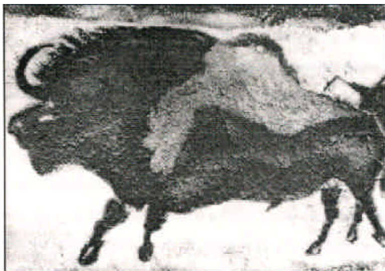
Representação mítica da caça como fonte de alimentação e vida?

Acrescenta que o mito não é um pensamento discursivo que opera sobre princípios gerais ou leis aceitas do pensamento e do ser.