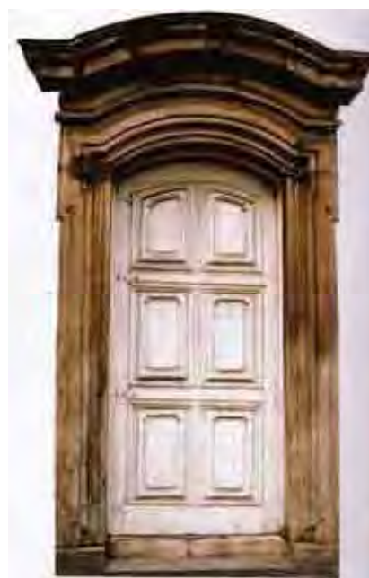
Fig. 69. Porta da torre Santos, 1760