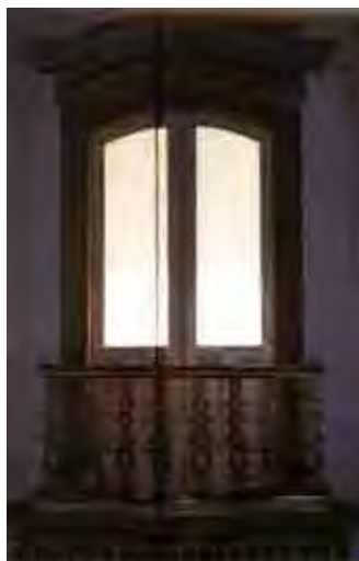
Fig. 76. Guarda corpo pouco projetado com base e peitoril levemente arqueado branco com frisos dourados, balaústres (6) em madeira recortada em curvas e contra curvas, vazadas, pintados de branco. (estilo oriental - Ordem primeira de Santos)