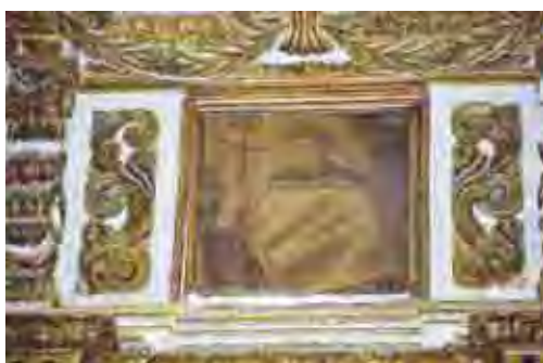
Fig. 85. São João da Cruz – Ordem terceira de Santos

Conforme os historiadores somente as duas primeiras pinturas pertencem a Frei Jesuíno, estudo este que deve ser analisado e catalogado pelo Iphan.