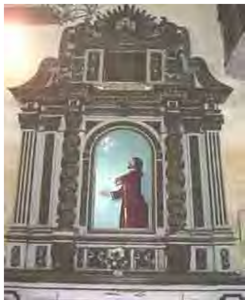
Figura 44. Retábulo Lateral da ordem terceira

Temos na nave seis retábulos em talha que apresentam as imagens do sofrimento de Jesus Cristo: no lado direito, a Agonia, a Prisão, a Flagelação, no lado esquerdo, a primeira Queda, a Condenação e a Coroação. Esses retábulos foram executados possivelmente no último quartel do século XVIII, levando-nos a um estilo bem anterior do maneirismo sob a influência da companhia de Jesus. O conjunto é considerado o mais importante da baixada santista devido à unidade de estilo.