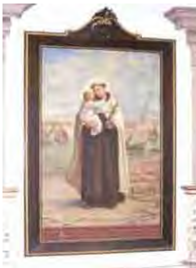
Figura 41. Santo Alberto de Messina – Benedito Calixto – óleo sobre tela INSCRIÇÃO NA MOLDURA: SANTO ALBERTUS ORDINIS CARMELITARUM, THAUMATURGUS SICILIANUS MESSANAE OBIENS INCHOCENTIBUS ANGELICIS CORIS MISSAN “OJUSTI AB JPSO DOMINO AD SCRIPTUS ET CATALOGOO SANCTORUM”

Representação de Santo Alberto de Messina (1240-1306), numa pintura da década de 20, de cunho acadêmico, em que a figura do santo está em atitude de piedade, com expressão suave e doce, vestes muito caída, tendo como paisagem de fundo uma enseada e uma cidade europeia diluída no horizonte.