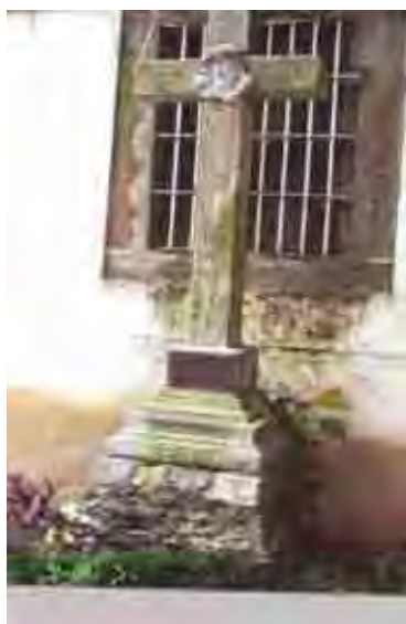
Figura 45. Cruzeiro

No início do século XVII, essa cruz achava-se nesse terreno, e deu nome a uma das principais ruas do povoado de Santos, Rua da Cruz , uma edificação do século XVII.