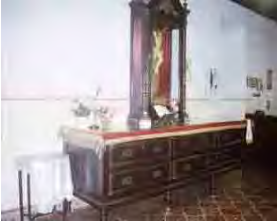
Figura 47. Arcaz e Oratório