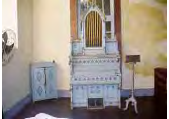
Figura 48. Órgão localizado no coro. Não possui estudos sobre sua origem e datação.

Mobiliário na sacristia da ordem terceira, com um belíssimo oratório e um crucifixo do século XVIII.