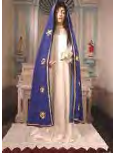
Figura 52. Nossa Senhora das Dores, santa de vestir

Santos de vestir, representando Nossa Senhora das Dores, localizada na capela lateral, em posição frontal, com os olhos levemente voltados para baixo, cabelos longos, naturais, caindo nos ombros, segurados por grampos, braços flexionados, mão esquerda estendida e mão direita voltada para o ventre.