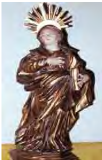
Figura 27. Sant'ana Altura 87 cm, Largura 41 cm, Profundidade 30 cm

Imagem de Santana, mãe da Virgem Maria, localizada no retábulo lateral à direita, vestindo túnica e manto bíblicos e com um livro na mão; por estar em pé, essa santa é conhecida como “Santana caminhante” e forma um conjunto com São Joaquim.