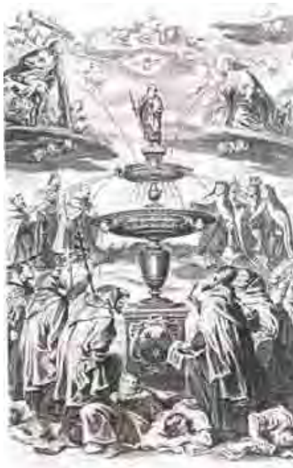
Figura 1. La fonte de Elias

Do espírito de piedade temos o ramo do Carmelo, da presença feminina representada por santa Tereza, Ângela Bohema e santa Maria Magdalena de Pazzis, e a masculina, simbolizada por são Simão Stock, são Andrés Corsino e são Alberto de Sicília; do “espírito de ciência” temos São Angel, São Pedro Tomás, São Cirilo de Alejandria, o Papa São Denis, São Cirilo de Constantinopla e São Spiridón, encontrando-se abaixo os hereges.