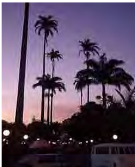
Fig. 59. Praça do Largo do Carmo ao anoitecer/2006