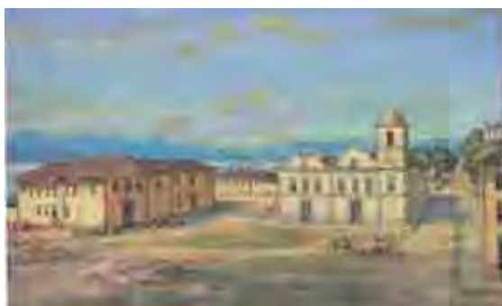
Fig 5: Matriz Colonial de Santos

Na imagem abaixo, vemos a antiga “Matriz Colonial de Santos, construída no séc. XVIII. Ao lado, o Colégio dos Jesuítas, ambos demolidos”. Atualmente, no local se encontra a Praça da República e o prédio da Alfândega, pintura que Calixto, através de seus estudos, guardou para a memória santista. Vemos também uma fotografia antiga do colégio dos jesuítas.