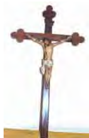
Figura 35. Escultura do século XVIII: (porte atlético, madeira, policromia)