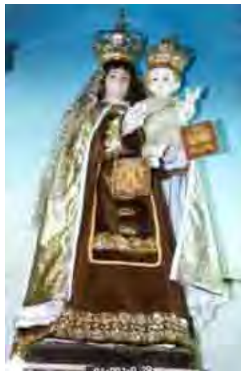
Figura 23. Imagem Nossa Senhora do Carmo Altura 140, Largura 47, Profundidade 42

Trata-se da representação de Nossa Senhora do Carmo, vestindo o hábito marrom da ordem e capa branca, com o menino Jesus na mão esquerda e o escapulário na direita, ambos com coroa real. A devoção a Nossa Senhora do Carmo está associada à história da Ordem, fundada no final do século XII, que diz que homens piedosos se refugiaram no Monte Carmelo em busca de uma vida espiritual mais profunda. Um livro muito antigo da ordem