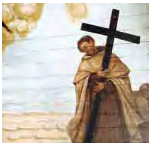
Fig. 81. São João da Cruz. Forro do Coro da ordem terceira do Carmo, São Paulo, 1796

No entanto, há inovação nas obras de Jesuíno, ele procurou a beleza física de seus santos, fez uma opção estilística própria, fisionomias diretas e corpos dotados de grande plasticidade e sem o rebuscamento típico do barroco. Há em seus anjos motivos de esperança e alegria na busca da perfeição de seus santos.