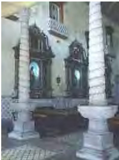
Figura 55. Entrada Ordem terceira