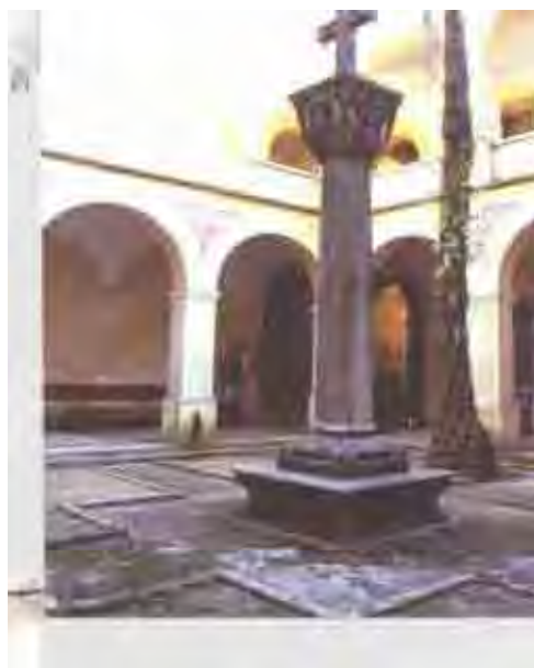
Figura 31. Obelisco: Início do Séc. XX (Monumento de Inspiração Gótico Bizantino/No Clausto)