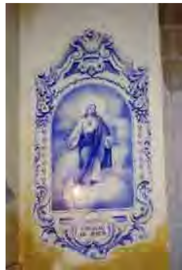
Figura 50. Imagem do Sagrado Coração de Jesus