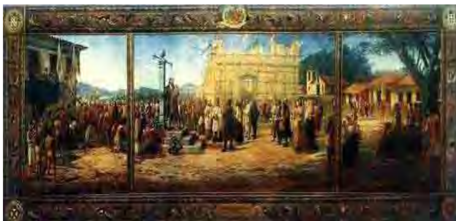
Figura 4. Reprodução: Benedito Calixto - Um pintor à beira-mar - A painter by the sea , edição da Fundação Pinacoteca Benedito Calixto, agosto de 2002, Santos/SP

Benedito Calixto representou a Fundação da Vila de Santos (1922) , com a figura central do capitão Brás Cubas lendo o Foral de Vila; nesse quadro, podemos perceber as características do período colonial; à direita, vemos a capela de Santa Catarina, o pelourinho, símbolo do poder do colonizador, a Casa de Câmara e a Cadeia ao fundo, personagens representando a religião, os fidalgos e colonos ao fundo.