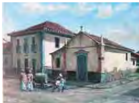
Fig. 9: Benedito Calixto – Capela da Graça, óleo sobre tela 29 x 17

Infelizmente, a capelinha foi demolida em 1903 e temos ciência disso graças à visão preservacionista de Benedito Calixto, que pintou duas telas perpetuando a memória santista e a pesquisas de fotos antigas sobre a cidade. Um dos quadros está em Santos, no Convento do Carmo, e o outro foi doado para a Mitra Diocesana de São Paulo pelo próprio autor, encontrando-se no Museu de Arte Sacra de São Paulo.