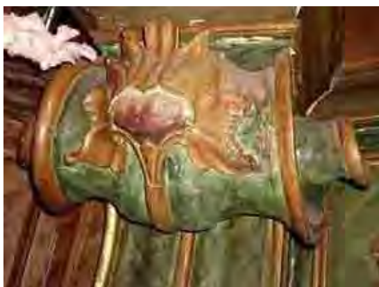
Fig. 72. Volutas da ordem terceira de Itu