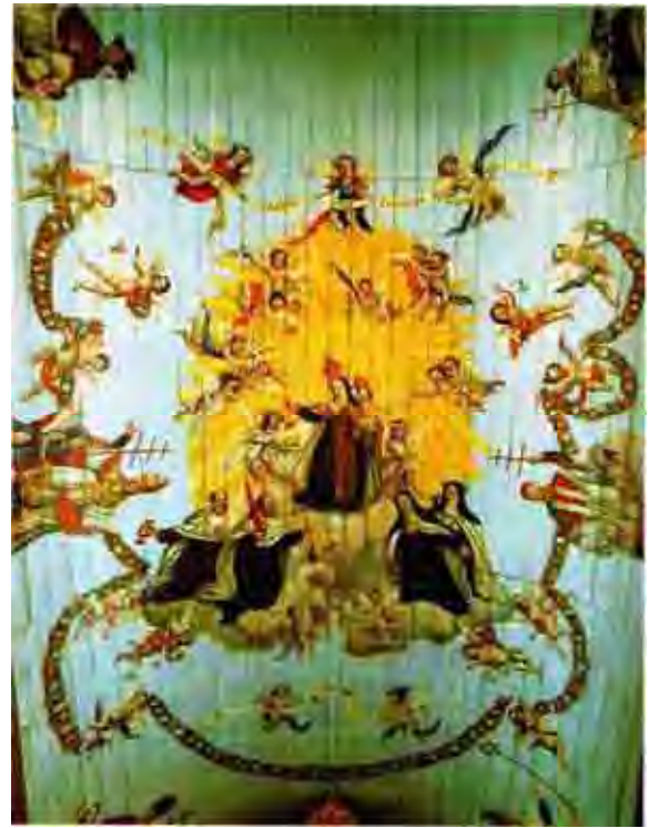
Fig. 78. Festões circundam a pintura, com anjos e papas carmelitas. Ao centro a Virgem do Monte Carmelo segura o menino Jesus e, aos seus pés, Elias e Eliseu com duas santas carmelitas. Ordem terceira do Carmo, Itu