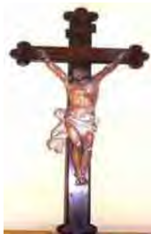
Figura 34. Escultura da primeira metade do século XVIII: (Origem portuguesa, com rosto muito expressivo)

Na ordem primeira, temos crucifixos utilizados nas liturgias ou espalhados pelo prédio; com um olhar atencioso, somos levados a ter sentimentos de adoração; ou podemos encarar essas obras do século XVIII de maneira científica ou artística.