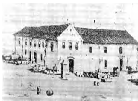
Fig 6: Fotografia do Colégio dos Jesuítas

Os jesuítas foram expulsos de Portugal e do Brasil em 1759, e o Colégio de São Miguel e todas as propriedades dos jesuítas foram confiscadas e incorporadas ao patrimônio público. O prédio do colégio serviu então a várias finalidades: foi hospital militar, correio, alfândega, ficou conhecida como Palacete, hospedou autoridades e a família Real em suas visitas a Santos.