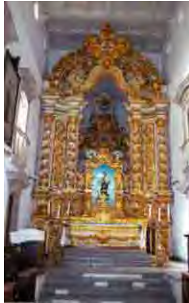
Figura 18. Altar-mor da 2ª metade do século XVIII

Um dos elementos típicos das igrejas coloniais é a profusão de talha (dourada ou policromada) que reveste muita das suas áreas e, em particular, os retábulos.