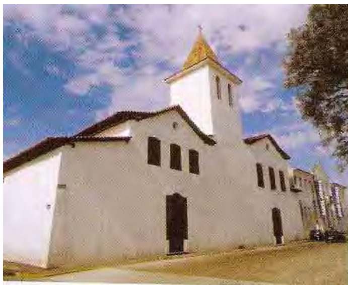
Fig. 56: Fachada do conjunto carmelita de Mogi das Cruzes

Após o restauro de 1971, o conjunto carmelita passou a ser aquele que mais se aproxima de suas formas originais. O de Santos perdeu parte do convento para a construção do Panteão dos Andradas; o de São Paulo restou apenas à igreja da ordem terceira e o de Itu perdeu seu cemitério lateral. Podemos observar que seu frontispício lhe confere dignidade ímpar com sua torre no meio e um ritmo visual é dado pelos desníveis dos telhados, dando uma visão de contrastes entre o moderno e o colonial na cidade de Mogi das Cruzes.