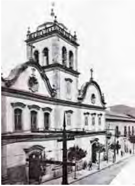
Fig. 70. Fachada de Santos