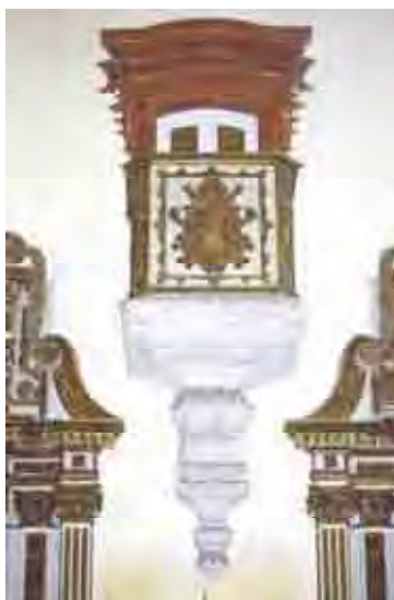
Figura 46. Púlpito

O Púlpito tem a base em pedra esculpida com motivos florais e a concha na base. Sua caixa poligonal é em madeira entalhada com o símbolo carmelita.