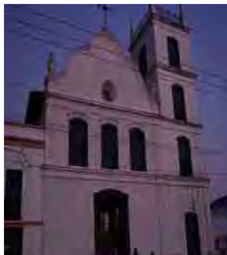
Fig. 60. Fachada do Carmo/Itu