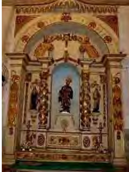
Figura 20. Retábulo lateral de São Joaquim. Montado possivelmente no século XVIII com talhas do final do século XVII (acantos, rosetas, colunas).

Passando pelos dois grandes altares laterais de Cristo Rei, já citado, e de Cristo Crucificado, temos os retábulos do lado esquerdo de São Joaquim, Santa Terezinha e Nossa Senhora do Monte Serrat. Do lado direito, temos os altares de Sant’Ana, São José e Nossa Senhora da Boa Morte. Analisaremos alguns retábulos, entre os quais, o de São Joaquim, pois o de São José, Sant’Ana e Santa Terezinha possuem características semelhantes, com acabamentos diferenciados.