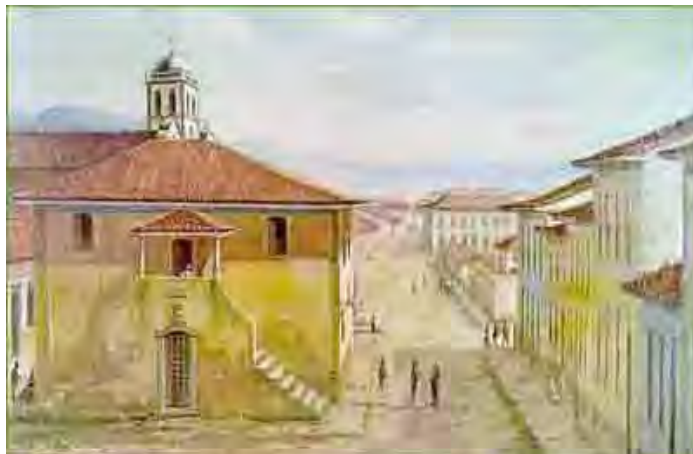
Figura 12. Casa do Conselho ou Câmara e Cadeia (com placa indicando a data de sua construção: 1697), vendo-se atrás parte do Pelourinho, parte da Igreja do Carmo e parte do Arsenal da Marinha. Ao fundo a Rua Direita, hoje XV de Novembro. O prédio branco após o Arsenal, à direita na imagem, erguia-se no terreno hoje ocupado pelo prédio do Banco do Brasil.

Em 1822, na pintura da reconstituição de Santos no Panorama de Benedito Calixto, podemos observar que a arquitetura religiosa possui áreas cobertas e livres, onde se vê a área do Valongo e a foz do São Bento, com o Convento de São Francisco à direita e a Capela de Jesus, Maria e José à esquerda. (Este painel pode ser admirado no prédio da Bolsa Oficial do Café).