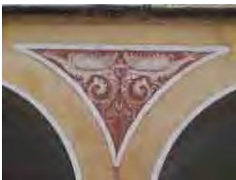
Fig. 74. Símbolo do dragão – Ordem primeira de Santos/SP

É interessante como a pintura ou ornamentação oriental estão presentes em nossas igrejas. Provavelmente o vasto império luso passando pelo Oriente, aportou por São Paulo trazendo contribuição decorativa para nossas capelas e igrejas, tais como, balaústres vazados, portas com motivos da China, pinturas utilizando as cores de vermelho, azul e ouro à imitação oriental, chamados também de chinesices. Preciosidade que enriquecem os domínios do simbolismo seja em sua forma codificada gráfica ou artística, onde o valor simbólico fundamenta e intensifica o religioso.