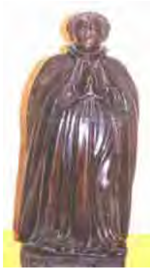
Figura 25. Santo Jesuíta Altura 90 cm, Largura 31, Profundidade 30 Cm.

Escultura datada do século XVII, originária do litoral paulista, que se encontra no claustro superior e meio ingênua, lembrando as peças de terracota da época. Trata-se da representação de um santo jesuíta, a julgar pela batina e pela capa, e que não possui nenhum atributo pessoal. A peça foi esculpida em madeira clara, num único bloco, com emenda na cabeça e pintura recente em preto e verniz; na peanha, é possível encontrar resquícios de verde.