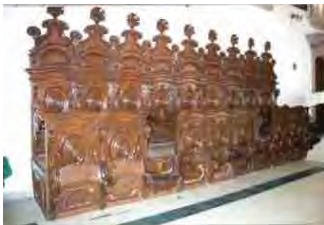
Figura 30. Cadeiral – Séc. XVIII

Peça em madeira (jacarandá) recortada e ensamblada, composta de várias partes, datada do período joanino, século XVIII (cerca de 1730-1750), de execução muito cuidadosa, com decoração em volutas e frisos de movimento ondulatório ao gosto barroco, com arremate em elementos decorativos tais como conchas e palmetas.