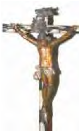
Figura 36. Escultura de madeira, policromia do século XVIII.