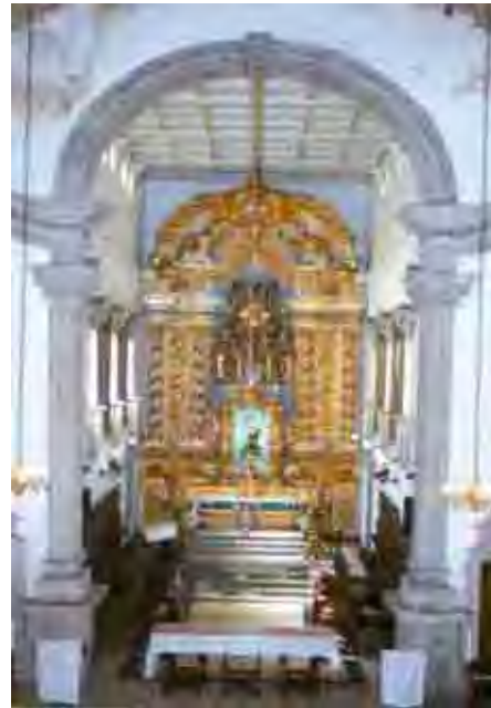
Fig. 65. Arco Cruzeiro da ordem primeira de Santos