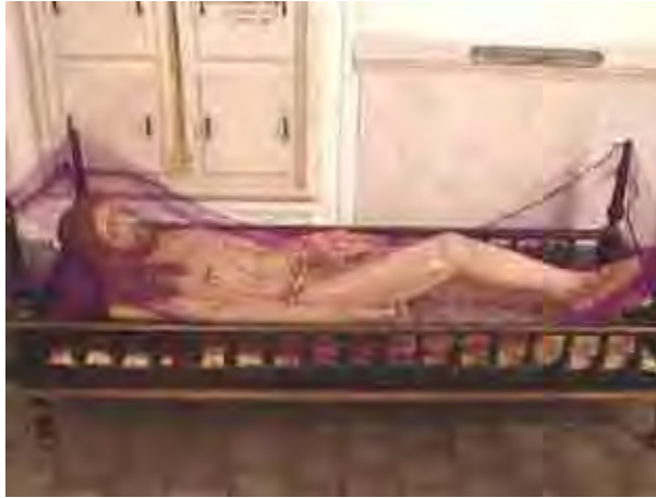
Figura 53. Cristo atado com o manto

Peça toda esculpida na capela mortuária, utilizada na Semana Santa, e que representa Cristo em seu esquife mortuário.