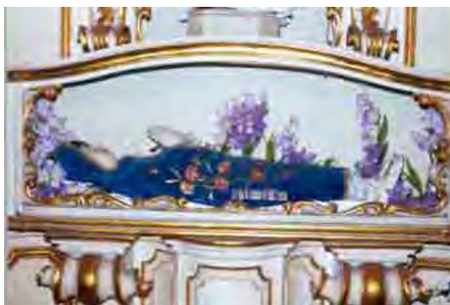
Figura 28. Nossa Senhora da Boa Morte

Localizada no retábulo lateral à direita, a imagem é do século XVIII ou início do século XIX e representam o trânsito da Virgem Maria ou Nossa Senhora da Boa Morte, em que esta aparece jacente em seu esquife mortuário, vestindo a túnica branca com manto azul, símbolos da pureza virginal.