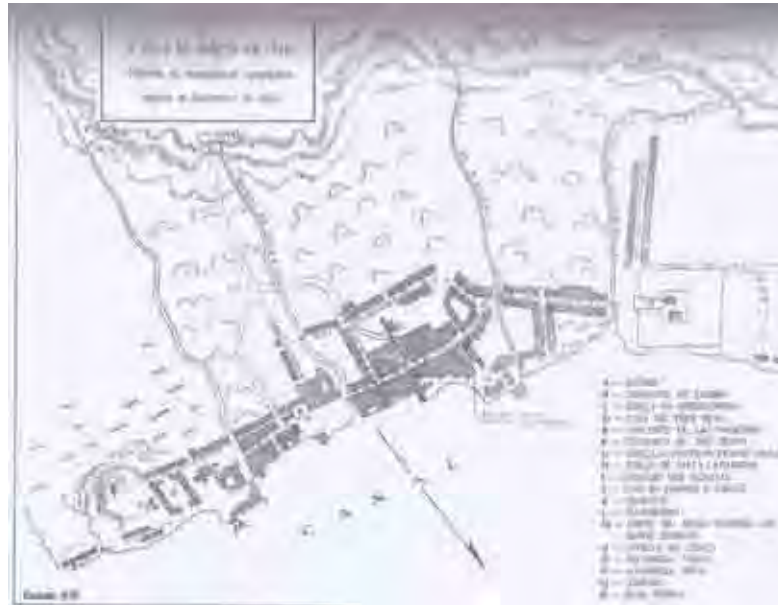
Figura 10. Vila de Santos em 1765 - Reconstituição Topográfica segundo documentos da época.

Em 1848, conforme os recibos de impostos encontrados no arquivo têm em torno de quarenta casas pertencentes ao Convento do Carmo na cidade (Arquivo do Carmo de Belo Horizonte – Anexo 2.1).