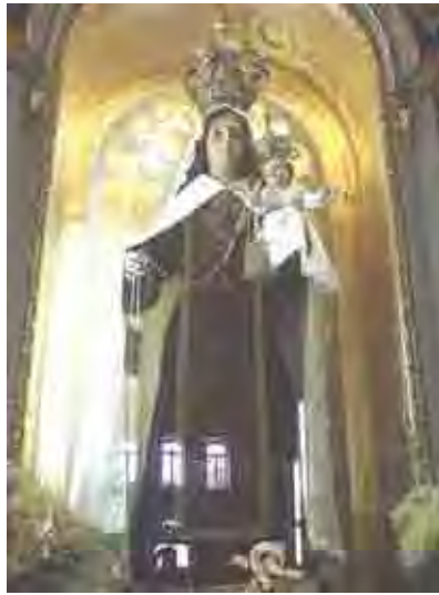
Figura 54. Nossa Senhora do Carmo

Nossa Senhora do Carmo, localizada no altar-mor, com feições portuguesas, santa de vestir, com carnação rosa, olhos de vidro, segurando o escapulário na mão direita e o menino Jesus, na esquerda. Duas coroas de prata acompanham as imagens, com belíssima roupagem carmelitana, provavelmente datada do século XVIII.