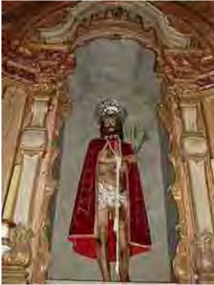
Fig. 57. Altar de Miguel Francisco Imagem de Pedro da Cunha/ Itu – 1781