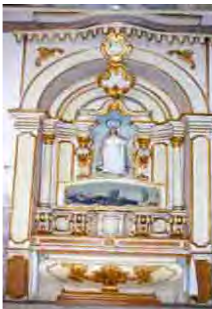
Figura 22. Altar lateral N. Sra. da Boa Morte. Datável de fins do século XVIII, ou início do século XIX.

Na ordem primeira da nave, trata-se do quarto altar à direita. O retábulo, datado de fins do século XVIII ou início do século XIX, é bastante despojado, com colunas lisas e coroamento com sanefa arqueada e acima possui duas tarjas. O altar em urna é igual a todos