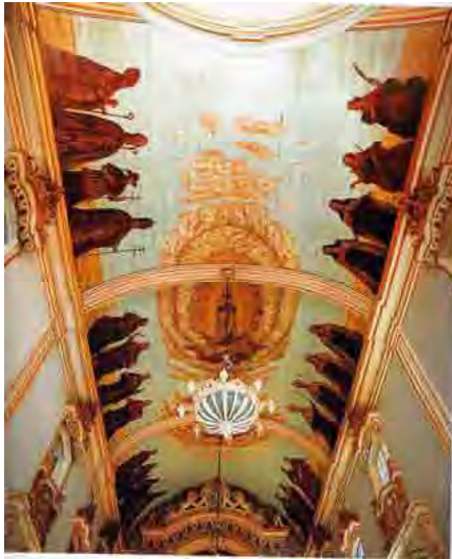
Fig. 83. Ordem terceira do Carmo, São Paulo, 1796. Santos e beatos carmelitas. Pintura em tamanho natural da nave da igreja.