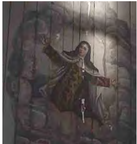
Fig. 80. Êxtase de Santa Teresa, Da visão central do forro da nave, Itu, 1794