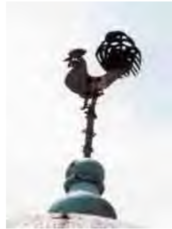
Figura 16. Galo com globo. Elemento decorativo do século XVIII, fixado no pináculo da torre.