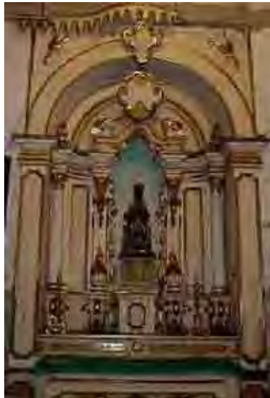
Figura 21. Altar Nossa Senhora do Monte Serrat - fins do século XVIII.

Trata-se de um retábulo datado de fins do século XVIII ou início do século XIX, com altar igual aos demais, estrutura simplificada com colunas lisas e quartelões. Sua talha rasa é de inspiração rococó, planificada e de execução pouco elaborada.