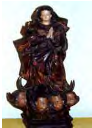
Figura 24. Nossa Senhora da Conceição Altura 73 cm, Largura 40 cm, Profundidade 37