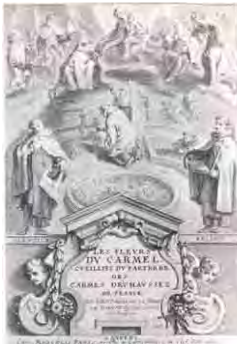
Figura 2. Frontispício de Lês fewrs do Carmel

escapulário a São Simão Stock, que aparece acompanhado por um pontífice, João XXII, que deu a Bula Sabatina a Honório III, aprovando as Constituições; vemos também as figuras de Elias, Eliseu, são Alberto e são Ângelo.