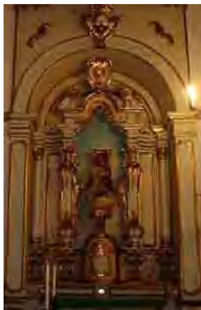
Figura 19. Retábulo lateral de Cristo Rei (datável do final século XVIII)

O retábulo lateral é muito verticalizado, datado de fins do século XVIII ou início do século XIX, com fundo branco, pouca talha de gosto rococó, mas já tendendo ao neoclassicismo. Conforme dados do Iphan, embora a talha lembre a do altar-mor, o autor deve ser outro, com pouca perícia na execução. A pintura é em branco e creme, com douramento recente.