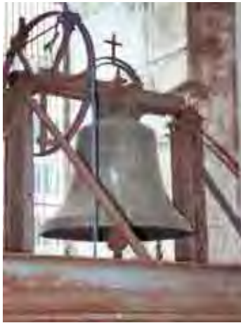
Figura 15. Sino com badalo de ferro fundido. Convento de Santos, 1968.