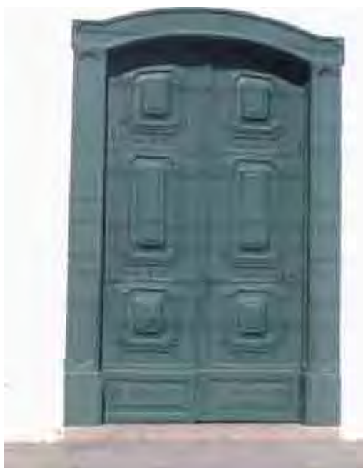
Fig. 68. Porta da igreja do Carmo, Itu, 1779

São possibilidades de redobramentos e desdobramentos desse universo. Assim, a arte só se justifica quando ela dá voz e se incorpora a fragmentação do mundo, é como procurar não aniquilar o que lhe é exterior, nem ignorar o mundo. É a possibilidade de aflorar em símbolo o essencial que há para dizer.