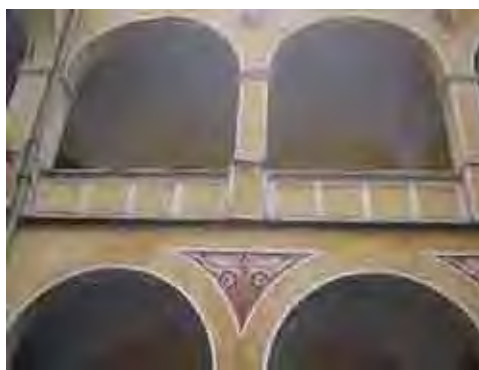
Fig. 75. Arco romano – Pátio Interno. Santos/SP