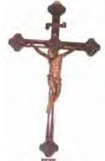
Figura 33. Escultura do século XVII ou início do século XVIII. Feições eruditas.

A cruz, caracterizada pelo número quatro, é símbolo da união dos contrários (acima-embaixo-para o sol e seu curso para as quatro direções do vento). Como sinal de salvação ou de proteção, aparece em numerosos selos e amuletos da Antigüidade.