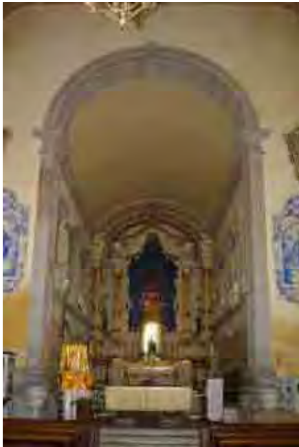
Fig. 64. Arco Cruzeiro da ordem terceira em Santos Feito de pedra de cantaria

Vemos abaixo quatro arcos semelhantes e com características diversas adaptando-se a cada templo e datando-o de mensagem e significado. É uma ligação intrínseca entre o discurso católico e a estética barroca, que se comunica com o adepto de forma não clara e transparente. No entanto, o chama para o passo seguinte, para um caminhar rumo a um triunfo que não significa glória e muito menos alegrias. É preciso caminhar sempre, passar pela porta, percorrer pela nave, passar pelo arco e enfim chegar ao altar, digno de todo aquele que já percorreu todo o caminho.