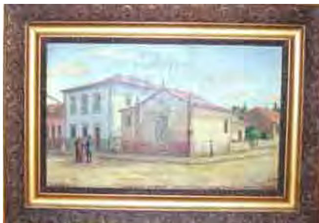
Figura 42. Capela da Graça – Benedito Calixto Encontra-se na Ordem Primeira e outra pintura semelhante no Museu de Arte Sacra de São Paulo

Quadro com moldura côncavo-convexa, decorada com frisos curvos, conchas e ovais.