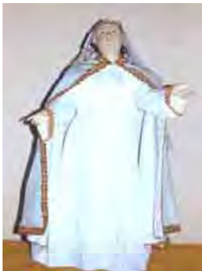
Figura 29. Nossa Senhora da Assunção Altura 98 cm, Largura 50 cm, Profundidade 26.