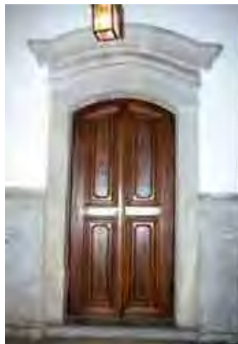
Figura 17: Portadas em granito aparelhado em 8 blocos e 9, folhas em madeira recortada e ensamblada, 3 dobradiças recentes. Pintura a óleo castanho e verniz. Desenho simples, com sobreverga em molduras largas certamente datável do século XVIII. Portas em almofadas rasas.

Os conventos sempre foram incentivos ao crescimento urbano e, muitas vezes, desempenharam o papel de defender a cidade.