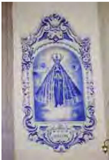
Figura 49. Imagem de Nossa senhora Aparecida