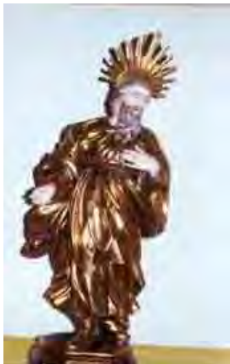
Figura 26. São Joaquim Altura 87 cm, Largura 42, Profundidade 29,5

Representação de São Joaquim, marido de Santana e pai da Virgem Maria, como um ancião com cabelos e barba longos e vestes bíblicas (túnica e manto).