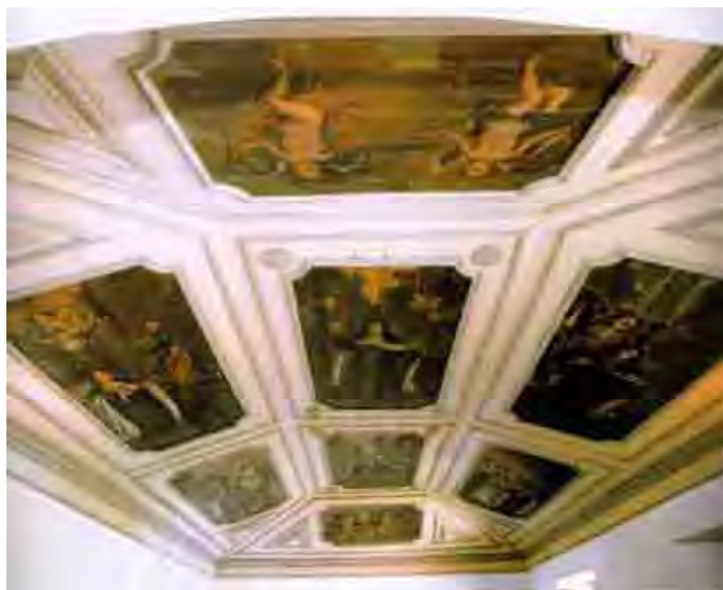
Fig. 84. Capela velha da ordem terceira do Carmo, Itu, Teto do consistório, constituído de seis painéis com a vida de Santa Teresa.