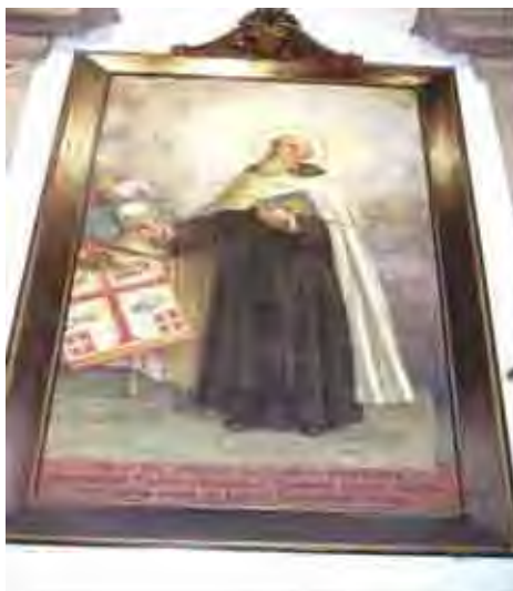
Figura 40. Beato Nuno Alvarez Pereira – Benedito Calixto – óleo sobre tela Inscrição: BEATUS NONIUS ALVARES PEREIRA – SERENÍSSIMA E FAMILIA BRIGANTINAE FUNDATOR COMES STABILIS PORTUGALIAE REGNI ET LAICUS CARMELITIDIS ORDINIS.

Beato Nuno Álvares Pereira é o fundador do Convento e do Laicato da ordem do Carmo em Portugal (1360-1431).