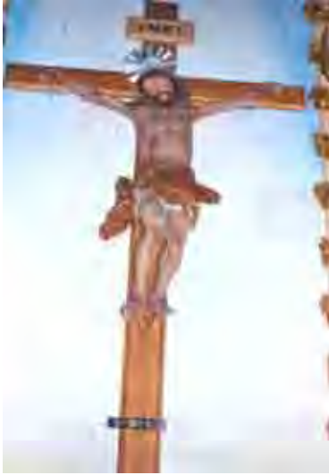
Figura 32. Escultura do século XVIII – localizado no retábulo lateral à direita. Policromia em rosa, vermelho, castanho com douramento, carnação rosa escuro