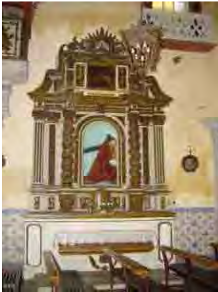
Fig. 62. Cristo com a Cruz as costas Ordem terceira do Carmo/Santos