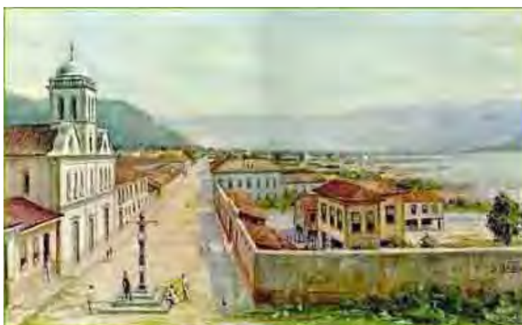
Figura 11. Conjunto do Carmo vista de perspectiva; o Pelourinho no primeiro plano, à direita o Arsenal de Marinha e o estuário. Ao fundo, a Rua Direita, hoje XV de Novembro, no Centro de Santos. A tela, não datada, com 45 x 70 cm, pertence ao acervo da Fundação Pinacoteca Benedito Calixto, de Santos.

Certamente, esse homem do barroco encontrou um “Ar Livre” de acordo com MARX (2005), na Vila de Santos de 1770. De acordo com a sua planta, espaço aberto para o mar, a antiga Rua Direita recebe o convento do Valongo em 1642, a igreja Matriz (1746) e a igreja do Carmo, que têm à sua frente o pelourinho e o Arsenal da marinha. De um lado, a vila caminha para o norte, com a área do Valongo, hospedarias e casas comerciais, e, de outro lado, a área principal, junto ao Outeiro de Santa Catarina, com os Quartéis e a Casa do Conselho.