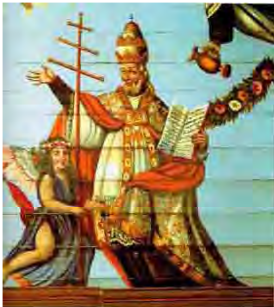
Fig. 79. Papa carmelita com capa de aspergir, teara papal e livro bíblico. O anjo segura à cruz papal de três braços e na mão esquerda segura as chaves do céu, iconografia tirada de São Paulo. À direita parte superior, festão e jarro de São Eliseu. Itu/SP