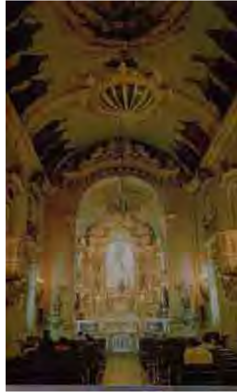
Fig. 67. Arco da Capela do Carmo/São Paulo

Não devemos deixar de levar em conta que durante todo o período em que eram produzidas obras barrocas – criticadas das mais diversas formas, havia um refinamento da representação alegórica. A representação barroca cristalizava o fluxo de eterno devir, fluxo esse em que se inseriam as coisas do mundo, através da alegoria. Essa alegoria nada mais era do que a dissimulação da diferença – característica fundamental da sociedade européia na Idade Moderna – através de representações tendentes à semelhança.