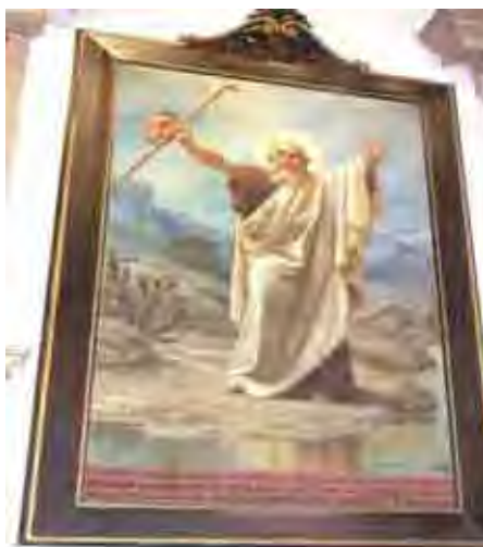
Figura 39. Santo Eliseu – Benedito Calixto – óleo sobre tela Inscrições: ELIZEUS, PROPHETA, DOMINI, SERVOS ELIAE ET CARMELTIARUM PATER SECUNDUS, EGRESSUS AD FONTEN AQUARUM MISIT IN ILLUM

Pintura de cunho acadêmico-historicista representa a figura de um ancião com barbas brancas medianas, meio calvo, com tufo de cabelos brancos, de pé, joelho direito levemente flexionado, descalço, braços abertos, mão direita segurando um cajado e um caneco de barro. A paisagem de fundo é formada por montes terrosos, cactos em tom de cinza e azul claro, o céu em tom de azul, branco e cinza. A seus pés corre um riacho azulado, onde se reflete parte da figura.