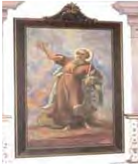
Figura 38. Santo Elias – Benedito Calixto – óleo sobre tela Inscrições na tela “ELIAS PROPHETA DOMINI SACERDOTALI ET TRIBU LEVITA FUNDATOR ET CARMELITARUM ORDINIS PATER DIXIT: ZELO ZELATUS SUM PRO DOMINO DEO EXECTUM... REG XIX, 10”.

Pintura de autoria de Benedito Calixto, datada da década de 1920, de gosto acadêmico, em que a figura destaca-se em fundo neutro, com movimento de contorção do corpo, e vestes esvoaçantes com bom efeito plástico.