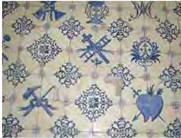
Figura 51. Azulejos do século XVIII

A igreja possui um grande barrado de azulejos, em toda a extensão da nave e da capela-mor. No altar-mor, o barrado ganha mais altura por causa da colocação de cadeiras sobre uma plataforma perto do altar.