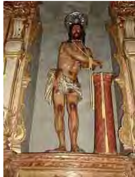
Fig. 63. Cristo da Coluna Ordem terceira do Carmo/Itu

Aliás, os símbolos da paixão são recorrentes em todas as igrejas carmelitas. Os símbolos do suplício de Jesus são sinais que ornaram o topo dos seis nichos da ordem terceira do Carmo de Itu e Santos. Já em Mogi das Cruzes o camarim se abre para abrigar os elementos simbólicos da crucificação formando um conjunto de apelo visual, confirmado pela luz incidente que revela aos poucos o crucificado, com os elementos do martírio sintetizando o que as imagens dos altares laterais preconizavam a via crucis. (Percival Tirapeli, 2004)