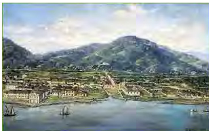
Figura 13. No ano da proclamação da Independência do Brasil Calixto procurou retratar como seria Santos em 1822. Nesta "vista aérea", o pintor mostra o porto de então, em quadro a óleo de 136 x 300 cm conservado no Museu Paulista da Universidade de São Paulo.

Em 1822, na pintura da reconstituição de Santos no Panorama de Benedito Calixto, podemos observar que a arquitetura religiosa possui áreas cobertas e livres, onde se vê a área do Valongo e a foz do São Bento, com o Convento de São Francisco à direita e a Capela de Jesus, Maria e José à esquerda. (Este painel pode ser admirado no prédio da Bolsa Oficial do Café).