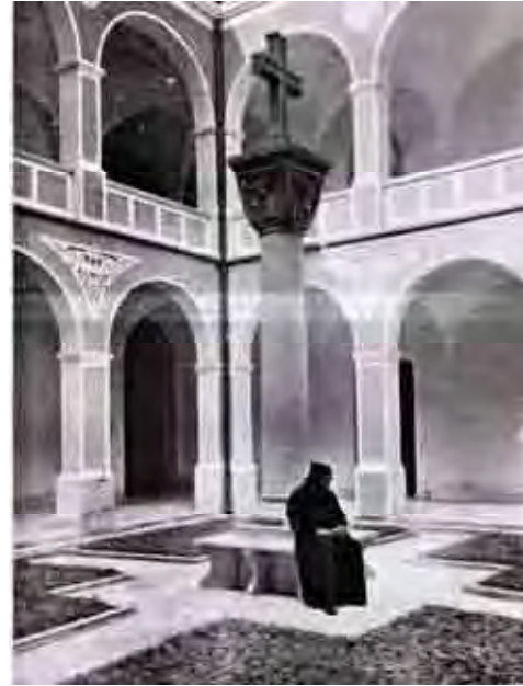
Fig. 71. Pátio interno