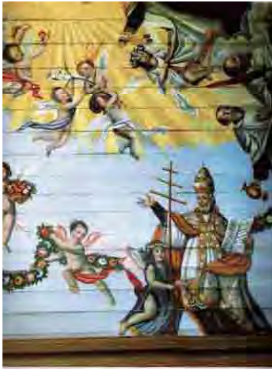
Fig. 77. Pintura do forro da nave, Ordem terceira do Carmo, Itu, 1796.