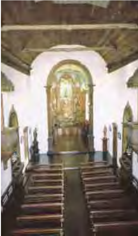
Fig. 66. Nave do Carmo em Itu