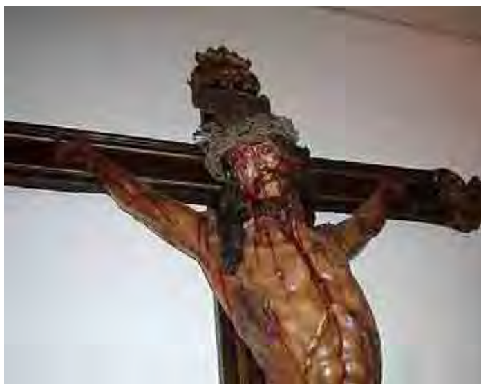
Fig. 61. Pedro da Cunha, 1773, Senhor Crucificado, madeira policromada 175 cm de altura.

A igreja de Itu, logo em sua entrada, apresenta-nos uma bela imagem de Cristo Crucificado de Pedro Cunha, 1773. Onde podemos perceber então como a arte expressa a catequese ou doutrinação do imaginário da época.