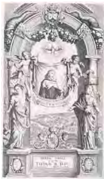
Figura 3. Frontispício de la Opera omnia de Tomás de Jesus.

A maioria dessas fundações está destinada a desenvolver o trabalho empreendido pela Igreja, obedecendo ao desejo de participar da evangelização das massas. E assim fizeram os padres carmelitas, espalhando pelo mundo a fé católica e, especificamente, a espiritualidade carmelitana.