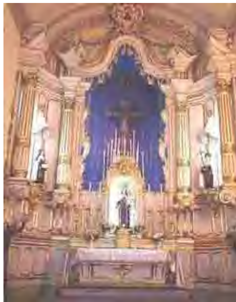
Figura 43. Altar-Mor – Ordem terceira do Carmo

É bastante restrita a parte documental da Venerável ordem terceira do Carmo, de Santos. O incêndio de 1941 destruiu o altar-mor e muitos documentos que tratavam da solenidade da pedra fundamental da sua capela. No dia quatro de setembro de 1752, dia de Santa Rosa de Viterbo, lançou-se aquela pedra, com a epígrafe Ad majorem dei gloriam , no ano seguinte ao do Pontificado de Benedito XIV, tendo sido a mesma conduzida pelo prior da Venerável Ordem do Carmo, Miguel das Águias Cordeiro.