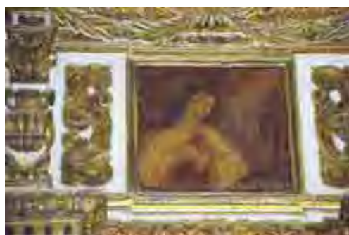
Fig. 86. Santa Tereza D'Avila – Ordem terceira de Santos – Frei Jesuíno

Pesquisas recentes têm dado importância a imaginária e a pintura paulista. Nesse estudo destaquei a pintura de padre Jesuíno do Monte Carmelo, carmelita que deixou sua marca nas igrejas contempladas nessa pesquisa. Obviamente as ordens terceiras carmelitas têm uma conotação de trabalhos atribuídos não só a Jesuíno como também a José Patrício da Silva Manso além de Miguel Dutra, profundo admirador de Jesuíno. Muitas cidades tiveram manifestação artística na arte colonial brasileira, onde destacamos São Paulo, Embu, São Roque, Itu e Mogi das Cruzes.