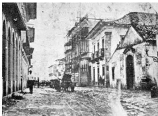
Fig. 8: Capela da Graça na antiga Rua do Sal, com seus casarios

Abaixo, podemos ver a imagem da ermida, imortalizada por Benedito Calixto e uma foto antiga dos arquivos do Prof. Francisco Carbala, professor de história em Santos.