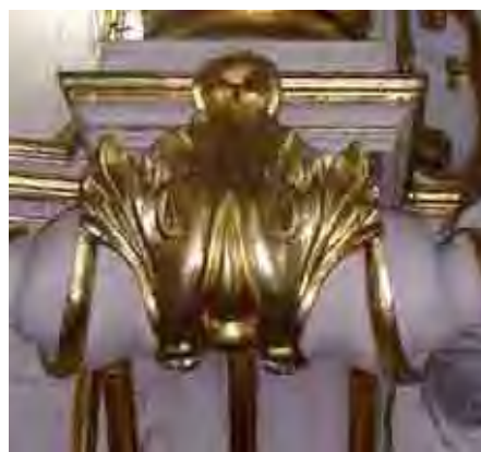
Fig. 73. Folhas de acanto e volutas /Santos

Além da folha de acanto, muitas outras ornamentações ou objetos da arte religiosa compõem o cenário barroco/rococó, que seria impossível destacar ou analisar todos neste trabalho, mas não posso deixar de citar os inúmeros rostos de anjos rechonchudos, sorridentes, tristes, místicos de cores branca ou mulatos compondo o teatro sacro podendo ser um atlante, tocheiro, voante, serafim, arcanjo ou mesmo possuir traços orientais. Seres que representam um mundo não compreensível para os homens, cuja área de causalidade podia estar entre o divino e o demoníaco.