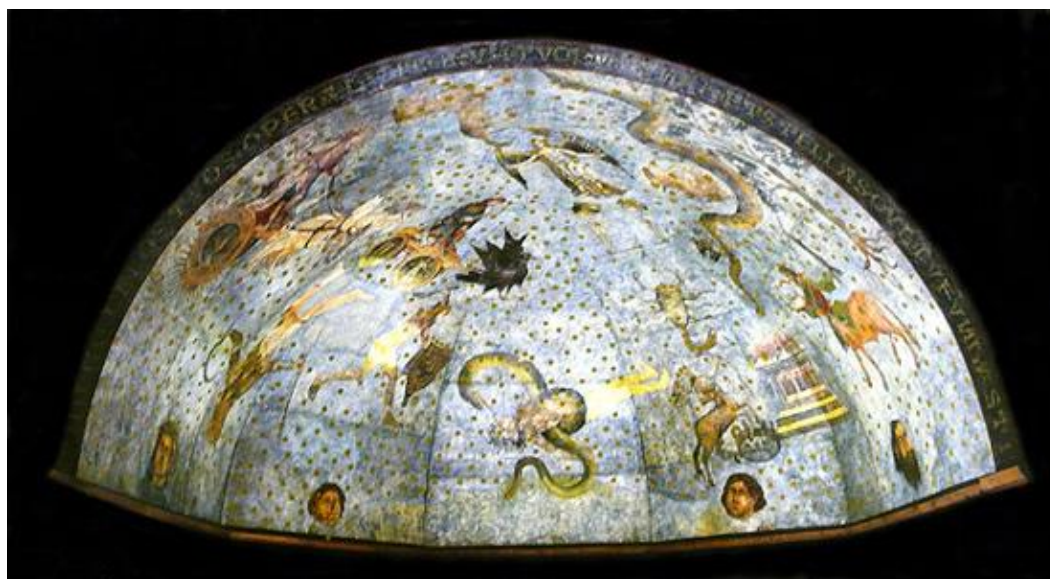
Imagem 4. Céu de Salamanca. Abóbada astrológica da antigua biblioteca da Universidade. 730

zodiaco”. 725 De um lado, estavam pintados o Sol e Mercúrio, sentados em seus carros triunfais puxados por animais que correspondiam a eles próprios aproximando-se das suas casas diurna e noturna. Efigiados nas rodas dos carros havia cinco signos do zodiaco – Leão, Virgem, Libra, Escorpião e Sagitário, bem como as constelações do hemisfério norte e do hemisfério sul. 726 Quatro cabeças humanas aparecem para lembrar os quatro ventos que movem o céu (Zéfiro, Austro, Euro e Bóreas), segundo o mito grego. Nessa pintura, a configuração noturna escolhida para ser representada no teto da biblioteca foi justamente uma noite celebrada da segunda quinzena de agosto de 1475, quando os reis católicos estavam na cidade. 727 A abóboda astrológica da biblioteca, em suma, além de mostrar princípios básicos da ciência astrológica do período, quis proclamar, provavelmente, que a contemplação científica do céu não devia fazer esquecer que as tantas maravilhas que nele se contemplan só poderiam proceder de Deus, 728 tendo em conta a crença partilhada de que os astros se limitavam a executar, com seu perpétuo movimento, as diretrizes marcadas por Ele no começo dos tempos. 729