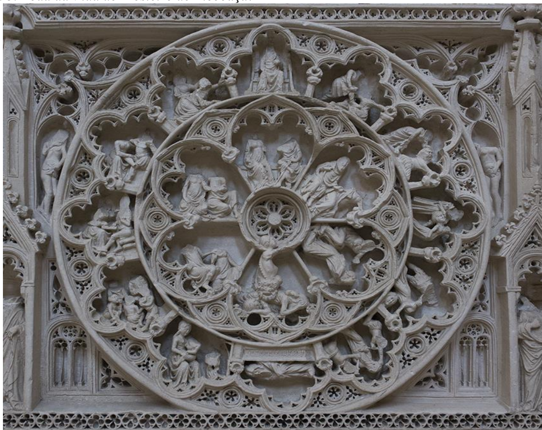
Imagem 3. Roda da Vida do Mosteiro de Alcobaça. 715

maneira que se acreditava na ordem divina para o regimento dos astros, havia a confiança de que os movimentos da Fortuna 713 provinham de Deus. Porém, ainda que fosse obra da vontade divina, a ideia de que a Fortuna poderia deixar pistas através de determinados meios foi bastante propagada e aceita, mas, em contrapartida, tal possibilidade de deciframento dos planos de cima gerava angústias, dada certa apreensão de cada um em relação à capacidade de entender os signos divinos. Esta apreensão e tentativa de adiantamento não pareceu inofensiva para os cristãos, tendo em conta que tanto a determinação de uma força maior, a fortuna, quanto a possibilidade de decifrá-la, poderia interferir na conduta prudente do fiel. Em outras palavras, tal crença desaguaria na dúvida quanto à validade do esforço e do controle sobre si mesmo visando o bem, dado que os feitos estariam já, de qualquer maneira, regidos por essa força que agia à revelia da vontade e da ação humanas. 714