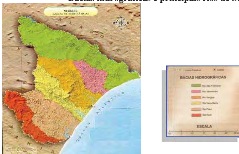
Mapa 2 Bacias hidrográficas e principais rios de Sergipe

Fonte: FRANÇA, V.; CRUZ, M. T. Atlas Escolar Sergipe , 2007, adaptado.