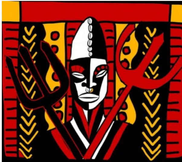
Figura 2 - Ilustração de Exu (Èsù) Orixá