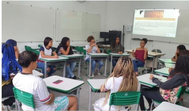
Figura 1 - Grupo focal com onze dolescentes pretas e pardas