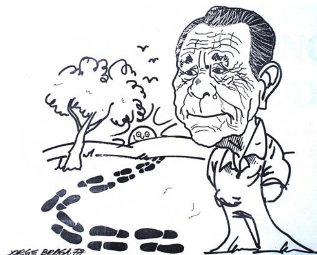
Foto 4 - Caricatura de Carmo Bernardes, feita por Jorge Braga, por ocasião do lançamento do livro de contos Idas e Vindas . Fonte: O Popular, Goiânia - GO, 11 de janeiro de 1978.

O tom quase raivoso e, ao mesmo tempo, profundamente político permite observar como Bernardes visualizava os seus escritos: espaço de atuação em defesa dos seus. Tema que se repete em outros livros de contos – “Idas e Vindas”, “Areia Branca” e “A Ressurreição de um Caçador de Gatos” –, nas crônicas, entrevistas e mesmo na produção que para Bernardes lhe é mais cara, seus romances. Isso, é possível dizer, leva ao extremo o compromisso de Carmo Bernardes com o que acredita ser um mundo mais brasileiro e mais autêntico que outros.