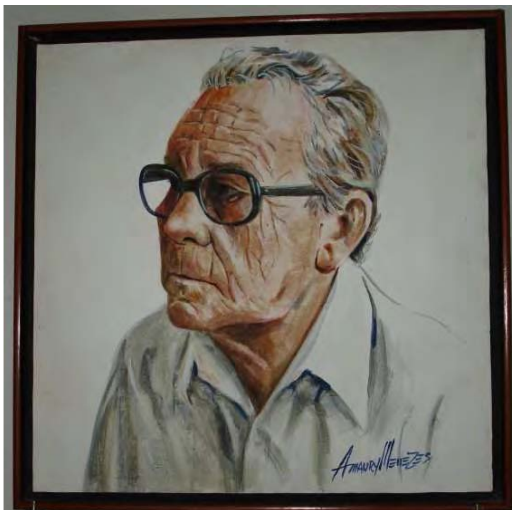
Foto 1 - Poster de Carmo Bernades, afixado na sala de visita de sua casa em Goiânia - GO.