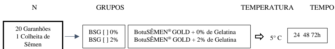
FIGURA 2. Organograma do processamento das amostras no experimento II. O sêmen colhido foi dividido em dois grupos: BSG[ ]0% e BSG[ ]2% BotuSÊMEN® GOLD (Botupharma Ltda., Botucatu, SP, Brasil) com adição de 0 e 2% de gelatina. As amostras foram armazenadas a 5°C, e avaliadas nos momentos 24, 48 e 72 horas de armazenamento.