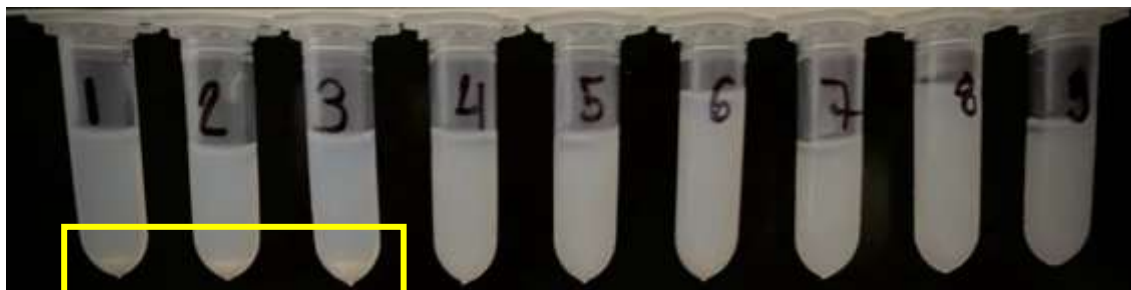
FIGURA 3. Fotografia demonstrando a precipitação espermática (pellet) nos tubos 1,2 e 3, que apresentam 0% de gelatina, ao lado os demais grupos com ausência do pellet (grupos com 1 ou 2% de gelatina). 1-BS[ ]0%, 2-BSS[ ]0%, 3-BSG[ ]0%, 4-BS[ ]1%, 5-BSS[ ]1%, 6-BSG[ ]1%, 7-BS[ ]2%, 8-BSS[ ]2%, 9- BSG[ ]2%.

A adição de 1% ou 2% de gelatina, aos meios de refrigeração de sêmen, foi eficaz em mudar o estado físico, de líquido para sólido, do material armazenado durante a refrigeração independente das temperaturas utilizadas, 5°C ou 15°C, sendo totalmente revertido, após o aquecimento a 37°C até 10 minutos. No entanto, na concentração de 1% a liquefação do meio ocorreu mais rápido do que a 2%.