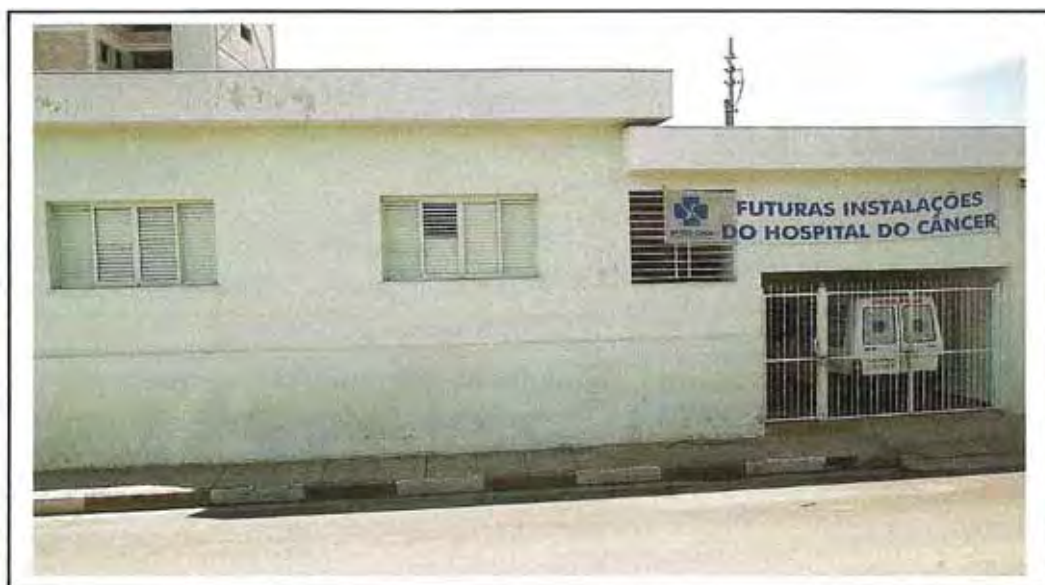
Primeira sede do GAOPr Rua Jose Mechioratto, 216 Período: 04/12/2001 a 21/08/2002