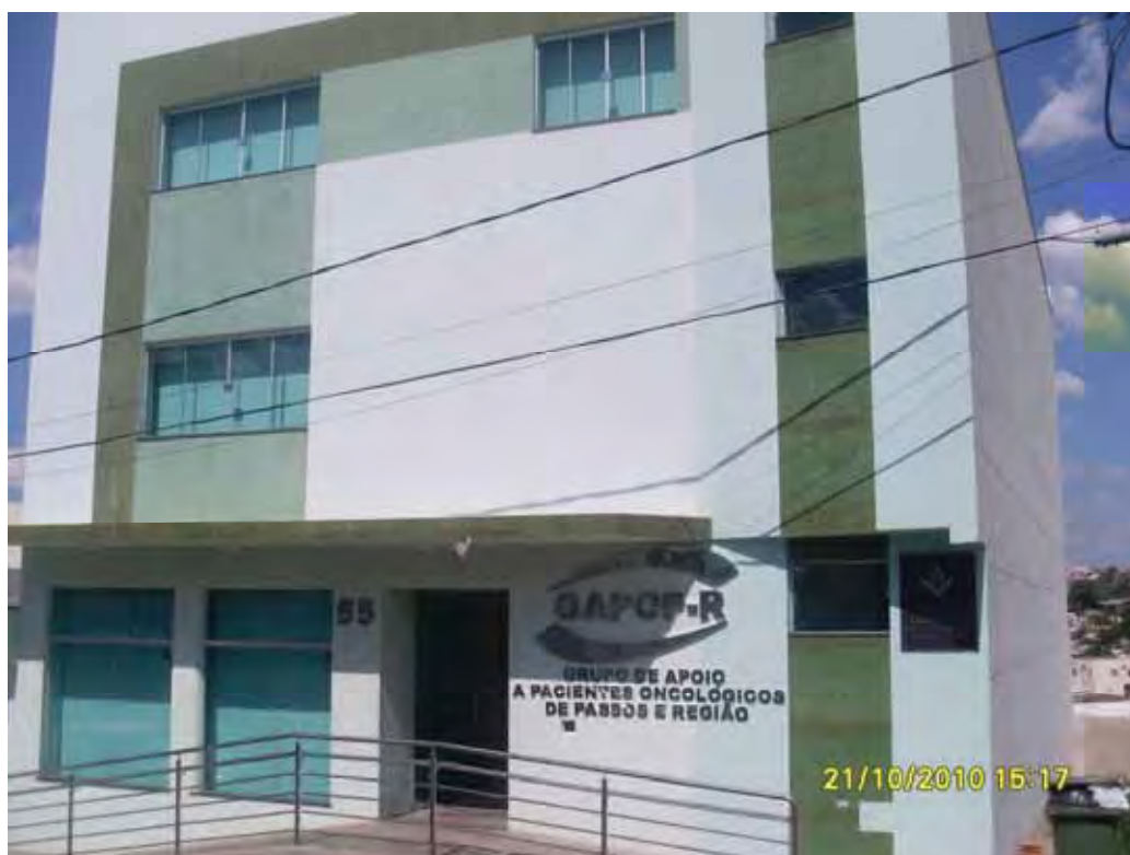
Sede própria do GAPOP Rua: Boa Vista, 55 Período desde setembro/2008