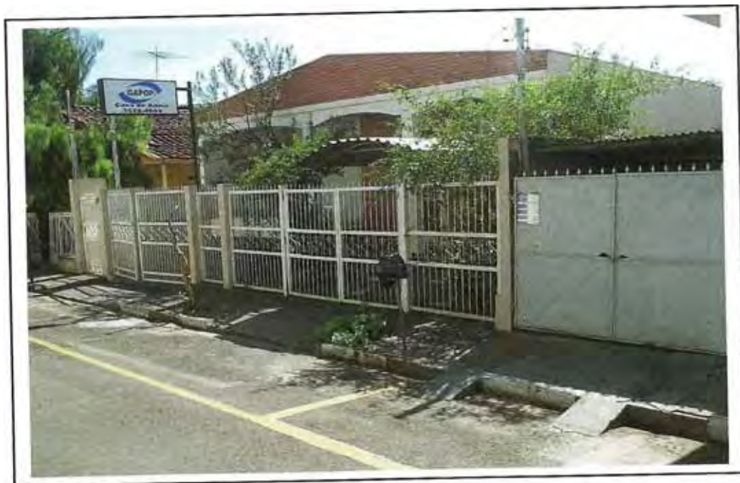
Terceira sede do GAPOP Rua Boa Vista, 39 Período: 23/09/2004 a Setembro/2008