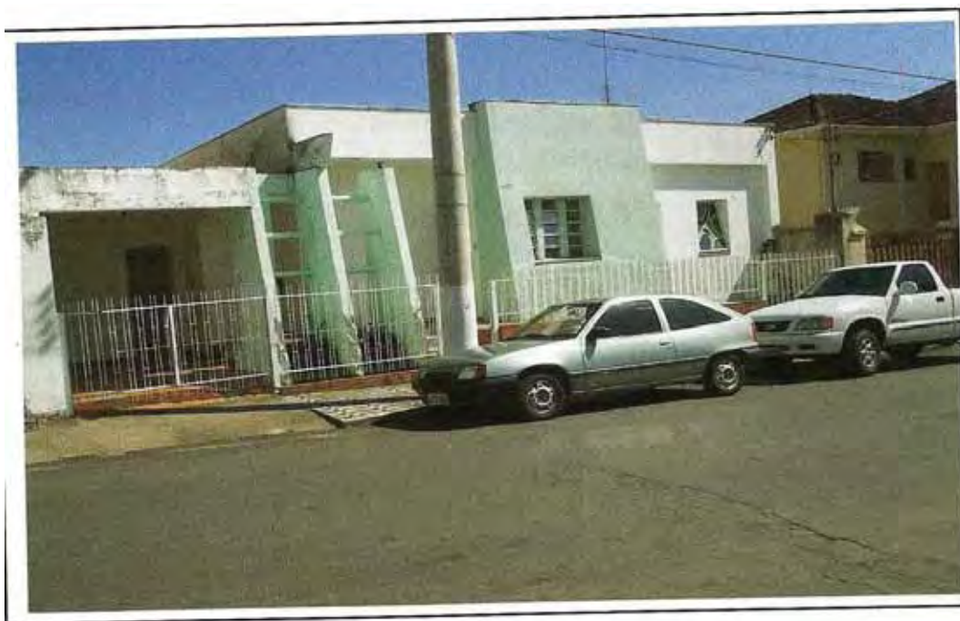
Segunda sede do GAOPr Rua Jose Mechioratto, 421 Período: 21/08/2002 a 23/09/2004