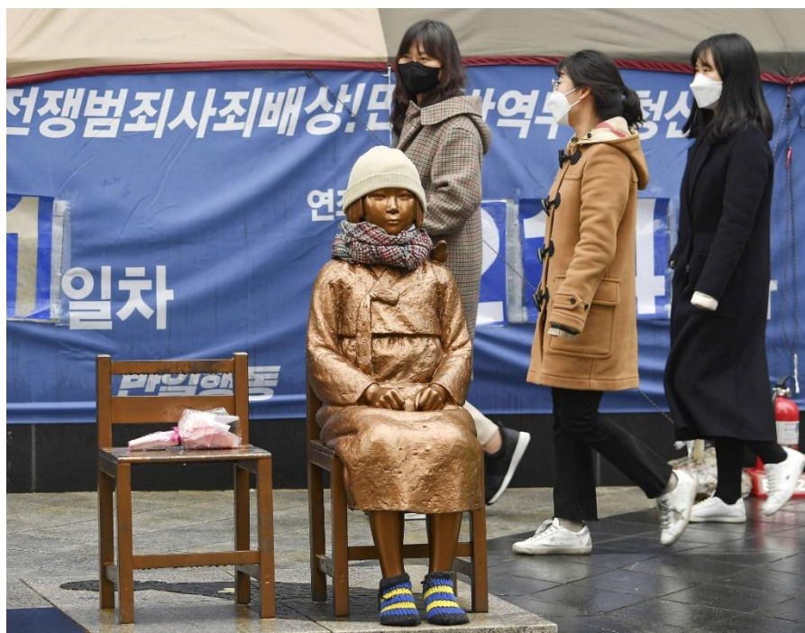
Figura 4 – Estátua em Seul, Coreia do Sul, simbolizando as “mulheres de conforto”.