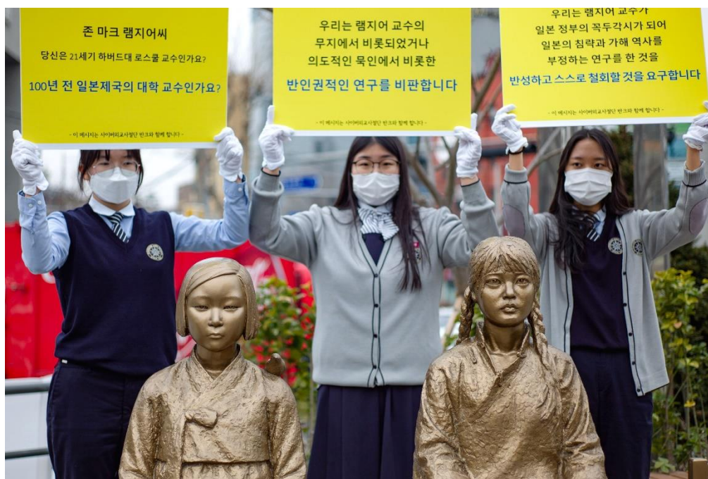
Figura 5 – Jovens sul-coreanas protestando em Seul, em frente às estátuas de “mulheres de conforto”.

Por exemplo, em janeiro de 2010, eles realizaram uma campanha em rede para coletar assinaturas e, assim, endossar a apresentação de uma petição para resolver a questão na Assembleia do Japão. Isso começou na Coreia do Sul e no Japão e se espalhou para países como Estados Unidos, Alemanha, Canadá, Tailândia e Polônia. Depois de coletar mais de 610.000 assinaturas, a petição foi enviada em 25 de novembro de 2011, dia internacional pela eliminação da violência contra as mulheres (CONSEJO COREANO, 2013, apud. ÁLVAREZ, 2016, p. 102, tradução nossa) 70 .