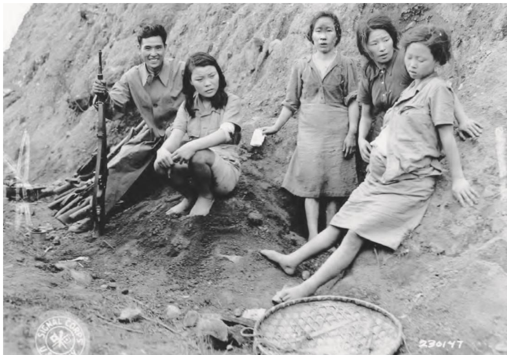
Figura 3 – Quatro “mulheres de conforto” encontradas pelas forças aliadas em Songshan, na província de Yunnan, China, no dia 7 de setembro de 1944.