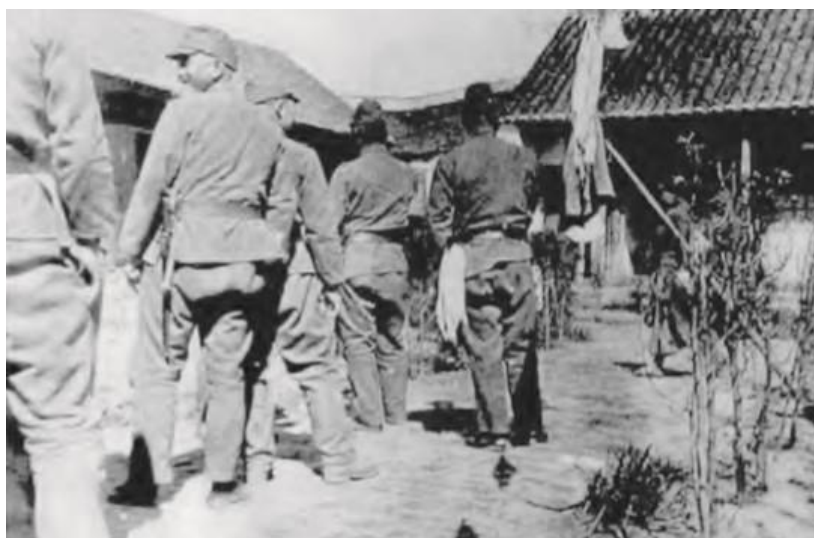
Figura 2 – Soldados japoneses esperando em fila em uma estação de conforto.