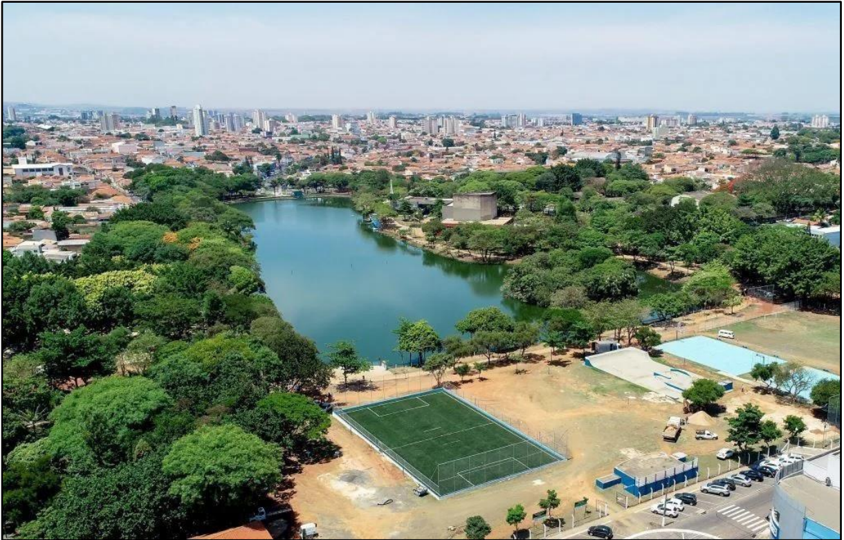
Figura 1 – Fotografia aérea do Parque Lago Azul