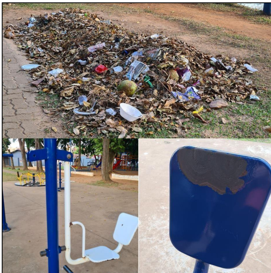
Figura 7 - Infraestrutura Parque Lago Azul

É notório a falta de manutenção na infraestrutura do parque. Os equipamentos das academias ao ar livre encontram-se em más condições de uso. Alguns estão totalmente quebrados, outros apenas estão tomados pela ferrugem, mas ambos demonstram o abandono e a degradação do local. Pichações, pilhas de lixos, falta de pintura, irregularidades no piso, bancos, mesas e brinquedos quebrados e até mesmo alguns espaços abandonados colaboram para uma percepção depreciativa e negativa do ambiente (Figura 7).