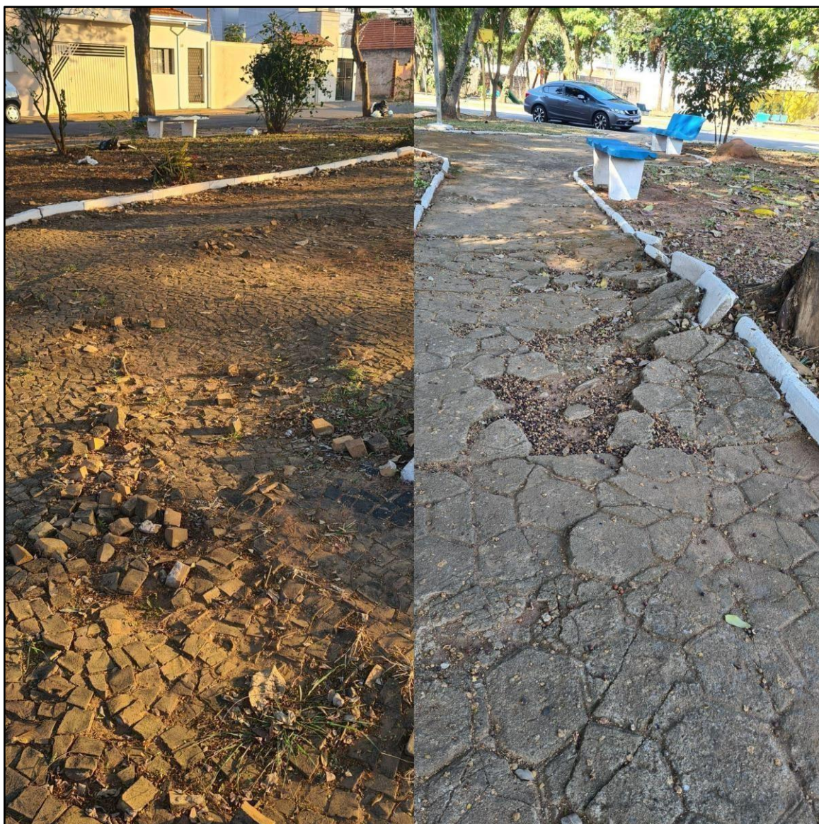
Figura 3 - Praça Ruy Ladislau e Praça Prof. Dr. João Dias da Silva