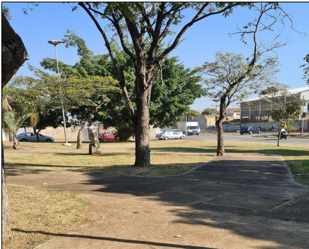
Figura 4 - Praça localizada na Av. Presidente Tancredo de Almeida Neves

degradação e o uso indevido desses ambientes, empregados como ponto de criminalidade.