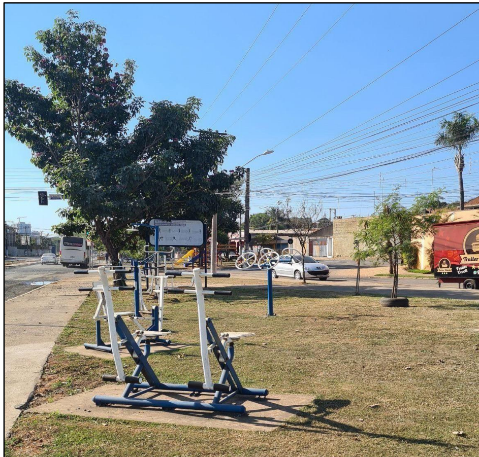
Figura 5 - Praça Aderval Gonçalves