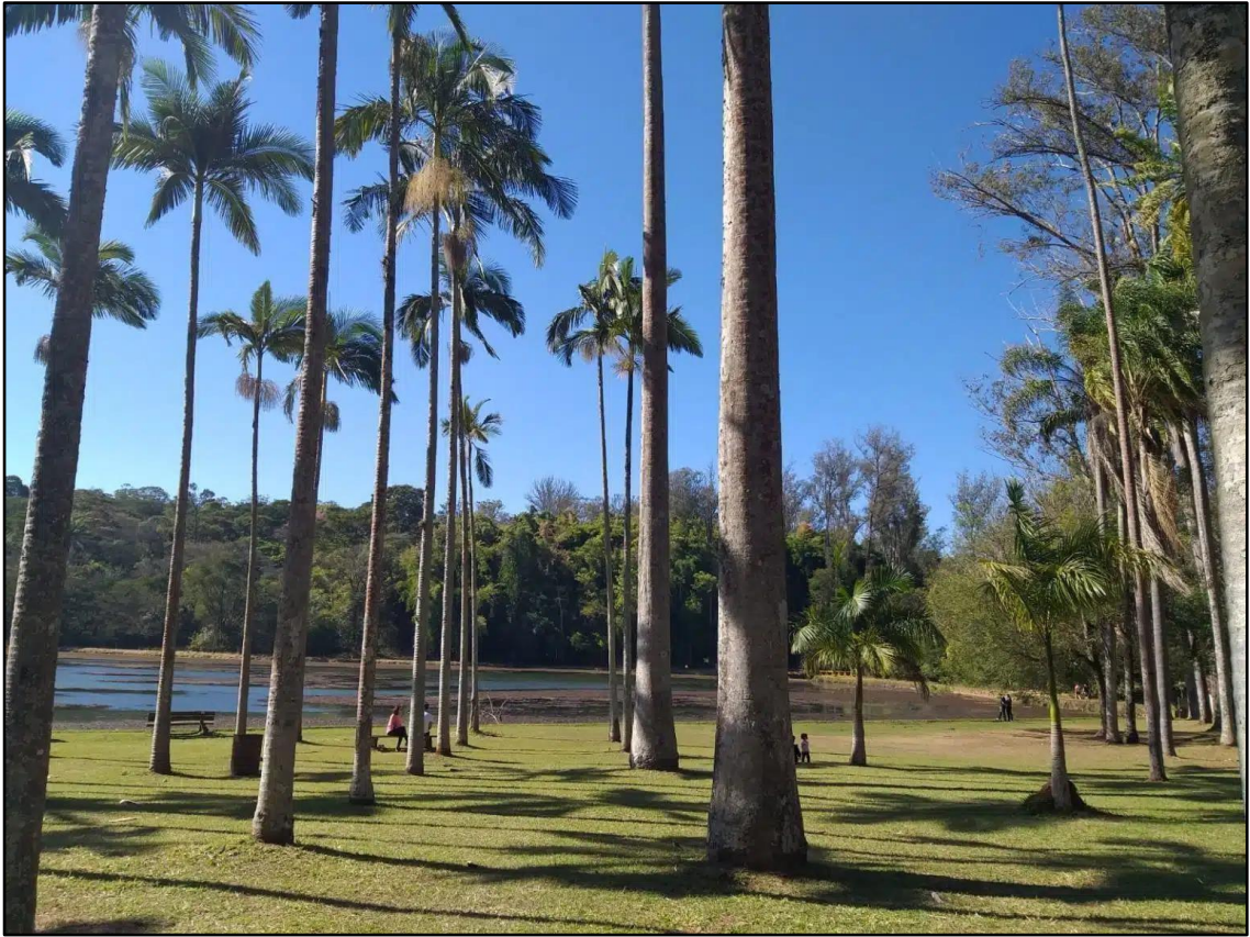
Figura 8 - Floresta Estadual Edmundo Navarro de Andrade