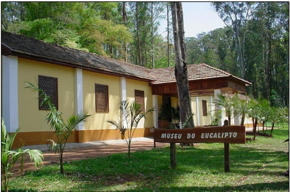
Figura 9 - Museu do Eucalipto