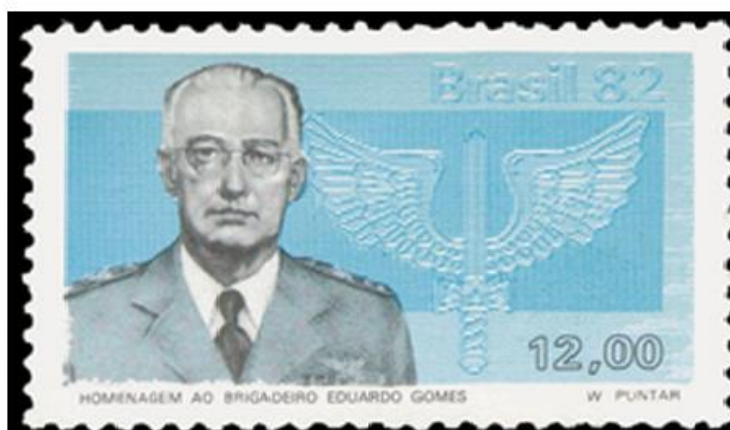
Figura 11 — Selo em homenagem ao brigadeiro Eduardo Gomes, de 1982.

Outra homenagem a Eduardo Gomes ocorreu em 1982, por meio de sua imagem estampada em um selo emitido pelos Correios. Abaixo podemos observar o tributo que essa instituição realizou ao Brigadeiro. Na figura podemos verificar que além da foto de Eduardo Gomes, o símbolo da Aeronáutica e a cor azul aparecem. O azul provavelmente representa o céu, onde os aviões da FAB sobrevoam.