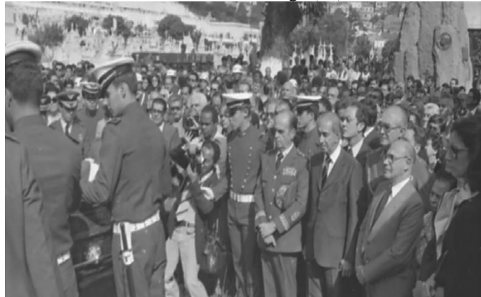
Figura 1 — Sepultamento de Eduardo Gomes na Cripta dos Aviadores, em 1981, no Cemitério São João Batista, no bairro de Botafogo (RJ).