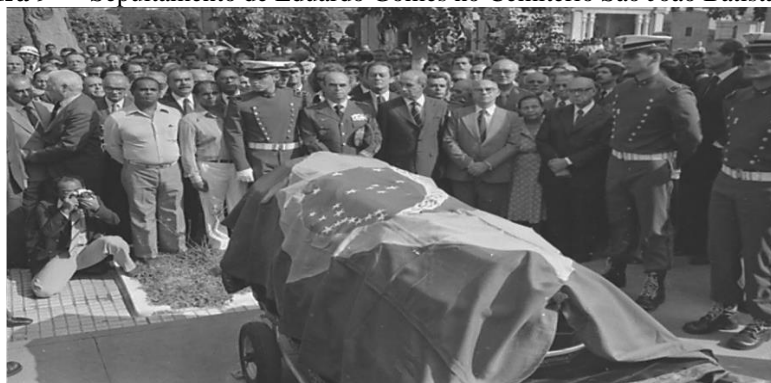
Figura 9 — Sepultamento de Eduardo Gomes no Cemitério São João Batista (RJ).