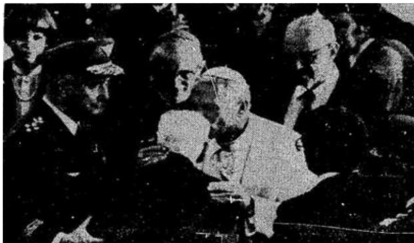
Figura 6 — Encontro de Eduardo Gomes com o Papa João Paulo II, no dia 01 de julho de 1980, na Base Aérea do Galeão (RJ).

pegava o talão de cheques e dividia o valor recebido em várias folhas retiradas do talonário; depois, colocava-as em envelopes com os endereços a serem encaminhados, para auxiliar os que mais precisavam de ajuda.