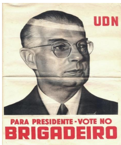
Figura 4 — Santinho de Eduardo Gomes, pelo partido da UDN, usado na campanha presidencial de 1945