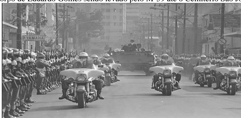
Figura 8 — Corpo de Eduardo Gomes sendo levado pelo M-59 até o Cemitério São João Batista (RJ).