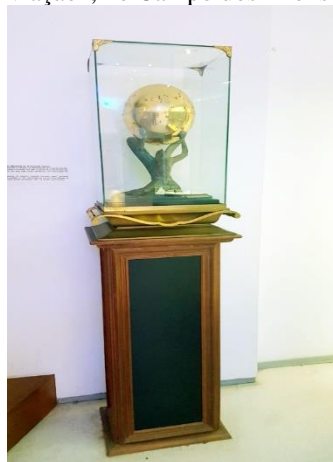
Figura 2 — Escrínio que contém o coração de Eduardo Gomes, situado no Museu Aeroespacial, na sala “Primórdios da Aviação”, no Campo dos Afonsos, Rio de Janeiro.

Além disso, o Museu Aeroespacial (MUSAL), localizado no Campo dos Afonsos, no Rio de Janeiro, contém, na sala “Primórdios da Aviação”, uma escultura de bronze que representa a figura mitológica de Ícaro 12 , sobre uma base retangular de granito, a qual sustenta uma esfera em metal dourado no interior da qual está o coração de Eduardo Gomes, conservado em líquido químico apropriado. A escultura fica dentro de uma vitrine de cristal transparente, sobre uma coluna de jacarandá. 13