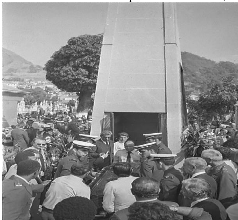
Figura 10 — Entrada do corpo de Eduardo Gomes na Cripta dos Aviadores, no Cemitério São João Batista (RJ).