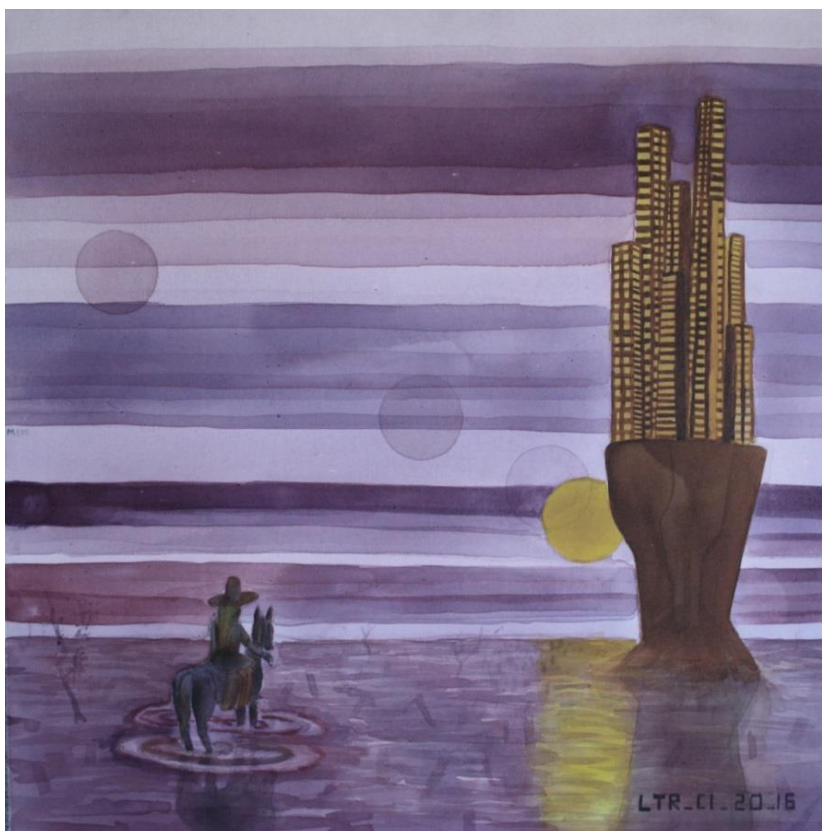
Figura 3: Irene