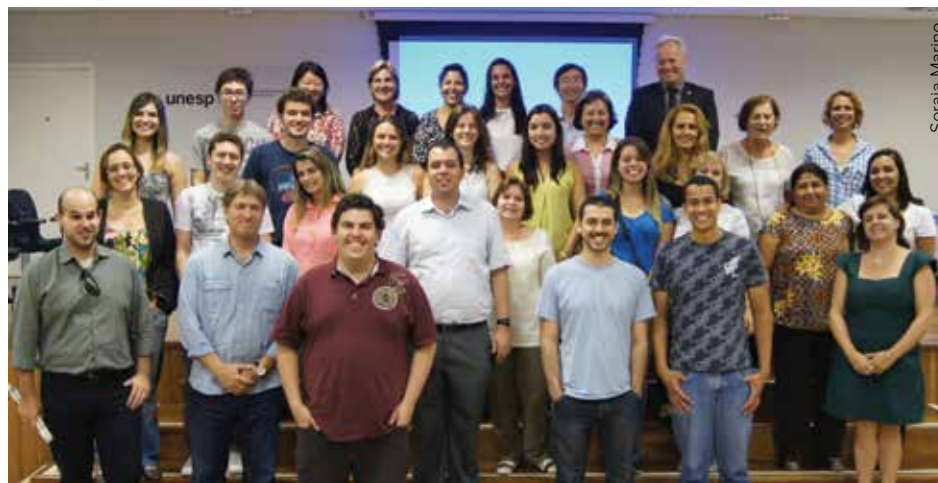
Profissionais envolvidos no programa Redefor Educação Especial e Inclusiva

Entre os conceitos que serão abordados estão a necessidade de o cursista aprender e vivenciar normas e regras que existem para o uso da Internet, reconhecer habilidades que já possui e iniciar o desenvolvimento de outras como estabelecer prioridades e uma parceria com o tutor, desenvolver autonomia para o estudo e conhecer o potencial das tecnologias digitais. Além disso, o aluno de um curso a distância deve aprender a administrar o tempo, que funciona de forma diferenciada dos modelos presenciais.