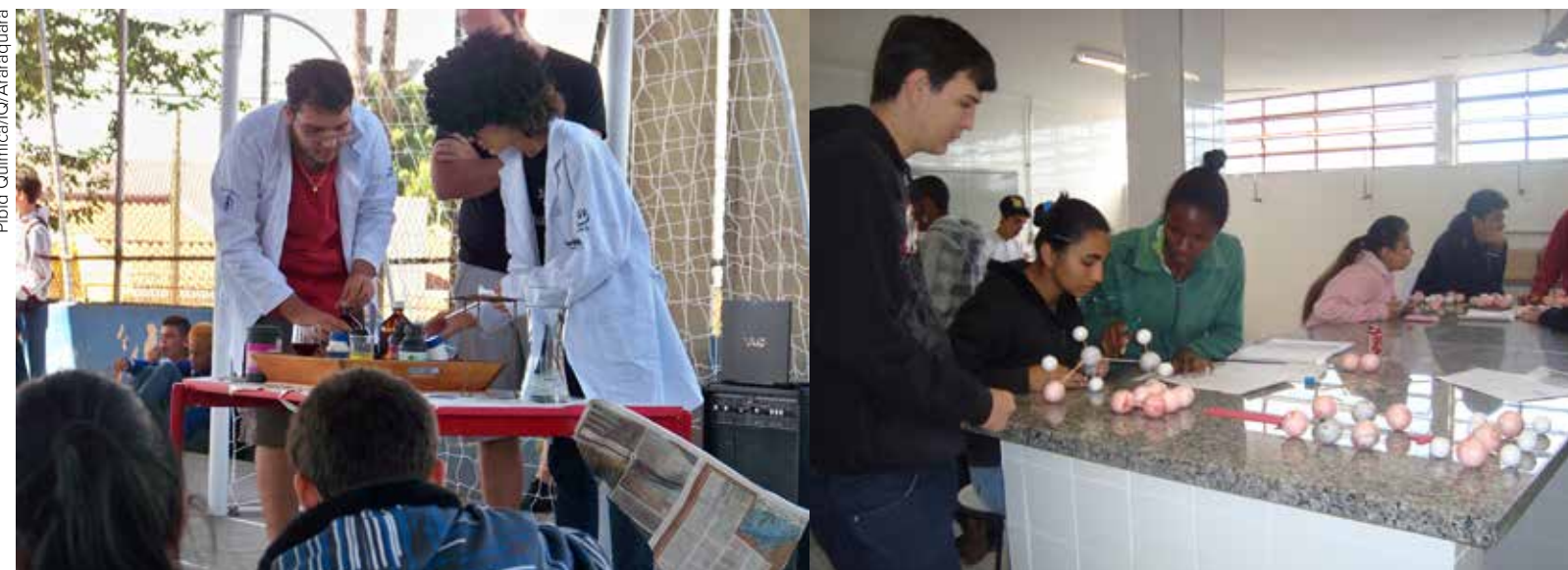
Gincana organizada pelo grupo do Pibid do Instituto de Química da Unesp de Araraquara

PROJETO ATUA EM ESCOLAS PÚBLICAS E MUDA REALIDADE EDUCACIONAL