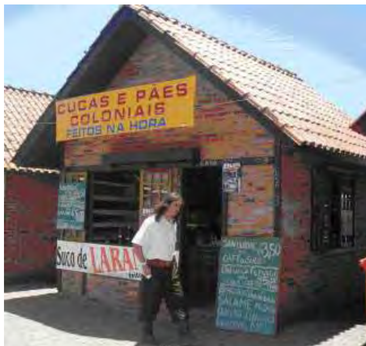
Figura 8 – Barraca de comidas típicas do Rio Grande do Sul