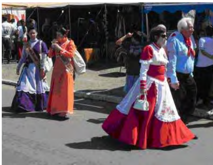
Figura 10 – A pilcha. Roupas típicas gaúchas e as prendas ao fundo

Assim como as novas gerações são ensinadas a usar a pilcha, são ensinadas a cultuar um passado idealizado de um gaúcho que viveu no campo, em harmonia e as meninas são estimuladas a representarem o papel de prenda : a "mulher gaúcha", que deve ser um espelho de dignidade.