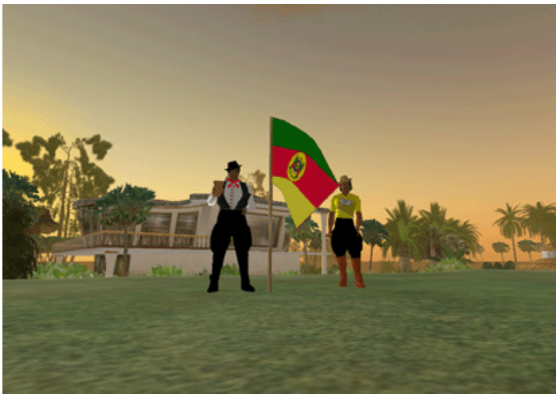
Figura 21 – Bandeira do RS fincada nas terras da Ilha Brasil Porto Alegre no Second Life