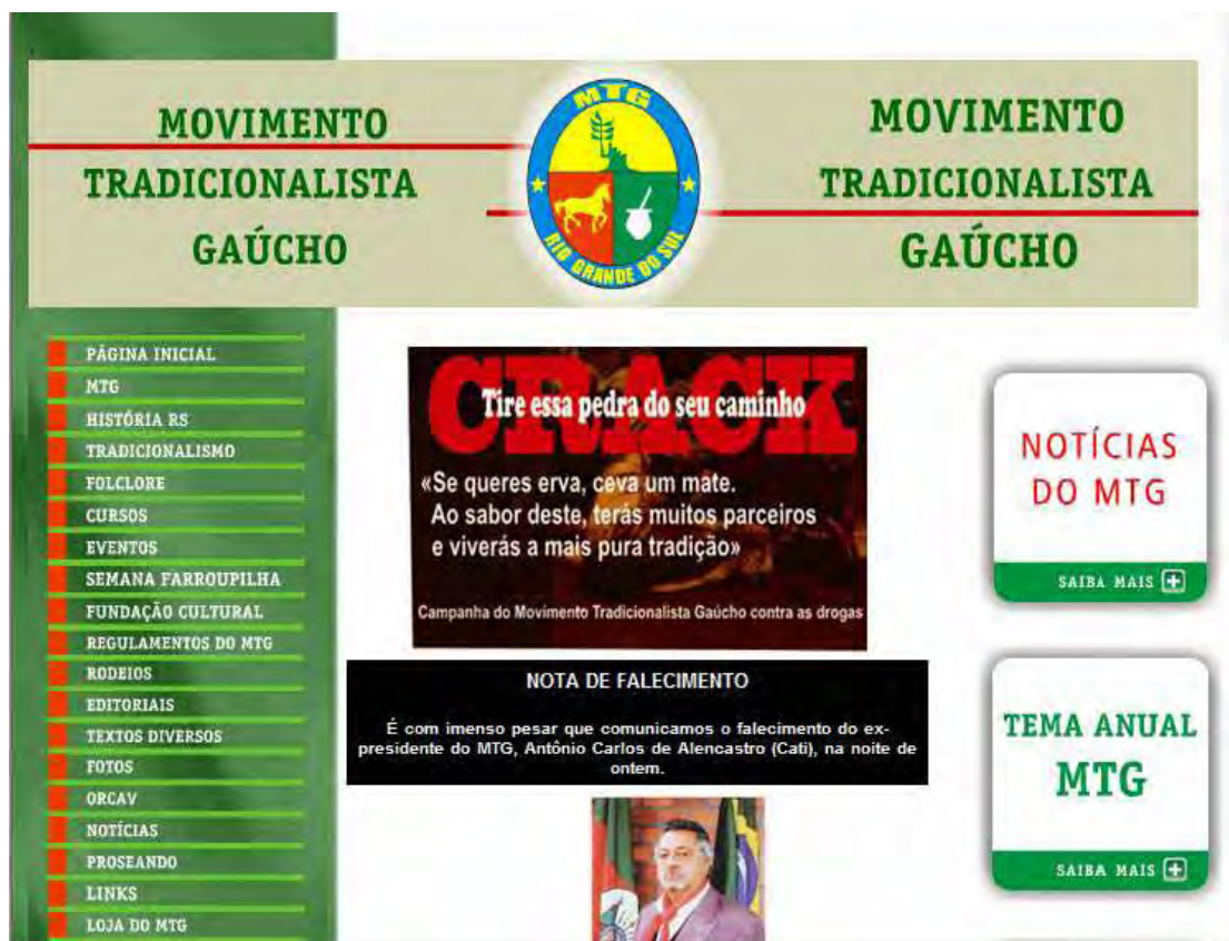
Figura 27 – Website do Movimento Tradicionalista Gaúcho Fonte: http://www.mtg.org.br . Acesso em 06 de setembro de 2009

Objetivando a preservação, o resgate e o desenvolvimento da cultura gaúcha, website do MTG contempla informações sobre o Movimento Tradicionalista Gaúcho e sua estrutura administrativa, funcional e de congregação dos Centros de Tradições Gaúchas e entidades a fins, objetivando preservar o núcleo da formação gaúcha, cuja filosofia decorre da Carta de Princípios do MTG. Divulgam ainda, informações sobre a história do Rio Grande do Sul com destaque as bandeiras, ao hino, o brasão das armas, as missões jesuítas, as imigrações e as revoluções entre outras, textos relacionados ao Tradicionalismo, editoriais, notícias, artigos, poesias, prosas, causos e um blog de comunicação entre os atores. Relata ainda, a Fundação Cultural