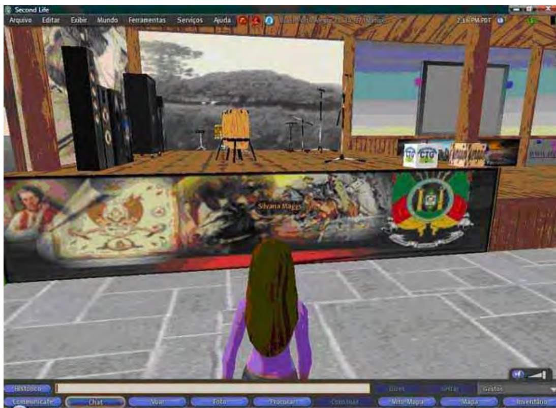
Figura 22 – Avatar observando o palco do CGT Virtual Estância Celeste Brasil

Neste CTG Virtual ocorre a divulgação e compartilhamento da tradição gaúcha por meio da interação dos usuários: o indivíduo cria uma personagem (avatar) e visita ambientes produzidos por outros usuários, podendo assim, conviver com pessoas de qualquer parte do mundo. Desta forma, as expressões da cultura gaúcha são divulgadas aos mais diversos pontos do planeta.