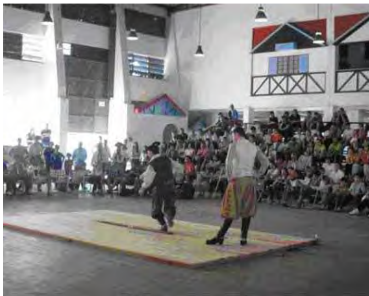
Figura 12 – Apresentação de chula