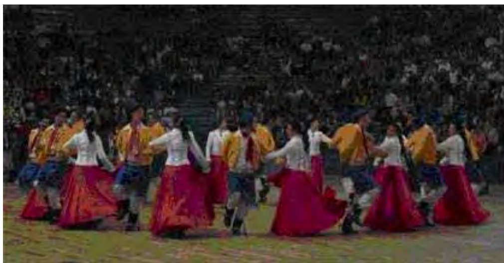
Figura 13 – Apresentação de dança modalidade tradicional