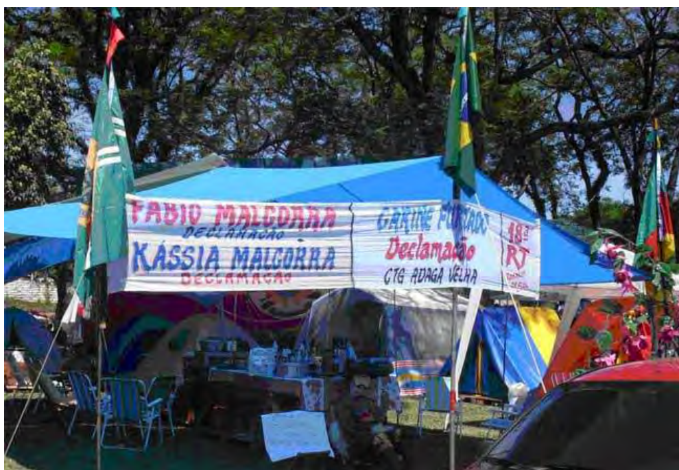
Figura 5 – Acampamento do CTG Adaga Velha