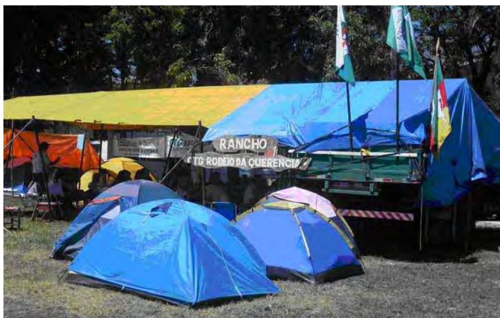
Figura 6 – Acampamento do CTG Rodeio da Querência