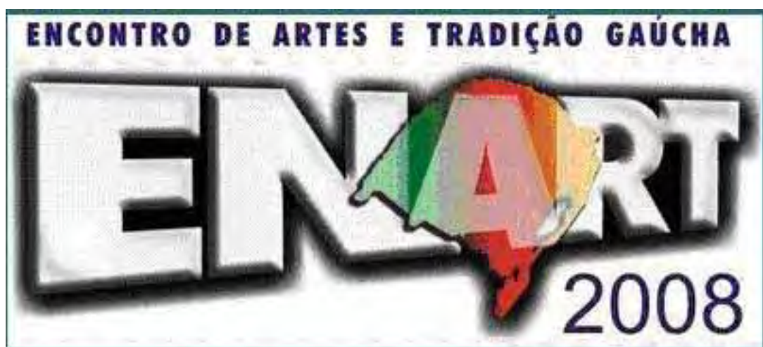
Figura 3 – Logotipo do ENART 2008

As imagens que serão apresentadas neste capítulo foram obtidas durante o evento, não serão analisadas e possuem caráter ilustrativo.