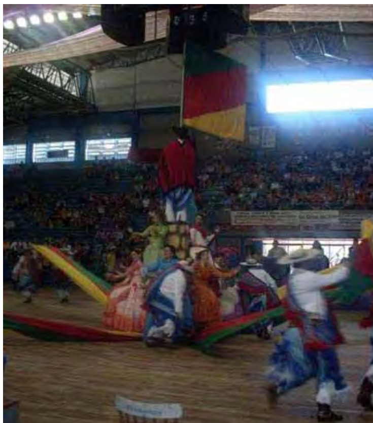
Figura 14 – Apresentação de dança estilo livre

Pode-se identificar nos depoimentos apresentados um discurso extremamente positivo das atividades tradicionalistas. Não há defeitos e nem problemas evidenciados em seus relatos e percebe-se que suas afirmações defendem todas as práticas vivenciadas sob a justificativa da cultura e tradição gaúcha. Não são questionados os símbolos e nem atividades. É um discurso que exalta somente as qualidades do povo gaúcho e que procura colocar o Tradicionalismo numa condição de guia para condutas sociais na convivência no CTG.