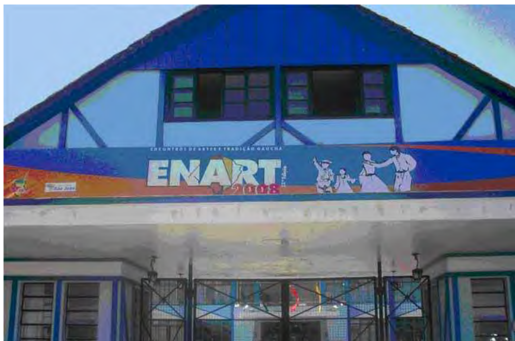
Figura 4 – Entrada do Parque da Oktoberfest em Santa Cruz do Sul

Na fase final do ENART, pode-se afirmar que muitos dos frequentadores do evento é composta por integrantes de CTG que deslocam-se em caravanas para Santa Cruz do Sul e permanecem acampados no Parque da Oktoberfest, com a finalidade de prestigiar os competidores do seu CTG que estão entre os finalistas do evento.