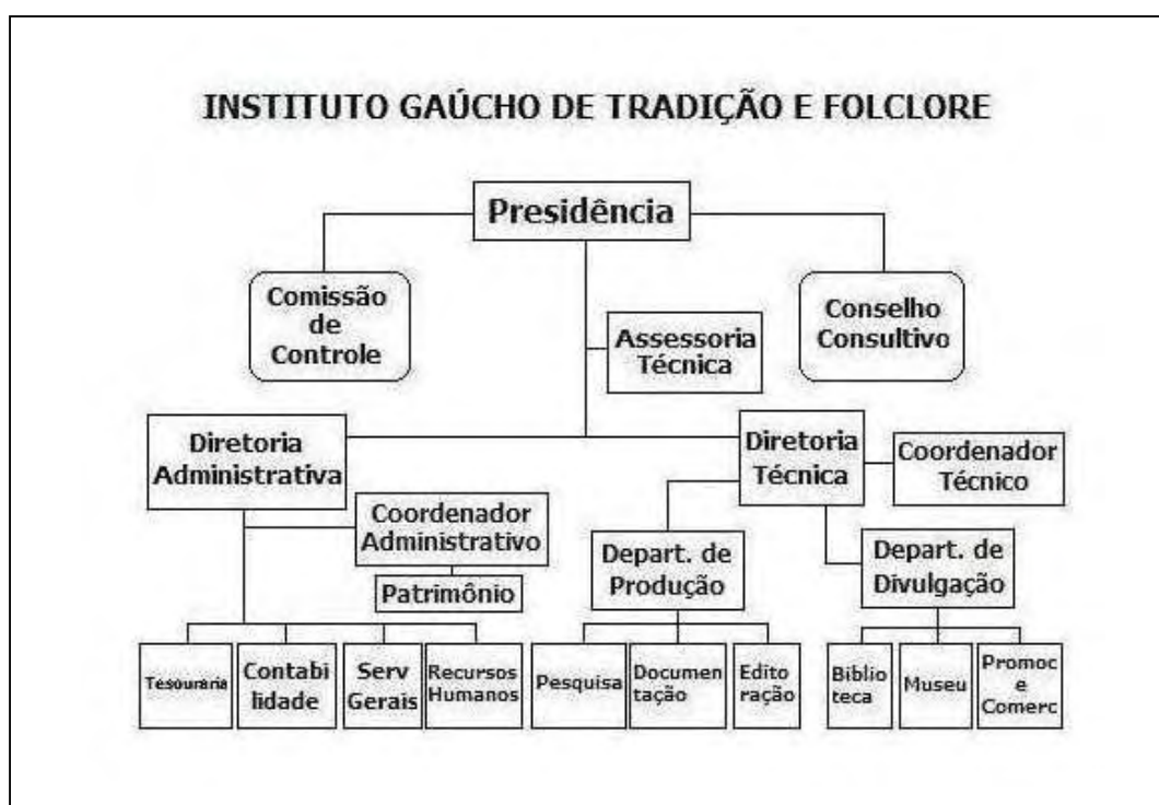
Figura 2 – Organograma do IGTF