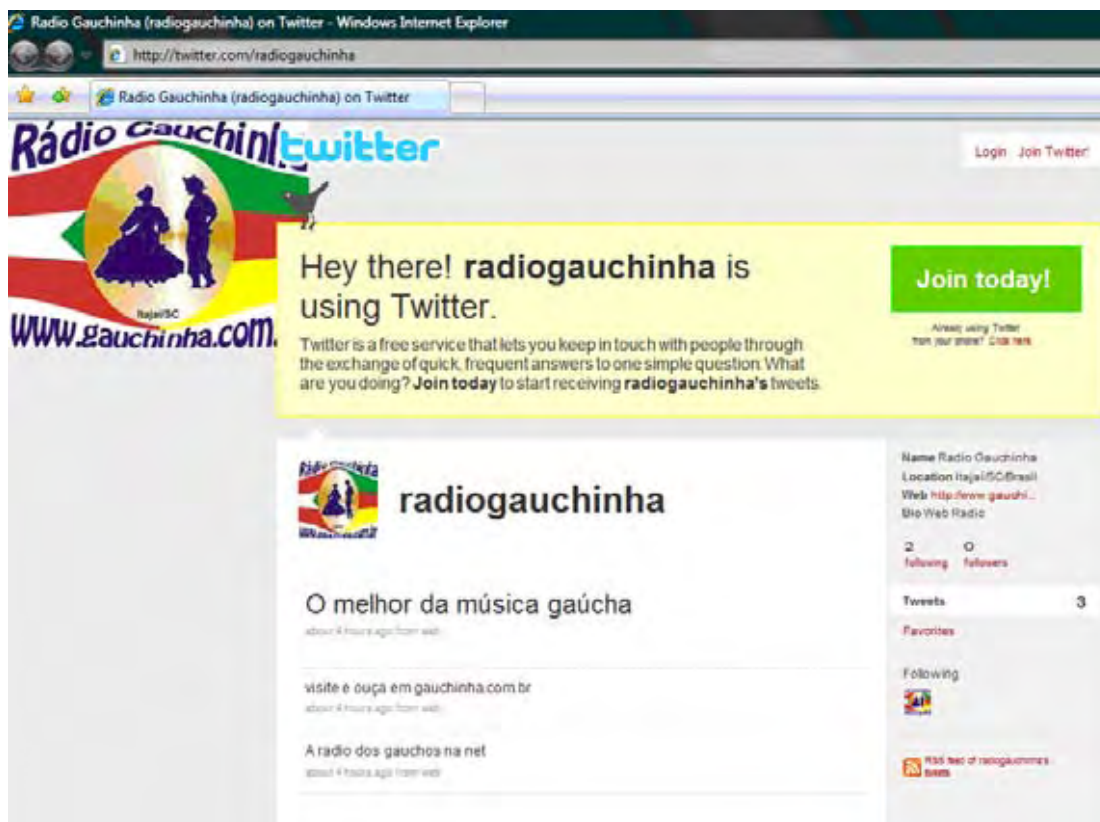
Figura 18 – Twitter da Radio Gauchinha

postagem, como um comentário de blog ), a direct message (mensagem direta e particular) e o retweet (republicação de uma postagem). A Fig. 18 apresenta o Twitter da Radio Gauchinha, que divulga notícias sobre músicas típicas gaúcha.