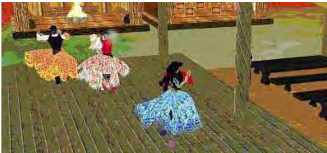
Figura 25 – Baile no CTG virtual