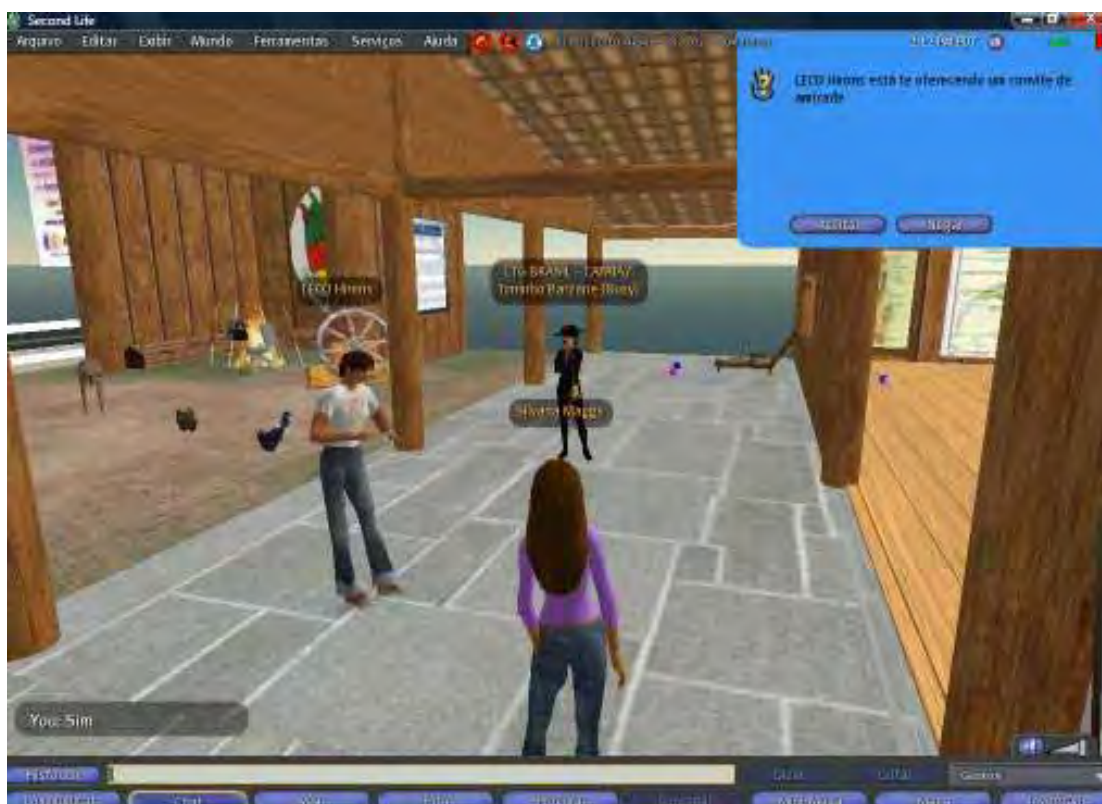
Figura 23 – Avatares conversando com o capataz Toninho Barzane