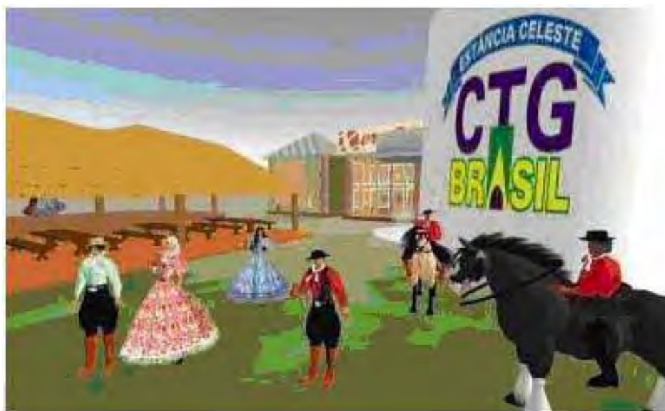
Figura 24 – Espaço para celebrar a tradição gaúcha