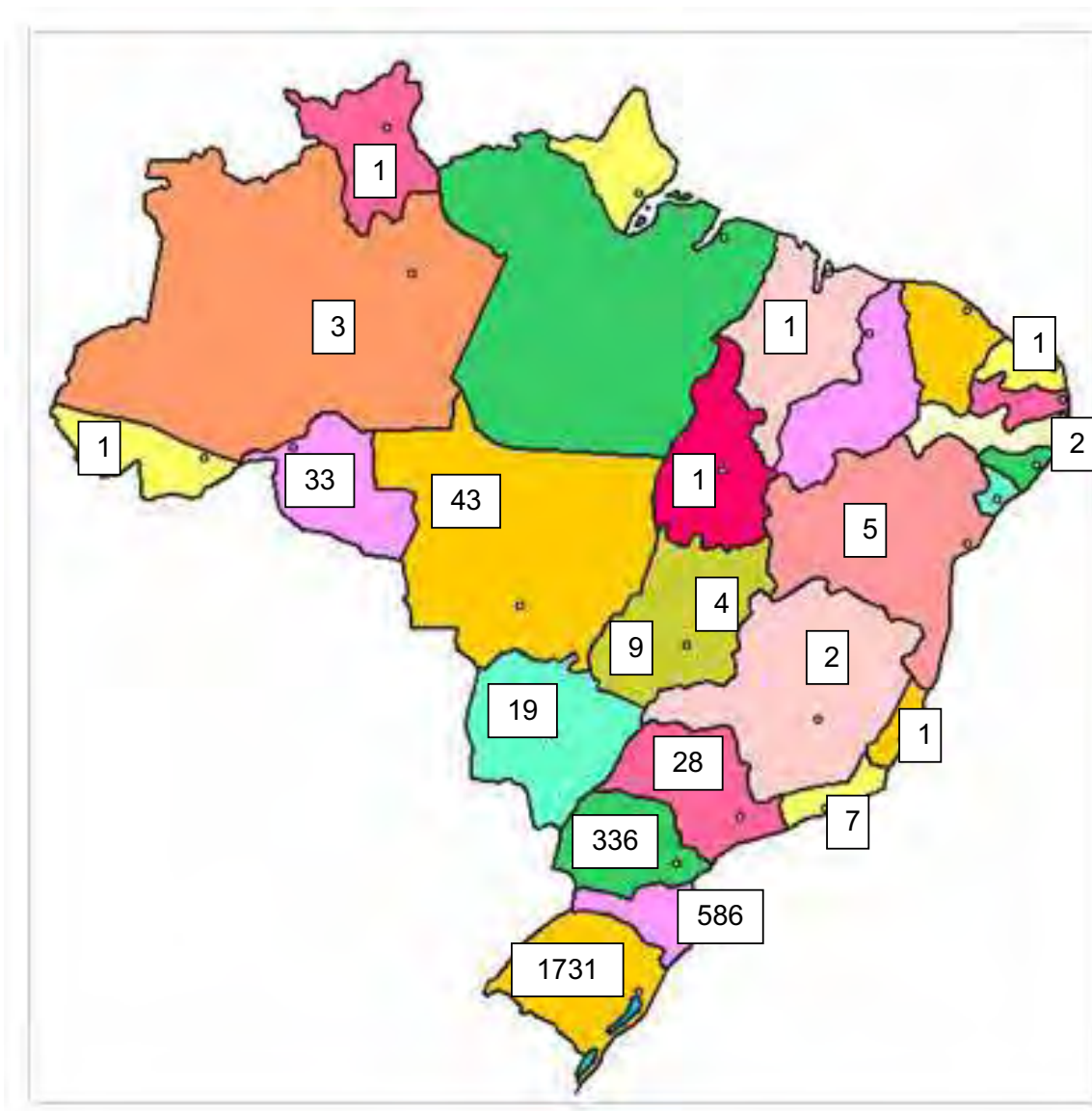
Figura 1 – CTG distribuídos pelo Brasil 4

Adaptado de CBTG, disponível em http://www.cbtg.com.br/sitio/ctgs/mapa.php