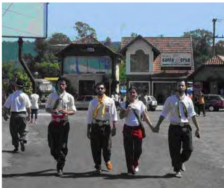
Figura 11 – Jovens trajando bombacha

A ludicidade é um recurso utilizado pelos CTG e pelo Movimento Tradicionalista de modo geral, como uma alternativa de transmitir as tradições – que também são passadas oralmente de geração a geração, bem como, por meio dos rituais diários de convivência – num momento histórico e social no qual observa-se uma estrutura cultural, política e econômica que impõe valores, posições e conceitos a maioria da população. É um processo de transmissão centrado na ludicidade, com um universo complexo de significados que abrange o imaginário dos sujeitos envolvidos no processo de aprendizagem da tradição, desenvolvendo o pensamento, a linguagem e o sentido de identidade coletiva desses sujeitos.