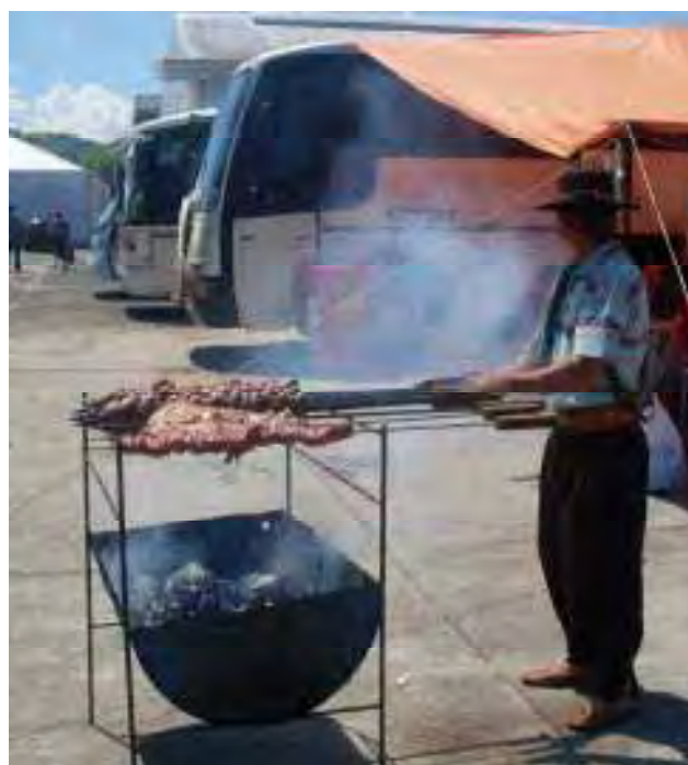
Figura 9 – Churrasco no acampamento