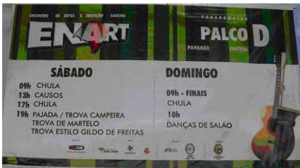
Figura 7 – Banner com a programação do evento para o palco D

arrecadam fundos para manter as atividades do Movimento Tradicionalista por todo Brasil.