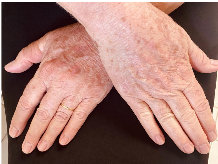
Mãos da senhora Mary Neide.

Realizadas em Arapongas (PR) nos dias 24 de junho de 2021 e 17 de agosto de 2021.