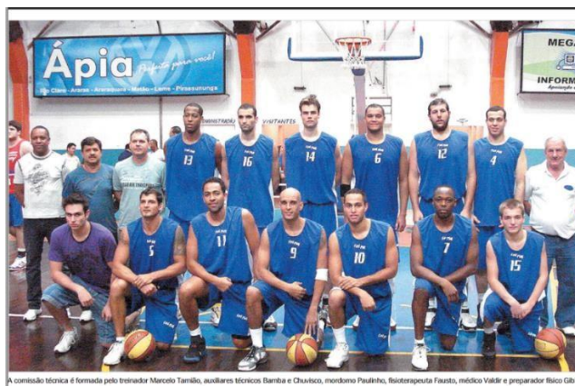
Figura 16 - Equipe de basquetebol apoiada pelo Rio Claro FC na temporada de 2009