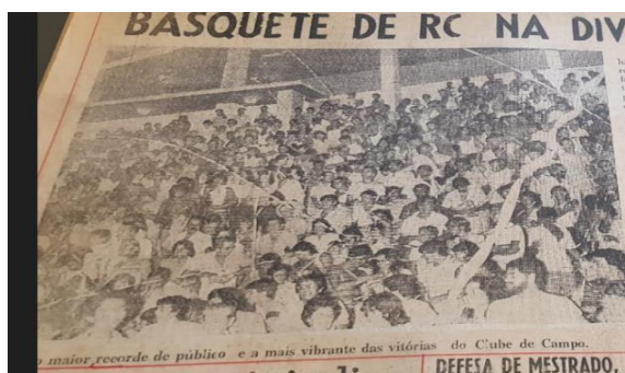
Figura 3 - Ginásio de Esportes Felipe Karam com recorde de público no jogo que garantiu o acesso da equipe rio-clarense à Divisão Especial Paulista