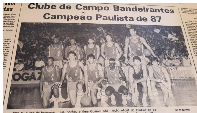
Figura 5 - Equipe do Clube de Campo em seu primeiro título conquistado na Divisão Especial Paulista

seleção brasileira, rompe com o Clube de Campo e acerta um contrato milionário com o E.C. Sírio (SURPRESA... 1988, p.8).