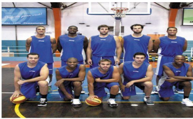
Figura 17 - Jogadores apresentados para o basquetebol adulto de Rio Claro na temporada de 2010