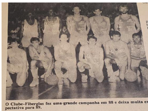
Figura 6 - Elenco do Clube-Fiberglas nas temporadas de 1988-1990

Ipê de Jales, por obrigatoriedade, caso contrário seria excluído de participar futuramente do Campeonato Paulista e da Taça Brasil (CLUBE... 1990, p.8).