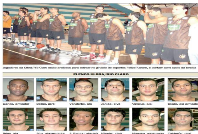
Figura 15 - Elenco apresentado pela Ulbra/Bandeirantes Rio Claro para 2008-2009