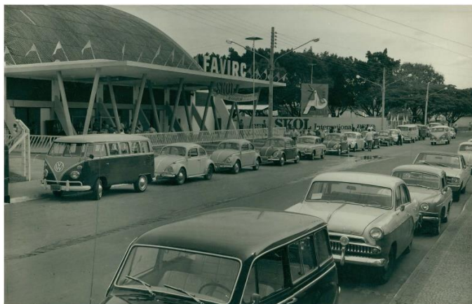
Figura 1 - Ginásio Municipal de Esportes no ano de 1970, alguns anos mais tarde nomeado como Ginásio Municipal de Esportes Felipe Karam

Os clubes locais e a seleção da Cidade obtiveram títulos em Jogos Regionais, Jogos Abertos, Campeonatos Paulistas, Campeonatos Brasileiros, Campeão da Copa das Américas, Vice-Campeão Sul-Americano, dentre outros, e a equipe passou por grandes momentos de sucesso no esporte nas décadas de 1980 e 1990, com bons patrocínios captados como os da Companhia Energética de São Paulo (CESP), da Blue Life e da Polti Vaporetto (GNECCO; VALDANHA NETO, 2005, p. 55-56). Os anos 2000 não foram favoráveis à equipe no que se refere a títulos em vitórias esportivas, ocorrendo tanto longos períodos sem patrocínio até com atividades encerradas, como períodos de disputas de playoffs com equipes da elite do campeonato nacional brasileiro, agora conhecido como Novo Basquete Brasil (NBB), a Liga Nacional de Basquete.