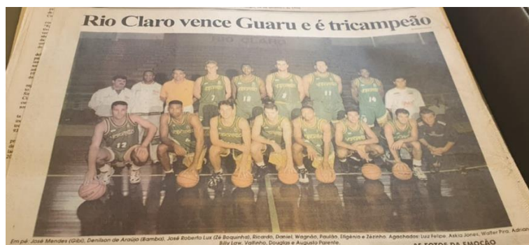
Figura 12 - Conquista do quarto título e o terceiro consecutivo do Campeonato Paulista da Divisão Especial para Rio Claro, representando pela equipe do Polti Vaporetto/ Rio Claro