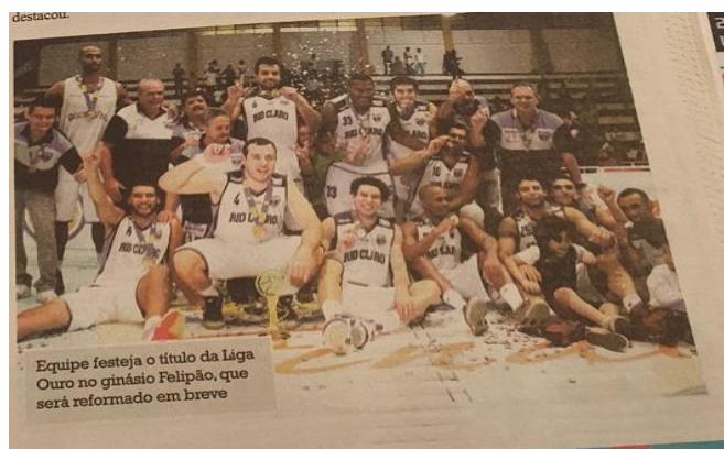
Figura 18 - Equipe Campeã da Liga Ouro em 2014, que conquistou vaga para disputar o NBB, Campeonato que substitui o antigo Campeonato Brasileiro da Liga Nacional