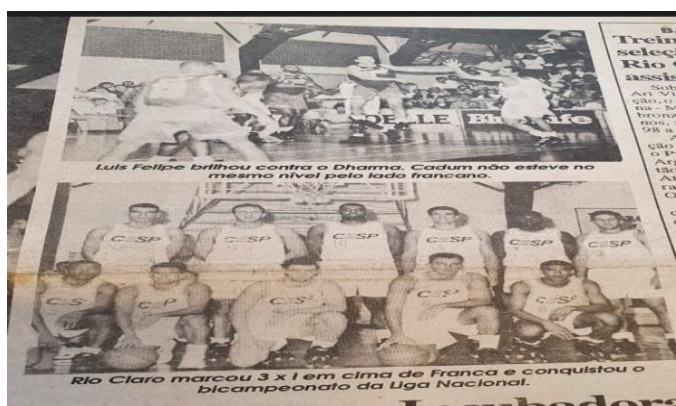
Figura 10 - Elenco da CESP/Blue Life Rio Claro que conquistou o bicampeonato Nacional em 1995