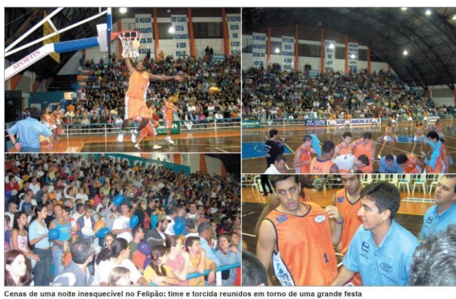
Cenas de uma noite inesquecível no Felipão: time e torcida reunidos em torno de uma grande festa

Figura 14 - Imagens da noite que marcou o retorno da equipe de basquetebol adulto de Rio Claro representado pela ABCD Bandeirantes/Rio Claro, em partida que também comemorou a renovação do Ginásio Municipal de Esportes Felipe Karam