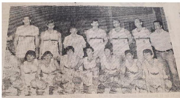
Figura 2 - Equipe do Clube de Campo Rio Claro na temporada de 1981

No ano seguinte, no mês de janeiro, num torneio de turno e retorno, é dado o prosseguimento do campeonato, marcado pelas disputas entre os campeões da primeira fase no torneio classificatório. O Clube de Campo Rio Claro é um dos disputantes, tendo atravessado a primeira fase de forma invicta, disputa a vaga pela ascensão a divisão especial, juntamente com as equipes de Pinheiros, Bancários de Marília e América de São José do Rio Preto (CLUBE... 1982d, p.8). A equipe do Clube de Campo, passa com sucesso no primeiro turno da fase final contra a equipe dos Bancários de Marília, com placar de 108 a 76 (CLUBE... 1982c, p.8), vence a partida contra o América por 82 a 80, e também a partida com o E.C. Pinheiros da capital, por 83 a 78. Acaba sofrendo uma derrota para o Pinheiros no retorno, mas em vitória contra a equipe do América, sagra-se campeão do Campeonato Paulista da primeira divisão-81, ganhando acesso à divisão especial no ano de 1982 (BASQUETE... 1982b, p.9).