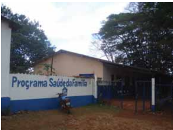
Figura 4 - Unidade PSF

Na área da saúde, conta com uma unidade do Programa de Saúde da Família (PSF) – Qualis, sendo a equipe composta por: uma médica generalista e um dentista que realizam atendimentos duas vezes por semana; esses profissionais trabalham com agendamento prévio. Compõem também a equipe uma enfermeira que comparece no PSF uma vez por semana, uma auxiliar de enfermagem e quatro agentes comunitários que trabalham de segunda a sexta-feira, das 7:00 às 14:00 horas. É importante dizer que os agentes comunitários ficam a disposição dos médicos e dentistas para auxiliá-los nos seus atendimentos. Os agentes também trabalham na recepção e na limpeza do prédio, pois a equipe sempre está desfalcada e não há profissionais designados para esta função. O prédio compreende uma casa pequena, com uma varanda que é utilizada como sala de espera, um consultório médico, uma sala odontológica, uma sala que funciona como pré- consulta uma sala para entrega de medicamentos e uma pequena cozinha onde os funcionários fazem suas refeições. Dentre os equipamentos, não há telefones e/ou computadores.