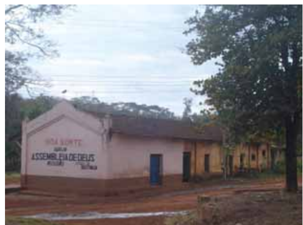
Figura 3 - Igreja Assembléia de Deus