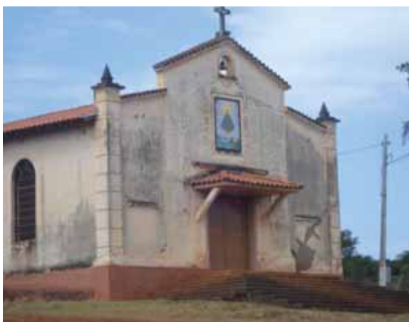
Figura 2 - Igreja Católica e Apostólica Romana

O assentamento tem duas igrejas para as práticas religiosas, uma denominada Assembléia de Deus e a outra Católica Apostólica Romana.