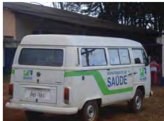
Figura 5 - Ambulância da Prefeitura de Restinga 9

A tese defendida neste trabalho é que o Estado, na sua concepção neoliberal, tem se afastado cada vez mais do seu papel de garantir atendimento na área social e tem transferido, de forma sistemática, grande parte de suas responsabilidades para a sociedade e para as famílias; estas por sua vez transferem essas atribuições para as mulheres que, historicamente, têm sido vistas como cuidadoras e responsáveis pelo bem estar da família. Todas essas responsabilidades acarretam uma sobrecarga de serviços às mulheres, que já vivem a dupla e tripla jornada de trabalho, pois trabalham fora, em casa e ainda, tem que oferecer cuidados aos familiares.