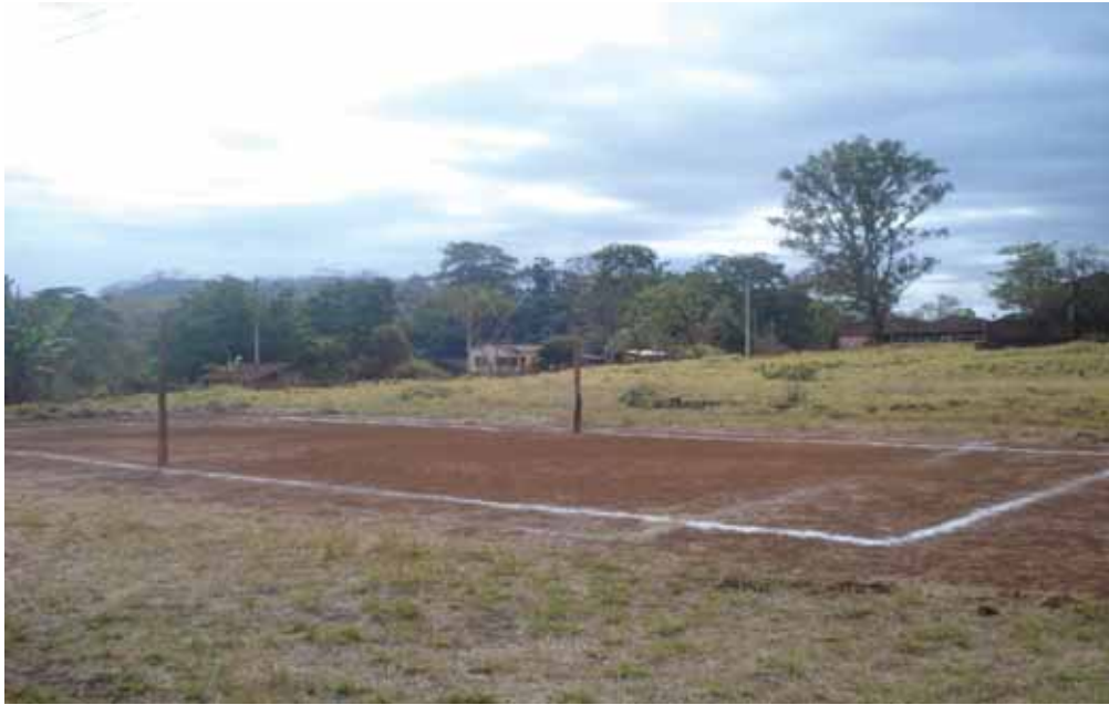
Figura 6 – Campo de Futebol

Entende-se a importância do lazer, aspecto considerado como uma das questões fundamentais para se ter saúde e qualidade de vida.