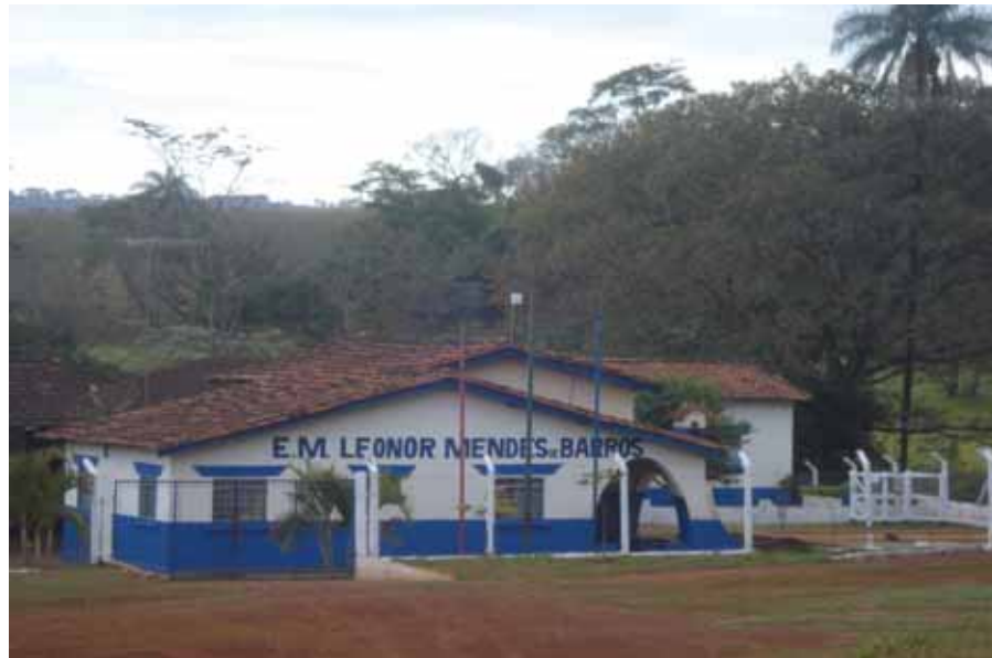
Figura 1 - Unidade da Escola de Educação Infantil do Municipal de Restinga (SP)

município de Restinga S.P, para darem continuidade em seus estudos. O transporte é gratuito e fornecido pela Prefeitura.