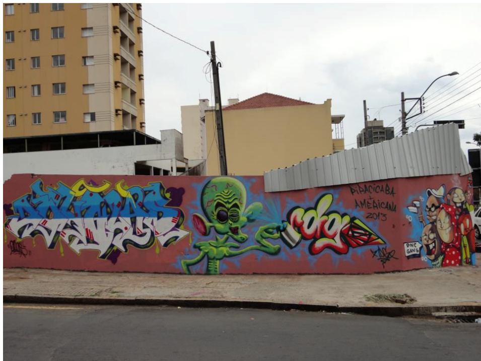
Grafite de Douglas, Rodrigo e outros autores – Centro de Piracicaba