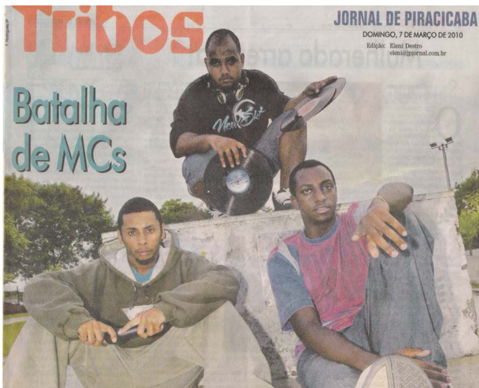
Batalha Central Especial Sesc – Jornal de Piracicaba – 07/04/2010