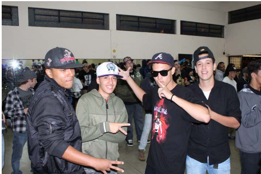
Cena do Louco Especial – Casa do Hip-hop de Piracicaba – 12/01/2012