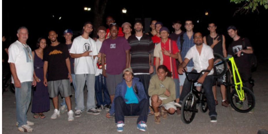
Batalha Central – Praça José Bonifácio – 04/2010