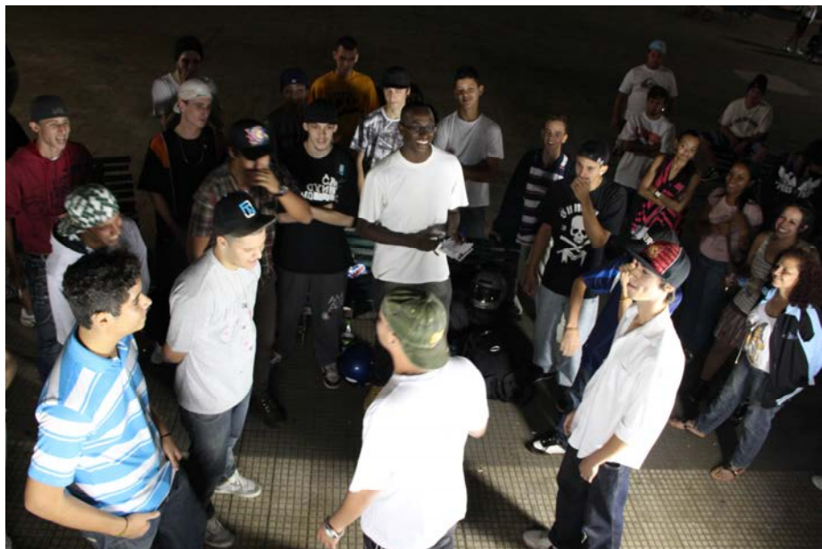
Batalha Central – Praça José Bonifácio – 04/2011