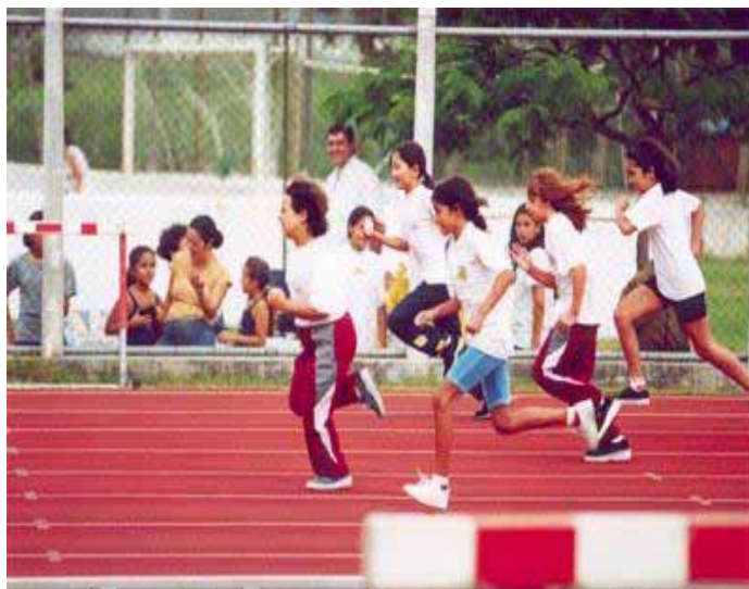
FOTO 1 - Alunos em aulas de educação física, São Bernardo do Campo - Arquivo Secretaria de Educação e Esportes, Prefeitura Municipal, 2001.