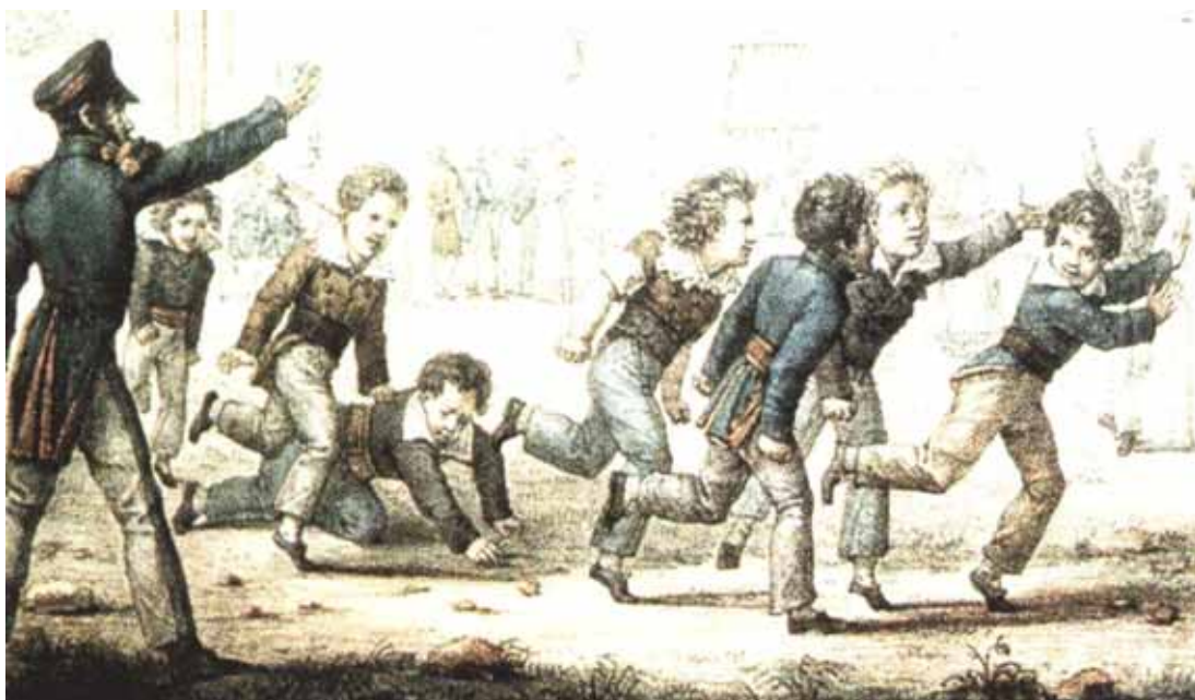
FIGURA 1 – Francisco Amoros comandando uma classe de alunos em seu Ginásio, em Paris.

Ao longo do século XIX na Europa, a ginástica já tinha afirmado-se como parte significativa dos novos códigos de civilidade; exibindo um corpo milimetricamente reformado, numa simetria nunca antes vista (SOARES, 1998). De modo geral, formou-se naquele século, uma “pedagogia do gesto [...], configurando-se assim, uma ‘educação do corpo’, já reconhecida como importante” (op. cit., p. 17).