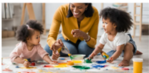
Rotina da turma